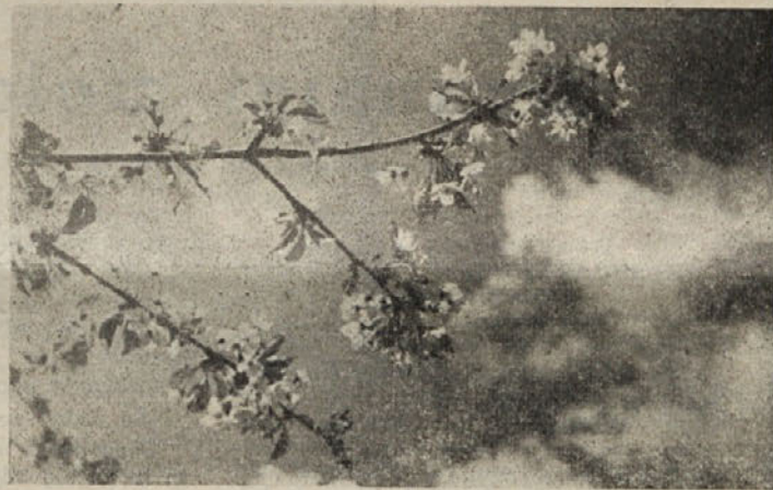
...EN ČEŠNJEV CVET...

Da boste imele lepo gladko kožo, si boste roke prav vsak večer namillile in si jih z umivalno vrečko ali krtačo zmasirale. Nato si boste peno izplaknile s toplo vodo in nazadnje še z mrzlo. Za brisanje bomo vzele grobo brisačo in si roke temeljito osušile. Če imate bolj suho kožo, si boste roke še namastile z mastno kremo.