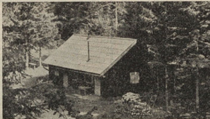
Planinska koča pri Jelenovem studencu

štva je dosegel precej uspehov z objavljanjem zapiskov in fotografij o dejavnosti Planinskega dru-