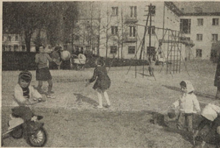
Na otroškem igrišču v Kočevju je vsak dan živahno. Žal igrišče ni primerno urejeno, pa tudi promet z raznimi vozili ogroža otroke

Film se zanima za okolico mladega Toma in se v tren- utku, ko bi se morala pričeti njegova osebna drama, začne ukvarjati s problemi hišniko- ve žene Laure. Le ta je kljub svojim letom zaljubljena v To- ma in ga skuša prepričati, da je nekdo na svetu, ki ga res- nično ljubi. Zaradi tega uniči svoj zakon. Film se konča s prizorom, ko Tom, sedaj že poročen, sreča hišnika, strtega človeka, ki je že dolga leta ločen od svoje žene. V glavnih vlogah nastopata Deborah Kerr in John Kerr.