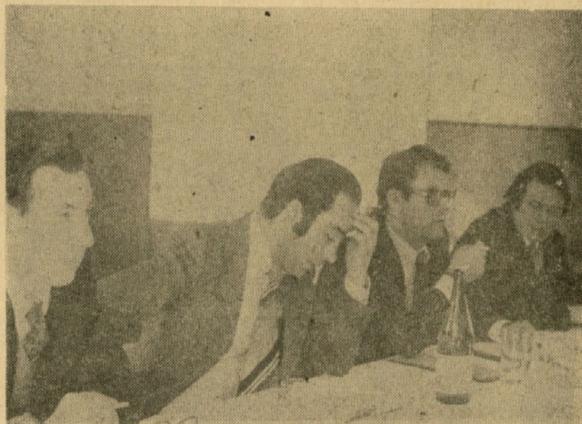
Splošna ugotovitev udeležencev je bila, da bi morali že marsikaj urediti...

Na sestanku osnovne organizacije ZK so se zmenili, da bodo uvedli kartoteko za slehernega člana osnovne organizacije, v kateri bodo razvidne vse funkcije in zadolžitve vsakega člana. To bo podlaga za oceno, ali je kdo preobremenjen ali pa brez kakršne koli zadolžitve.