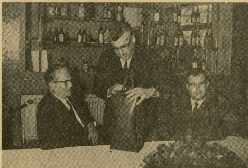
Predsednik republike Josip Broz-Tito je v aprilu 1969 obiskal tudi Rogoško Slatino, pa objavljamo ob 40. obletnici njegovega prihoda na čelo KPJ in sedanje ZKJ fotografijo z njegovega obiska!

Titov prihod na čelo partije pred štiridesetimi leti oznanja izvor naših hotenj in poznejših pridobitev, ki so živela v večnem upanju ljudstva tega podnebja, da živijo v slogi in svobodi in da si gradijo takšno življenje in bodočnost, kakršna najbolj odgovarja našemu delovnemu človeku, našemu ljudstvu.