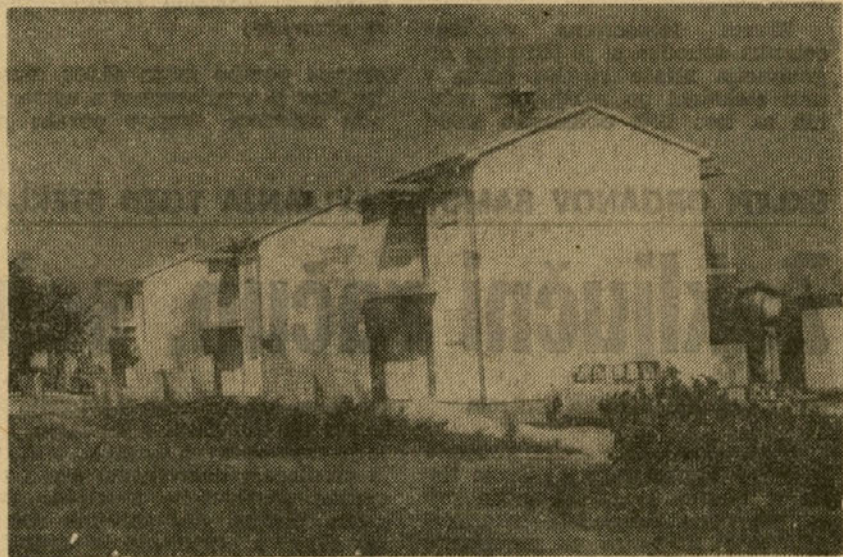
Blagodeti, ki jih nudijo naše počitniške hiše ob morju, naj bi uživalo čim več naših sodelavcev ter njihovih najbližnjih svojcev!

Odbor za medsebojna delovna razmerja je potrdil tudi razpored izkoriščanja letnih dopustov delav cev TOZD steklarna Rogaška Sla tina — oddelek peč za letoš, potrd il vrednost točke 1,79 dinarja za izračun višine štipendij, kar teme lji na sporazumu o štipendiranju dijakov in studentov, opravil pre gled zamud pri prihajanju na delo od 1. januarja naprej. V zvezi z zamujanjem dela je odbor za me sebojna delovna razmerja predlagal delavskemu svetu TOZD steklarna Rogaška Slatina, naj sprejme sklep o ukrepih zoper zamudnike ter sklep, naj se za opravičen izostanek šteje samo izostanek, ki je bil pred-