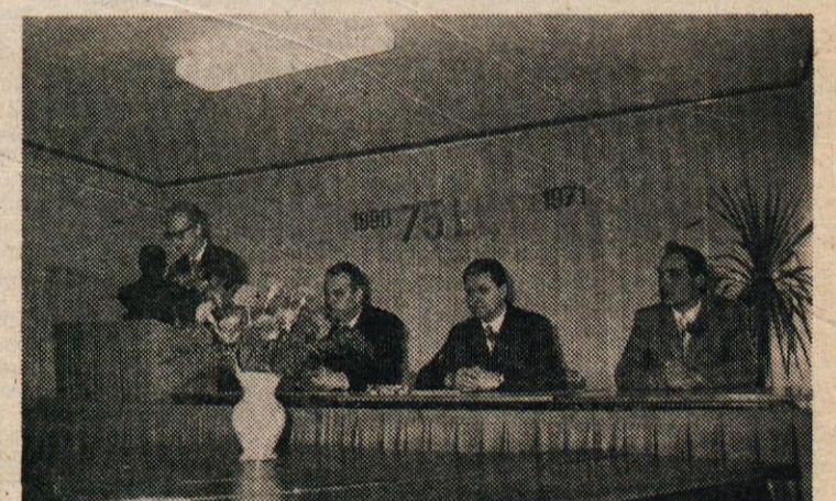
OB TITANOVEM JUBILEJU: MED GOVOROM ING. DUŠANA SILE, DIREKTORJA PODJETJA

Ob zaključku slovesne seje je de- lavski svet poslal pozdravno brzo- javko predsedniku republike in nek- danjemu Titanovemu delavcu Josipu Brozu Titu.