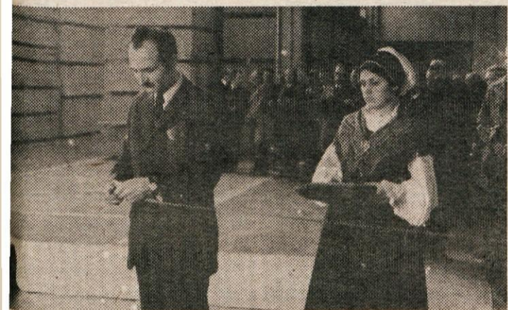
OTVORITVE NOVE TOVARNE PISARNIŠKEGA POHIŠTVA STOLU

so najbolj gospodarne. Zmogljivosti v novi proizvodnji omogočajo okrog 60 tisoč enot pisarniškega pohištva mesečno. Celotna proizvodnja pisarniškega pohištva se bo povečala za 150