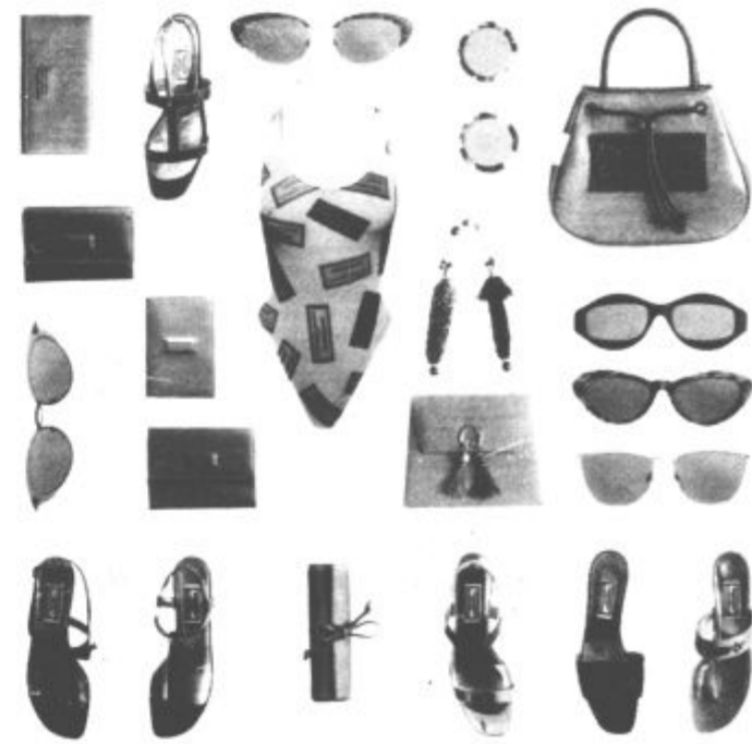
zon, le izrezi ob bokih so se povišali...

Pripravi pa bo treba tudi kopalke. Tudi v letošnjem poletju bodo prevladovali enodelni, pravilo pa ne bodo. Dvodelni niso več tako nizke, kot nekaj prejšnjih se-