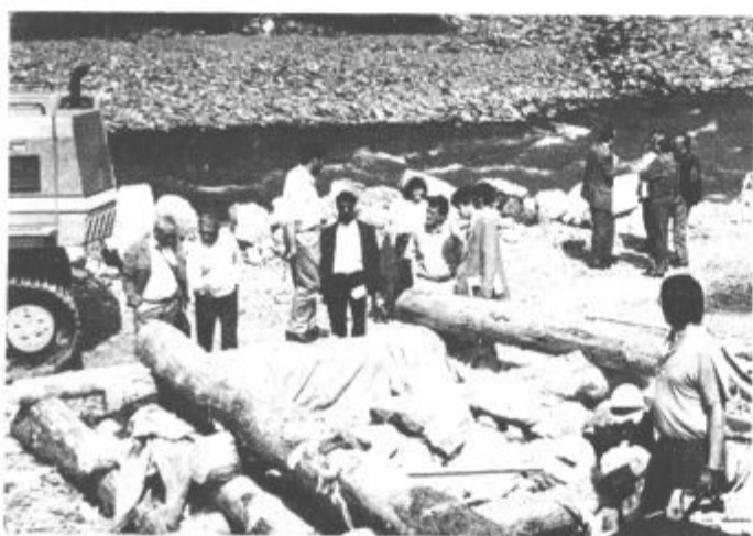
Gostje so si z zanimanjem ogledali način dela avstrijskih vodarjev

Komunalnega podjetja v lanskem letu, poročilo komisije, ki je proučila problematiko toplotnega omrežja Pohrastnik - cona E, vročevoda Metleče - Šoštanj in vročevoda Šoštanj - Velenje.