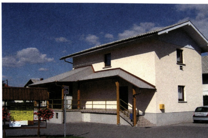
Nova podoba Doma KS Senica

Končni izračun je pokazal, da je KS Senica vložila za 34,6 odstotka, krajanji - graditelji pa za 65,4 odstotka vrednosti nepremičnin. Na zboru krajanov graditeljev skupnih objektov leta 1998, ko nadaljnja usoda krajevskih skupnosti še ni bila jasna, so si ti zastavili veliko