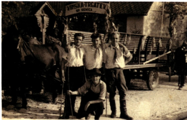
Vinska trgatev, 1955