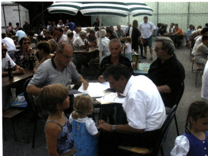
Komisija ocenjuje harmonikarje