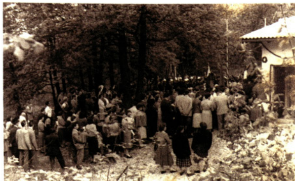
Množica na slovesnost ob odprtju vodovoda, 1959

slavnostnega govora lahko izvemo, da so materialni stroški znašali 16 milijonov dinarjev, da je »186 interesentov za vodo iz vseh sedmih vasi v času gradnje položilo v zemljo več kot sedem kilometrov azbestno - cementnih cevi in opravilo skoraj 70 tisoč delovnih ur, kar je toliko, da bi 25 najetih delavcev moralo garati celo leto«.