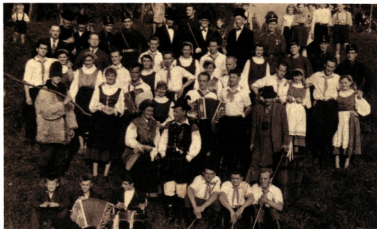
Dobro obiskana trgatev

Kljub temu, da naš kraj ni v vinorodnem področju, so iznajdljivi in domiselni krajanj pripravili tudi lepo obiskano vinsko trgatev 25. septembra 1955. V sprevodu so med