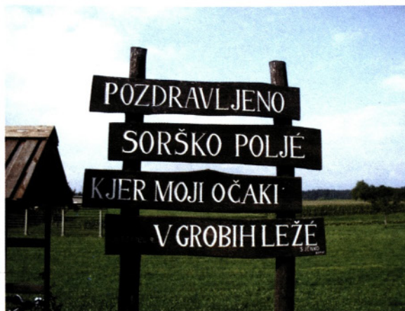
Pozdravna tabla Sorškemu polju

Podobo krajev dopolnjujejo stare lipe pri gramoznici na Jeprci, pri Krevsovih na Senici in Plenovih na Ladji. Svojevrsten pogled na ravnino Sorškega polja nudijo tudi značilne groblje. Ko so kmetje čistili in urejali polja, so namreč znosili kamenje na kupe in skozi leta jih je preraslo grmovje.