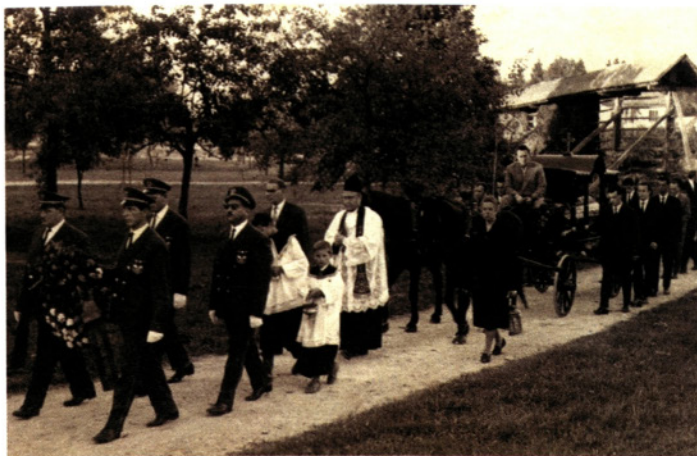
Mrliški voz na zadnji poti

Pobudnik za nakup mrliškega voza, saj so bile naše vasi preveč oddaljene od pokopališč, je bila organizacija Rdeči križ. Ohranjeni so dokumenti o nabavljenem materialu in nakupu