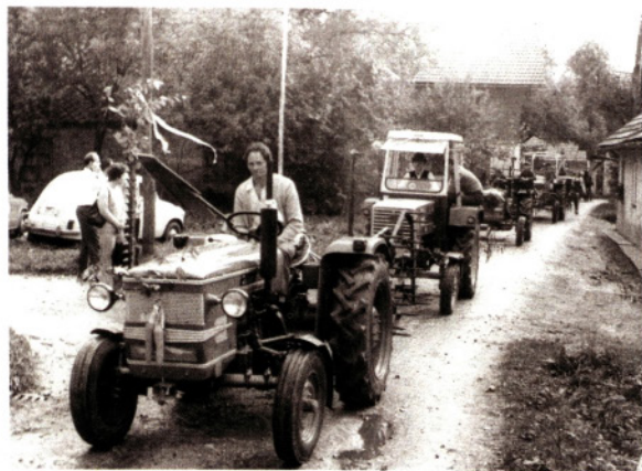
Križišče glavne ceste in ceste proti Svetju, pred asfaltom