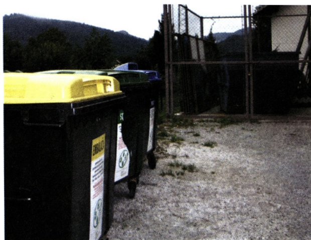
Zabojnik za kosovne odpadke in ekološki otok

gospodinjstev. Tako bi bile prizadete prav družine z majhnimi osebnimi dohodki...« Prvih ducat skupinskih zabojnikov, za nakup katerih so številna gospodinjstva spet segla v družinsko blagajno, je šlo v boj z divjimi odlagališči že leta 1982. V kasnejših zapisnikih se ta problematika omenja predvsem v neprijetnem kontekstu, češ da je okrog nekaterih skupnih zabojnikov vedno veliko nesnage. Rešitev že prav kmalu vidijo v hišnih zabojnikih, vendar naletijo na nezainteresiranost javnega podjetja Snaga, ki jim opravlja odvoz smeti