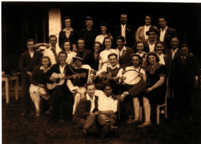
Seniška mladež kmalu po vojni