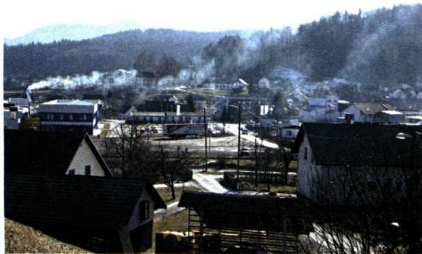
Dim z vonjem po fenolih

gospodinjstev. Tako bi bile prizadete prav družine z majhnimi osebnimi dohodki...« Prvih ducat skupinskih zabojnikov, za nakup katerih so številna gospodinjstva spet segla v družinsko blagajno, je šlo v boj z divjimi odlagališči že leta 1982. V kasnejših zapisnikih se ta problematika omenja predvsem v neprijetnem kontekstu, češ da je okrog nekaterih skupnih zabojnikov vedno veliko nesnage. Rešitev že prav kmalu vidijo v hišnih zabojnikih, vendar naletijo na nezainteresiranost javnega podjetja Snaga, ki jim opravlja odvoz smeti