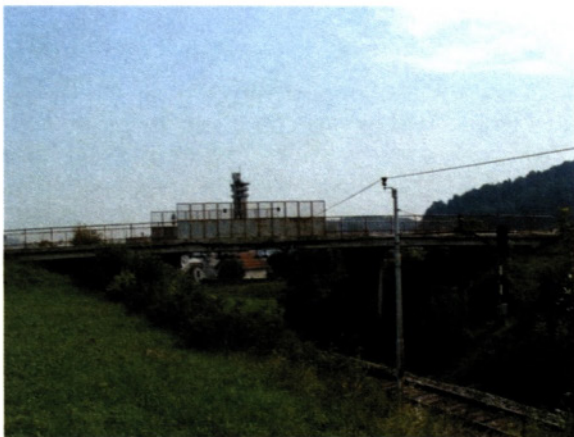
Čas in promet načela most na Ladji

»Procedura je bila običajno taka, da smo morali odkupiti cesto, ki smo jo želeli asfaltirati. Uredili smo jo do tampona; izkopali zemljo, zasuli z gramozom in ga zvaljali. To je bil naš prispevek za kasnejši občinski v obliki asfalta, za katerega pa se je bilo vedno potrebno spet boksat.«