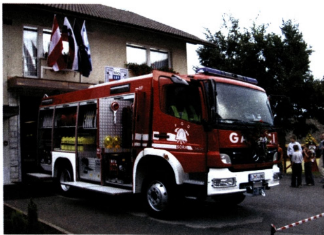
Tudi KS Senica botra novega gasilskega vozila PDG Sora