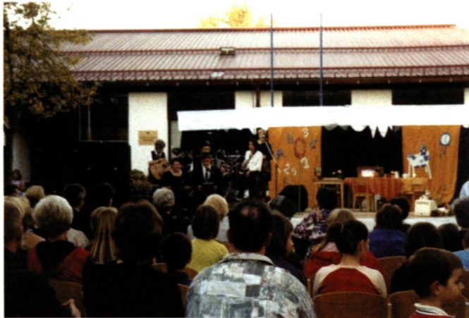
Slovesnost ob 20-letnici OŠ Medvode so oblikovali tudi krajanji Senice

namreč primanjkovalo učencev, zato je takratni ravnatelj celo preštel, koliko korakov imamo otroci z Zg. Senice do reteške in koliko do sorške šole, vendar naših doma ni prepričal.«