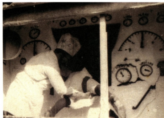
Mlin za pomlajevanje žensk