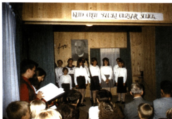
Odprtje dvorane v Domu KS Senica, 1996

Zelo ponosna sem na velik podvig, ureditev dvorane v domu. Z obnovo smo začeli oktobra 1995, otvoritev pa je bila 31. maja 1996.