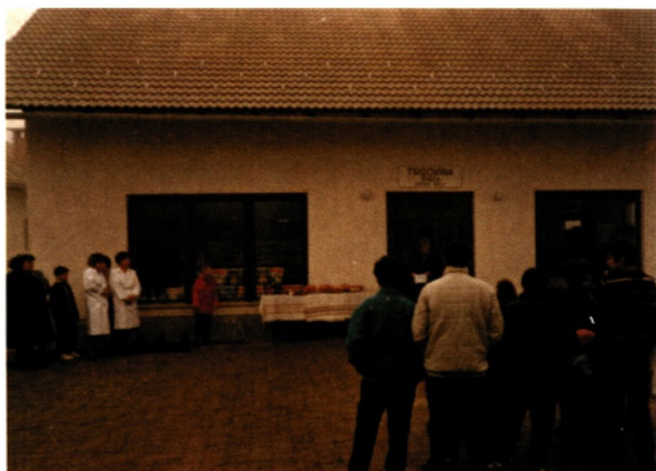
Prvi delovni dan Trgovine Senica, 1991

sicer opravila le največ deset, dvanajst med njimi pa več kot 70 prostovoljnih delavnih ur. Poleg tega je bilo opravljenih precej traktorskih ur in več kamionskih prevozov. Krajanji so prispevali tudi opažni material in ves gramoz za utrditev dna gradbene jame, betoniranje temeljev in obodnih sten. Kot ponavadi so jim z materialom na pomoč priskočila nekatera podjetja, najbolj ponovno Tovarna celuloze in papirja Goričane.