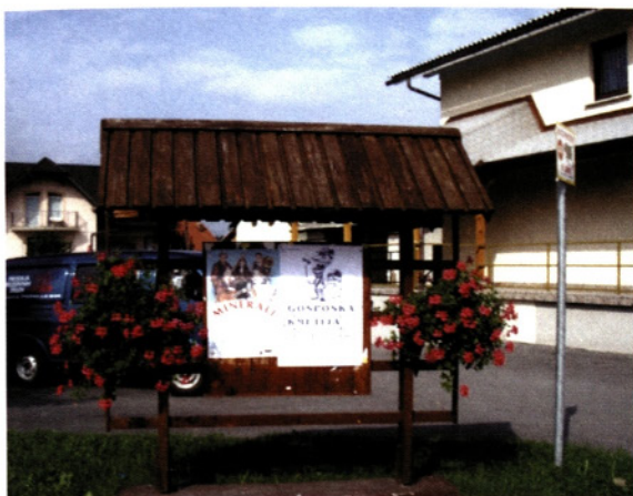
Miniaturni kozolci ali oglasne table

K lepšemu zgledu kraja svoje dodajo tudi miniaturni kozolci, ki zadnja leta informirajo krajanke o dogajanju v vasi in okolici.