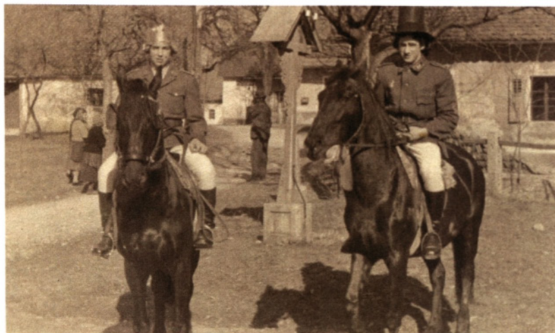
Konjenika najavljata prihod pustne povorke