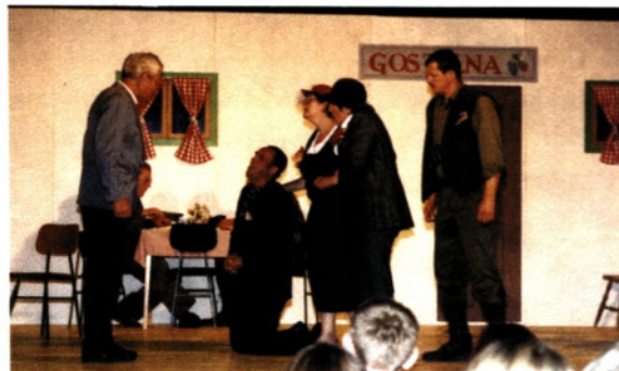
Glavni samici in glavna samca