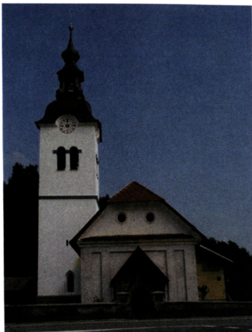
Jeprška cerkev, 2005

V neposredni bližini stojita dve cerkvi, obe podružnici sorške fare. Jeprška cerkev, z lepim portalom in letnico 1512 na slavoloku, je posvečena sv. Nikolaju, zavetniku vseh prevoznikov po vodi in predvsem velikemu dobrotniku otrok. Stranska oltarja sta