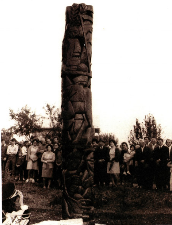
Pomnik kmečkim uporom, 1973