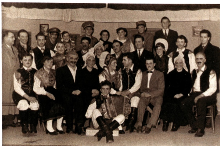
Pod Golico, 1956