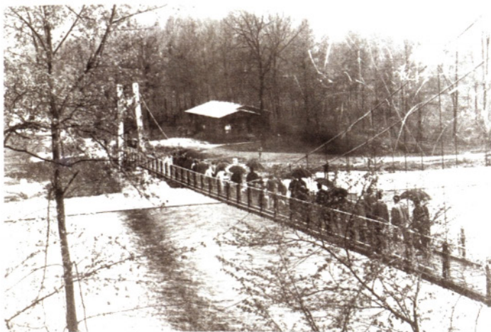
Prvič čez nov viseči most, 1971

Že septembra leta 1968 je narasla Sora ponovno močno načela visečo brv na Ladji, zato so morali otroci v šolo v Soro čez most v Goričanah. Zbrani na masovnem sestanku dva meseca kasneje so podali ugotovitev, da tisti z Zgornje Senice za pot potrebujejo sedaj kar dve uri. Imenovali so delegacijo, ki naj bi šla na občino in odgovornim prenesla željo, da se nov viseči most začne takoj graditi. Po burni razpravi so se namreč zedinili in dali prav