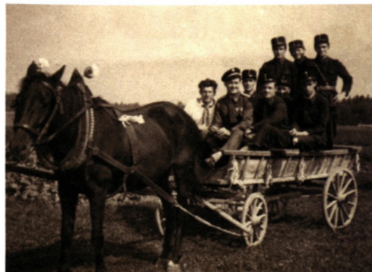
Budni policaji na trgatvi

Kljub temu, da naš kraj ni v vinorodnem področju, so iznajdljivi in domiselni krajanj pripravili tudi lepo obiskano vinsko trgatev 25. septembra 1955. V sprevodu so med