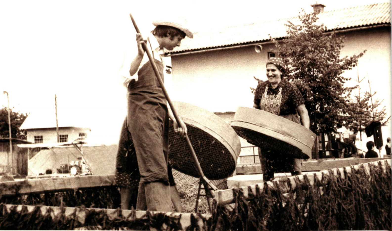
Prikaz kmečkih opravil, 1977