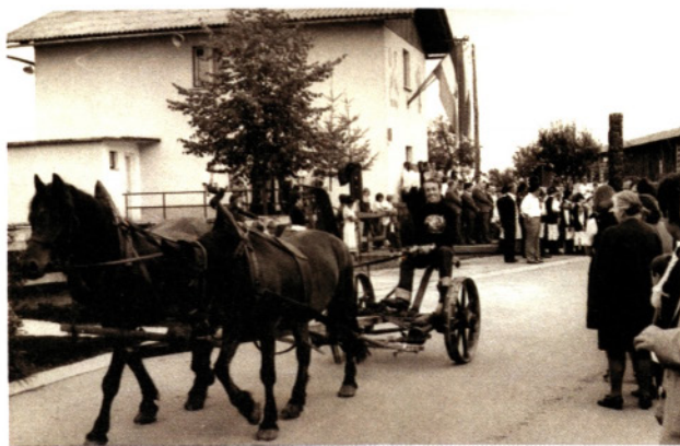
Povorka skozi vas, 1977