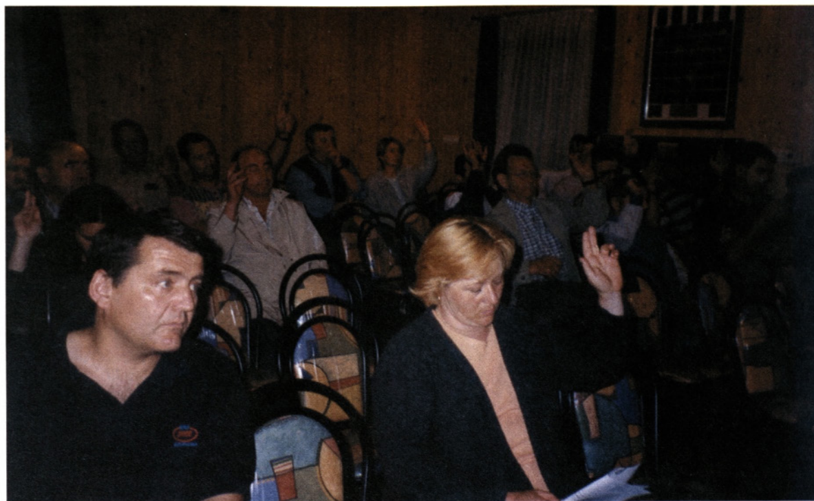
Na zboru krajanov, 2000

so že na zboru sredi leta 1995 namreč dali predstavnikom občine