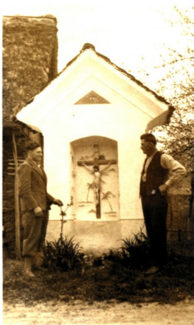
Polenčeva kapelica, farna meja