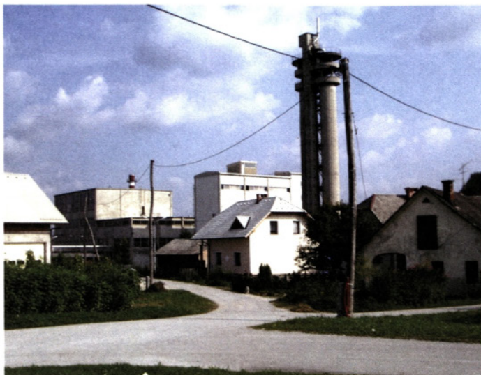
Simbioza med krajem in tovarno