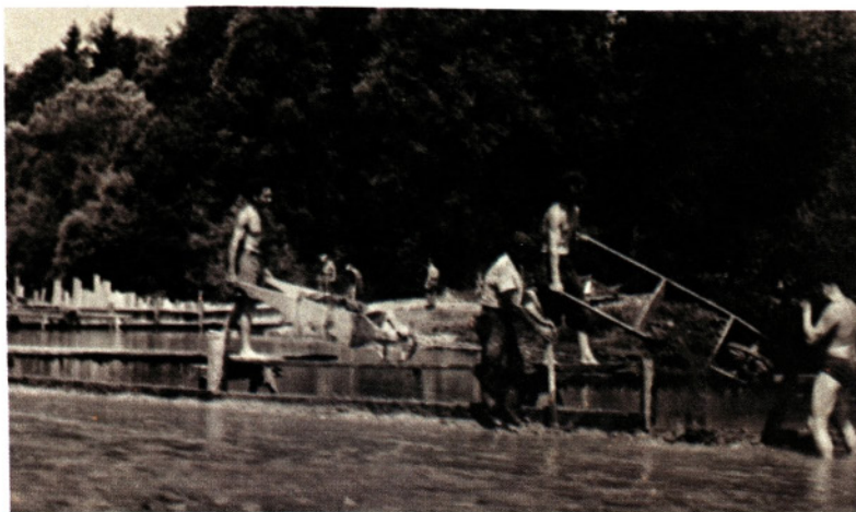
Gradnja vodovoda čez reko Soro, 1956