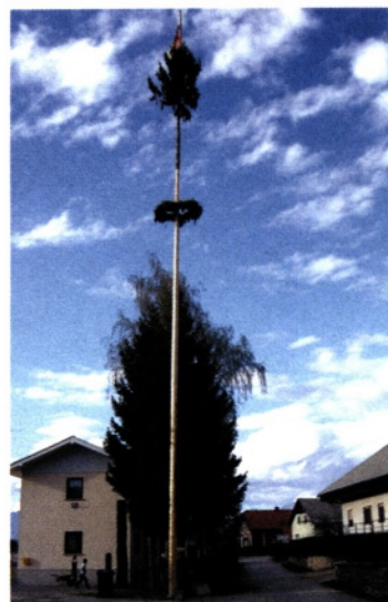
Prvomajski mlaj, 2004