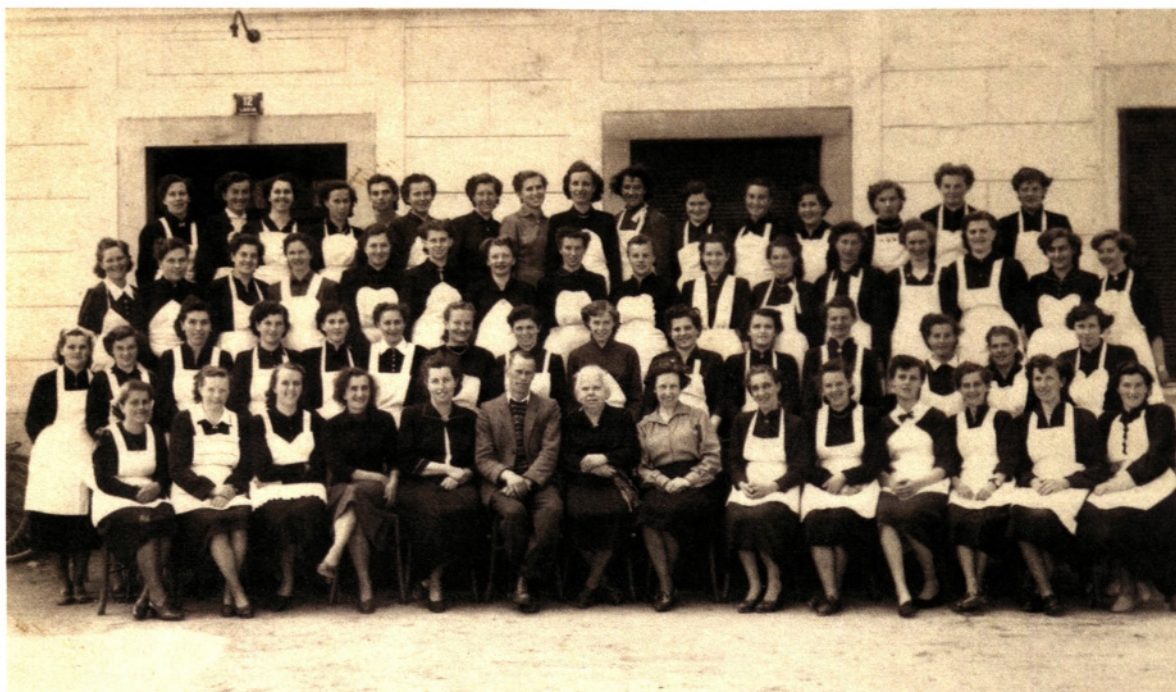
Udeleženke kuharskega tečaja