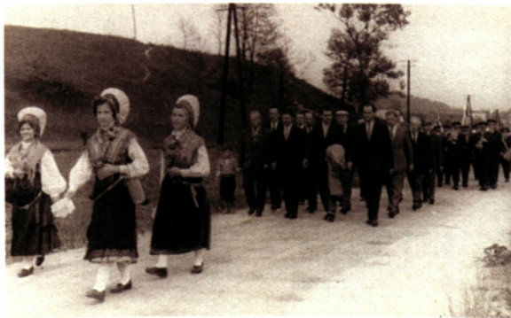
Odborniki vodovodne skupnosti v sprevedu do zajetja