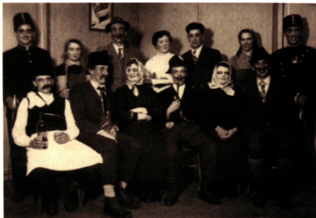
Prva uprizoritev igre Davek na samce, 1956