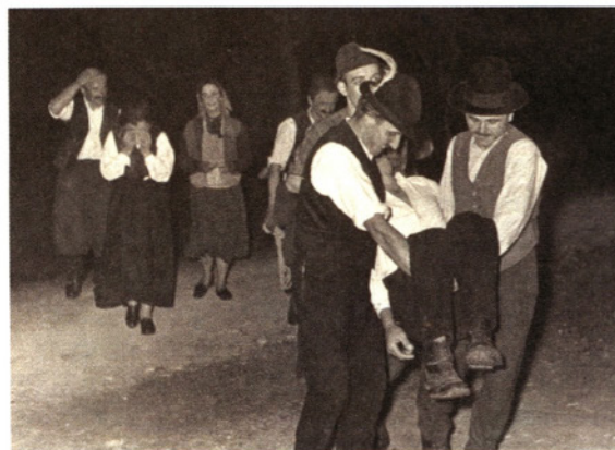
Uprizoritev igre Veriga, 1957