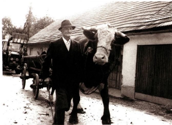
Od volovske vprege do traktorskega priključka

S kmečko povorko so dopolnili in popestrili slovesnost ob odkritju spomenika ob 400-letnici kmečkih uporov leta 1973 in je bila verjetno prva v Sloveniji. V njej so sodelovali številni udeleženci s prikazom kmečkih opravil, orodja in mehanizacije - od volovske vprege do modernega traktorja s priključki. Podobna povorka se je peljala skozi vasi tudi štiri leta kasneje ob odkritju spominskega obeležja igri Veriga in leta 1980 ob razvitju prapora strojne skupnosti.