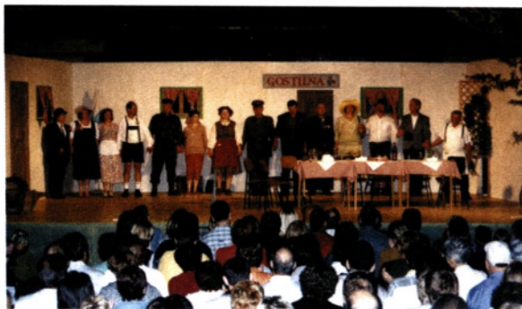
Davek na samce, 2003