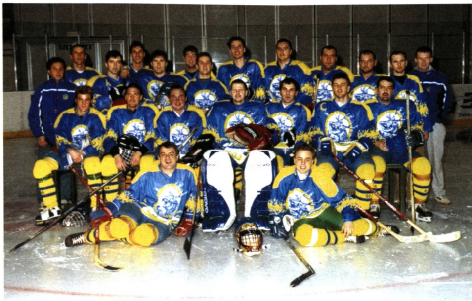
Hokejski klub Jelen