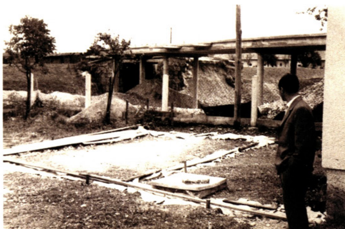
Gradnja mostu čez železniško progo na Zg. Senici, 1960 - 1963

Zbornik Škofja Loka in loško gospostvo (1973) navaja, da je po podatkih iz urbarja za leto 1540 - 1543 v starološko gospostvo spadal tudi grunt na Senici. Že v preteklosti je bilo zunaj jedra vasi nekaj posameznih hiš, med njimi tudi gostilna in kovačija na Jeprci, ki je omenjena kot mejna točka loškega posestva Freisinških škofov. Bila je tudi pomembno transportno in trgovsko stičišče regionalne ceste Kranj - Jeprca z lokalno povezavo Škofja Loka - Jeprca, ki so jo gradili od leta 1776 dalje. Isti vir navaja, da je bilo prebivalstvo