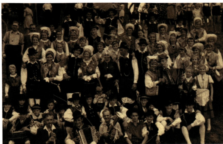
Kmečka ohcet, 1955