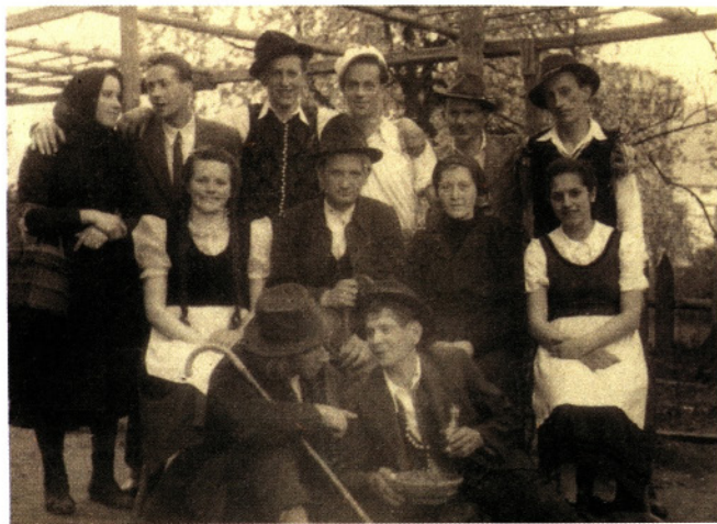
Igralska skupina, igra Dve nevesti