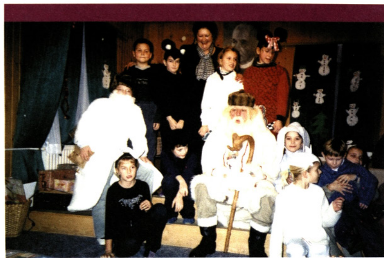
Obisk Dedka mraza, 2002