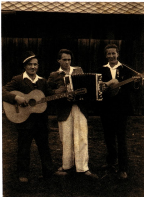
Trije vaški glasbeniki

K rajani vasi Zgornja in Spodnja Senica ter Ladje so bili vedno družabni in pripravljeni za skupno delo. V preteklosti, predvsem v letih po drugi svetovni vojni, so bile možnosti za družabnost majhne, ljudje zelo skromni, vendar z velikimi pričakovanji, dobrimi idejami in predvsem so bili zelo iznajdljivi. Povezovalo jih je prijateljstvo in