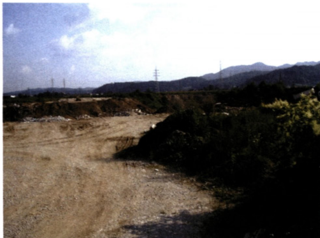
Opuščena gramoznica med zasipanjem

prekoračili vse razumne meje, saj je bil ves čas poln. Vanj so namreč odlagali odpadke tudi krajanji sosednjih občin, nekateri obrtniki pa so ga polnili kar z delovnimi stroji. Sedaj je zagrajen, postavljen poleg strojne lope in na voljo zgolj krajanom KS Senica, vsako