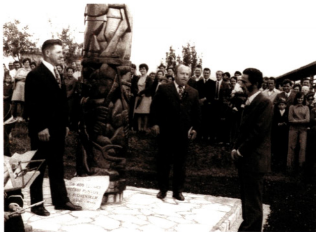
Odkritje obeležja kmečkim uporom, 1973