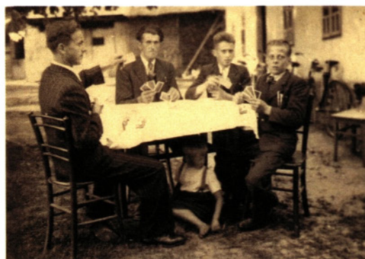
Vesela družba ob kartah