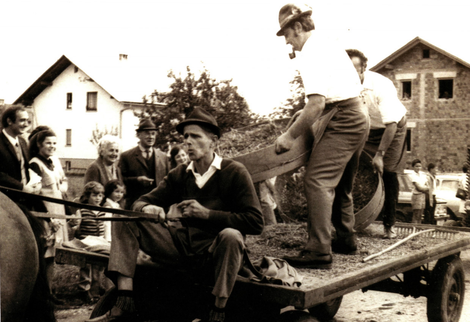
Prikaz kmečkih opravil, 1973