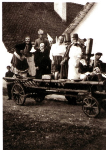
Voz z maškarami pri Polenčevih