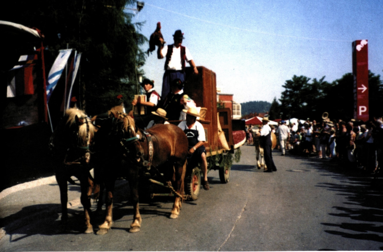
Voz z balo