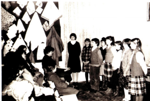
Razstave ročnih del v DU Medvode, 1982