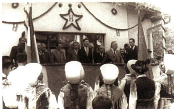
Oder s slavnostnimi govorniki

Sredi leta 1957 je vodovod sedmih vasi prevzel v upravljanje Svet za komunalne in stanovanjske zadeve občine Medvode in ga leta 1960 oddal v upravljanje Komunalnemu