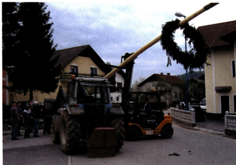
Postavljanje prvomajskega mlaja