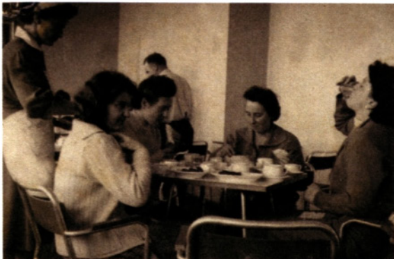
Okrepčilo po krvodajalski akciji

udeleževali krvodajalskih akcij, saj so bile te dobro organizirane. Avtobus z zdravstvenim osebjem in priročnim laboratorijem je namreč vozil kar po vaseh.