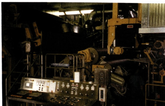
Goričanska papirnica - majhna in uspešna

Razvoj, oziroma »nazadovanje« starega dela vasi Ladja je vse od ustanovitve leta 1787 narekovala Papirnica Goričane s svojimi načrti in proizvodnjo bodisi celuloze, pinotana ali zgolj, kot dandanes, vseh vrst papirja. Tako zapisniki s sej in zborov kot tudi naši sogovorniki so tovarno, kakorkoli se je ta že imenovala, večkrat omenjali. Največkrat sicer kot vir sredstev za nove pridobitve v kraju, saj kot je dejal mnogokratni vezni člen med