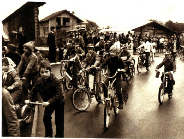
Prva uradna vožnja po novem asfaltu, 1974

Uradno odprtje nove ceste, združeno s proslavo delovne zmage v okviru KS Medvode, je bilo 13. oktobra 1974. Po čisto svežem asfaltu so se v povorki zapeljali na skirojih, kolesih, motociklih, avtomobilih, traktorjih... skratka z vsem, kar se pelje in gre. Vse tri vasi skupaj naj bi tedaj premogle 57 osebnih avtomobilov, 16 traktorjev in 2 tovornjaka. Ko je bil na cesto skozi vasi položen asfalt, bi bilo skoraj bogokletno razmišljati, da naj