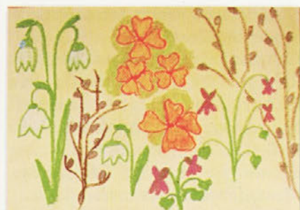
Tadeja Vaupotič 2.a

Moji mamici je ime Slavica. Ima rjave nakodrane lase, vsak dan si obleče trenirko. Ima rjave oči in je zelo vesela. Vsako popoldan mi skuha dobro