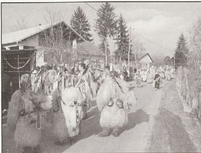
Pustovanje v Gajevecih