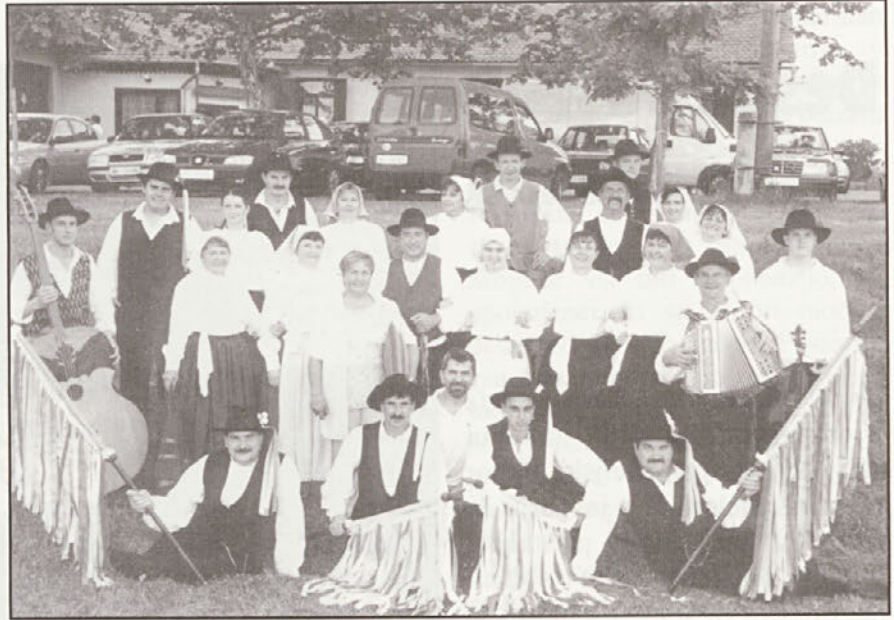
Folklorna skupina PD Ruda Sever Gorišnica