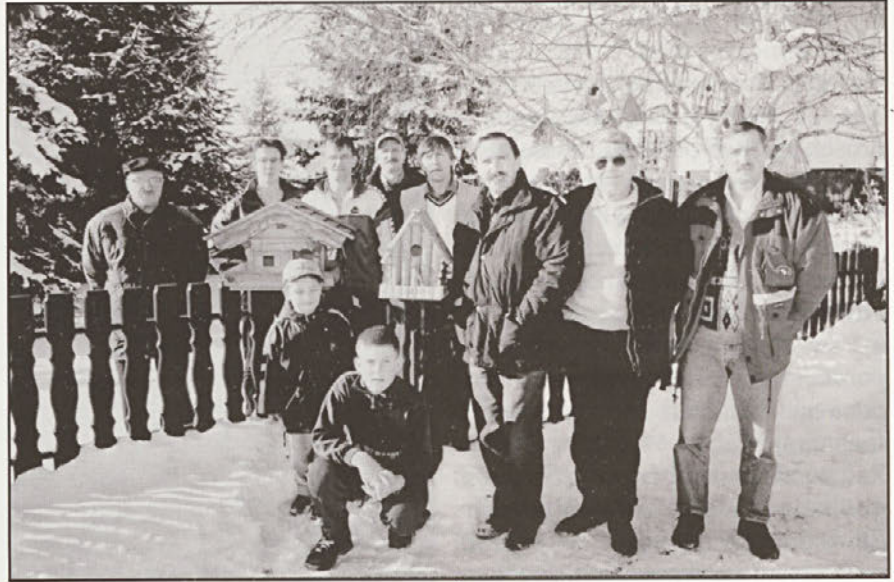
Člani društva za varstvo in vzgojo ptic

Obenem člani Društva za varstvo in vzgojo ptic Gorišnica prosimo vse občane, predvsem mlajše, da se