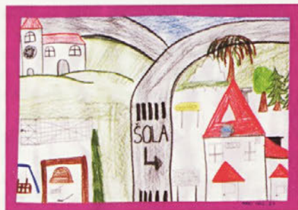
Tadej Kelc, 2.a

Učenci 1. razreda devetletke OŠ Cirkulane