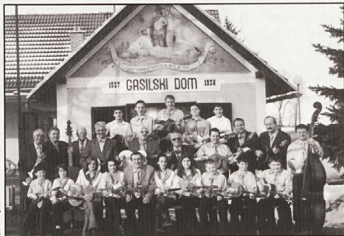
Tamburaši PD Ruda Sever Gorišnica