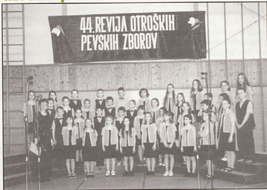
Otroški pevski zbor OŠ Gorišnica