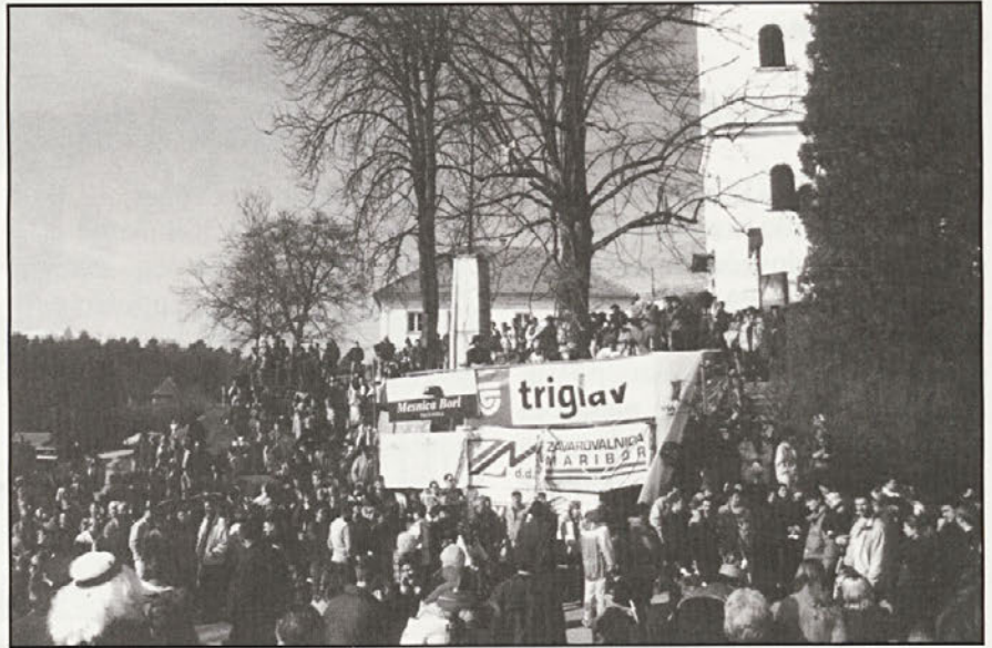
Na desetem fašenku v Cirkulanah se je zbralo veliko število obiskovalcev

Že več let opozarjamo, da se mora v karneval vključiti čim več domačih skupin. Zahvaliti moramo, vsem, ki so sodelovali na povorki, še posebej VO Slatina Okič, ki vsako leto organizira eno ali dve skupini in na VO Formin,