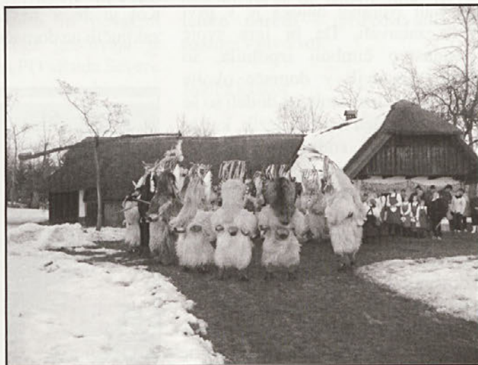
Lükarice so pripravile sprejem za kurente na Dominkovi domačiji

V letu 2003 smo nastope pričele na občnem zboru PGD Moškanjci. Za pusta smo pričakale kurante na Dominkovi domačiji. Njihove jezevke smo obogatile z robčki ki jih je prispeval naša občina. Odzvale smo se tudi povabilu Mlekarske zadruge Ptuj, prepevale na občnem zboru pridelovalcem zelenjave v Moškanjcih, popestrile materinski dan v Gorišnici in zapele na območni reviji mladih folklornih skupin. Sedaj se pripravljamo za nastop na VII.