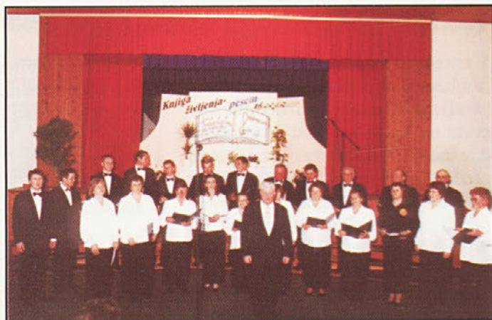
Jožefov koncert v Cirkulanah