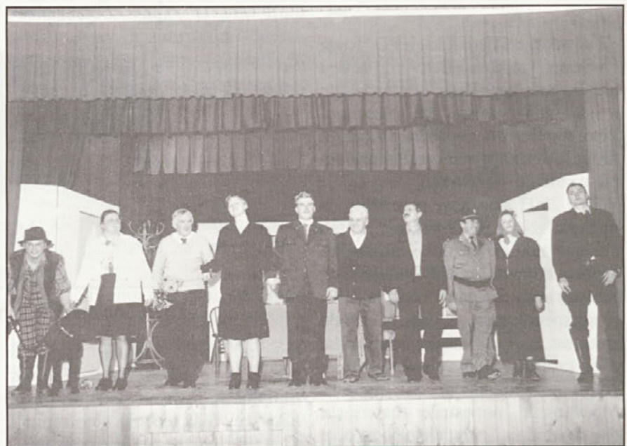
Uprizoritev gledališke skupine v Cirkulanah, Maksek