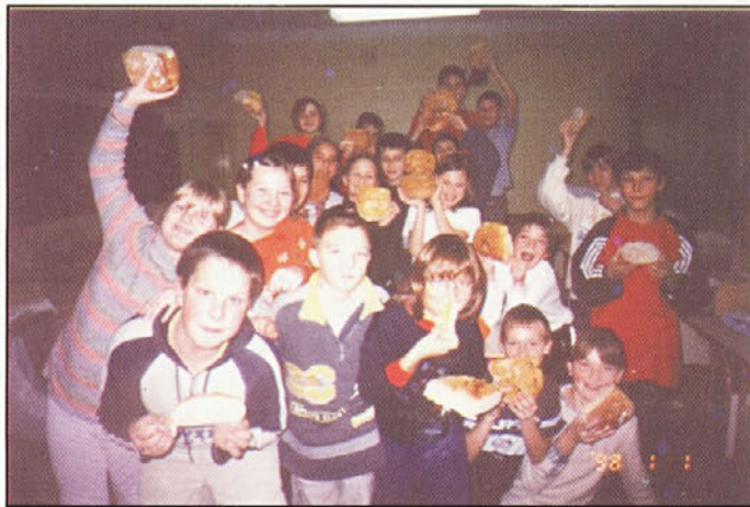
Veselje po opravljenem delu