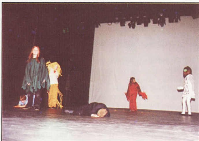
Mlade plesalke iz OŠ Gorišnica

pustil. Zato je smreka tudi pozimi zelena.