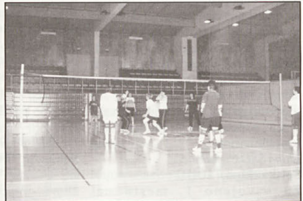
Dvakrat tedensko se na igriščih zbere več kot dvajset rekreativcev

Tudi letošnjo zimo je Športna zveza Občine Gorišnica organizirala smučanje v Avstriji. Prvič smo se v Gerlitzten odpravili 28. decembra, drugič pa 25. januarja. V prejšnjih sezonah smo imeli z izbiro dneva več sreče, saj smo se zmeraj naužili zimskih radosti v lepem sončnem vremenu. Letos pa smo spoznali tudi tisto manj prijetno stran zime. Obakrat smo se odpravili v slabem vremenu; prvič je deževalo, snežilo, drugič pa nas je motil precej močan veter in mraz. Ker pa je bilo zaradi slabših vremenskih razmer zelo malo obiskovalcev, smo se lahko zares nasmučali. Veseli nas predvsem dejstvo, da se smučanja udeležujejo predstavniki različnih starostnih kategorij. Tako smo imeli na avtobusu od 6 pa do 60 let stare smučarje. S smučanjem nameravamo nadaljevati in tudi v