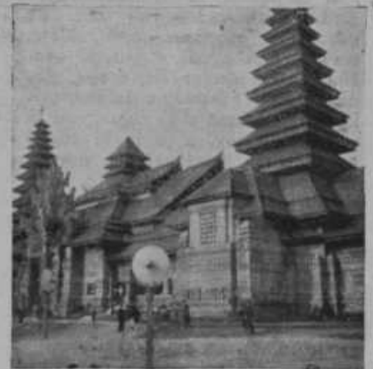
Slika na desni: Holandski paviljon na kolonijalni razstavi v Parizu, ki je koncem julija pogorel. Pariška kolonijalna razstava je velikanska in nudi obiskovalcem sicer težko dostopne zanimivosti. Razstava je na prostoru, velikem kakor mesto Maribor.