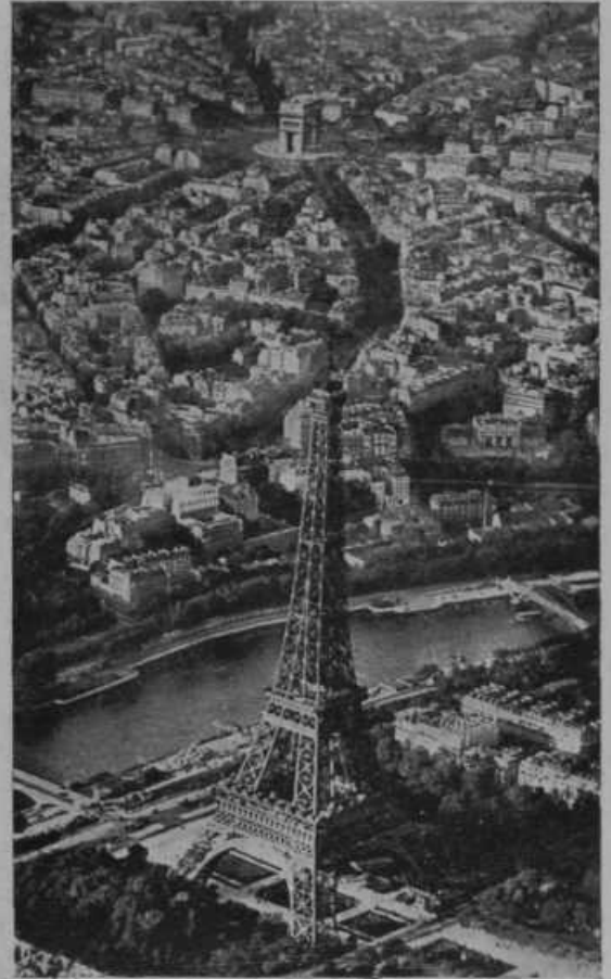
Pariz, središče mednarodne politike. V ospredju znameniti Eiffelov stolp, na sliki zgoraj slavolok, ki ga je postavil že Napoleon in pod katerim je sedaj grob francoskega neznanega vojaka.