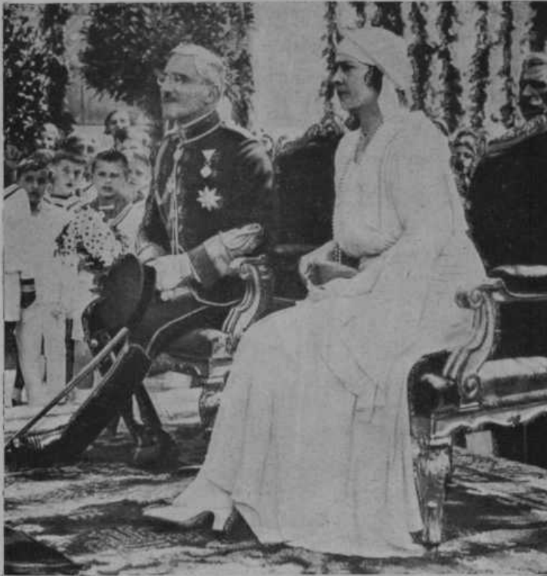
Njuni Veličanstvi kralj Aleksander in kraljica Marija ob priliki proslav v Zagrebu. — Kralj Aleksander je 17. avgusta t.l. praznoval 10 letnico svojega vladanja. Po vsej državi se je ta obletnica slovesno proslavila. Kralj Aleksander je bil rojen 17. decembra 1888 na Cetinju kot četrti sin tedanjega kneza Petra Karadžordževića. Leta 1914. je postal regent. Leta 1921. pa kralj Kraljevine Srbov, Hrvatov in Slovencev.