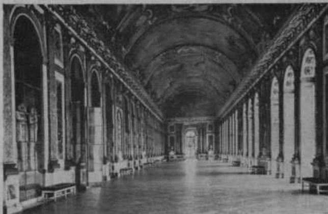
Slika na levi: Zrcalna dvorana v Versaju (Versailles) pri Parizu, kjer je bil podpisan mir po svetovni vojni. Danes se mnogo govori o spremembi versajske mirovne pogodbe.