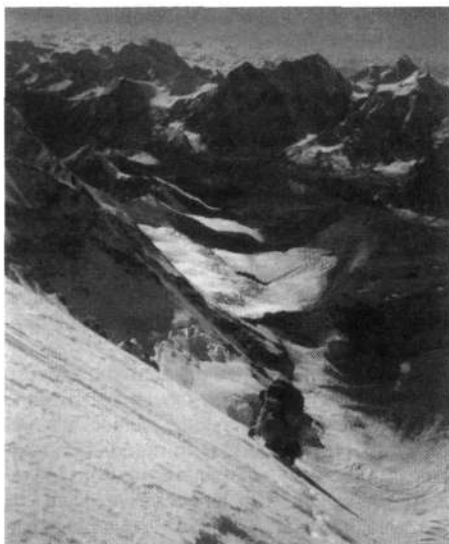
Visoko zasnežena pobočja Šiše Pangme

sničili svojih drugih ciljev, ki pa jih zaradi snežnih razmer in hudega vetra verjetno tudi sicer ne bi.