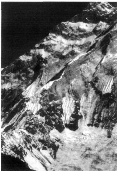
Anapurna, edini osemtisočak, ki se še upira slovenskim alpinistom