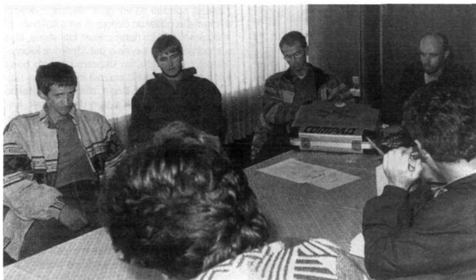
Četverica slovenskih alpinističnih smučarjev po vrnitvi z odprave »Ski 8000« na Šišo Pangmo

je 9. oktobra skupaj z vodjo odprave helikopter odpeljal v Katmandu, od tam pa se je vrnil v Ljubljano in takoj odšel na preglede v bolnišnico.