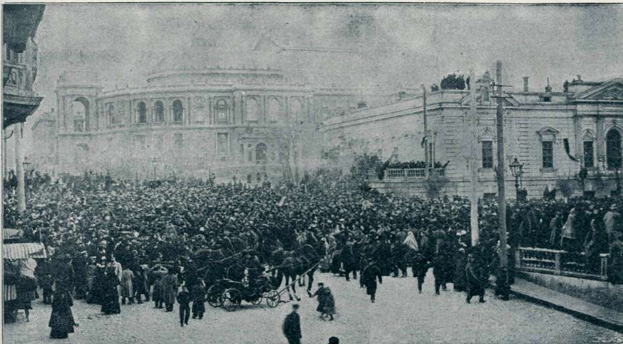
NEMIRI V ODESI: MNOŽICA PRED OPERO.

Tačas pa se vrše v Rusiji sami nevarne stvari. Agitacija za ustavo na Ruskem je dosegla, da je izdal car ukaz, po katerem se dovoljuje verska svoboda, a