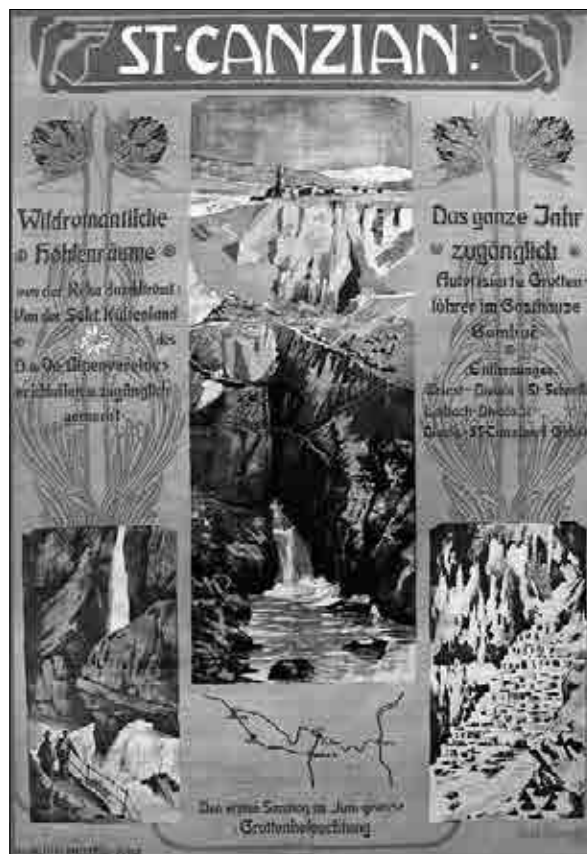
Plakat Roberta Hlavatyja, ki vabi na obisk jam ob posebni razsvetljavi ( Grottenbeleuchtung ).

Na to, da si je sekcija prizadevala obisk jame promovirati najširši javnosti, kaže tudi prirejanje jamskega praznika – Grottenfest . Leta 1885 se je več kot sto članov sekcije z nedeljskim hitrim vlakom pripeljalo do Divače, od koder so jih nato pripeljali do Matavuna. Po zajtrku so se ob 11. uri odpravili v jamo, kjer jim je dobrodošlico zaigrala godba. Obiskovalci so se spustili do Rudolfove dvorane. Po obisku, ki je trajal