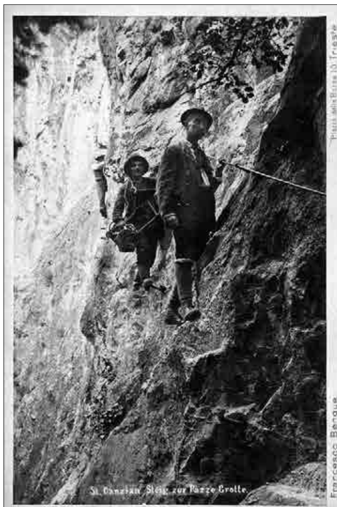
Jamarski raziskovalci in vodniki konec 19. stoletja, steza proti Pazzejevi luknji (Arhiv Parka Škocjanske jame – Fototeca dei Civici Musei di Trieste).

Obdobje, ki je močno zaznamovalo turizem v Škocjanskih jamah, se je začelo z ustanovitvijo odseka/sekcije za raziskovanje jam ( Abtheilung für Grottenforschung ) 73 pri primorski sekciji nemško-avstrijskega planinskega društva (DuÖAV). 74 Primorska sekcija DuÖAV – Sektion Küstenland des DuÖAV – je bila ustanovljena v Trstu leta 1873. Bila je aktivna na področju urejanja planinskih koč in poti ter organiziranja predavanj in turističnih izletov. Imela je pomembno vlogo pri razvoju jamskega turizma. 75 Škocjanske jame je sekcija v dogovoru z davčno občino Naklo dobila v zakup leta 1884, najprej za dobo