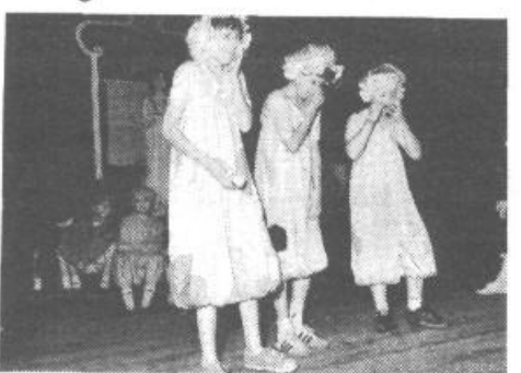
Prizor iz igrice Salon expon