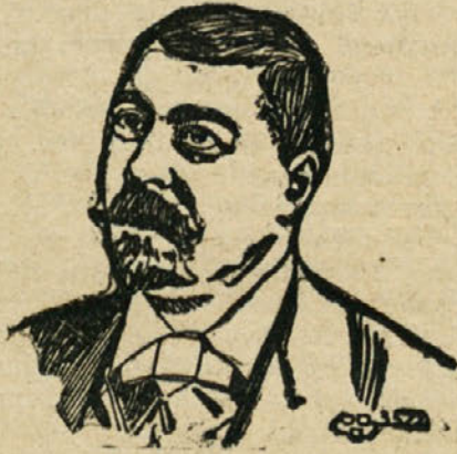
Bolgarski ministrski predsednik Petkov.