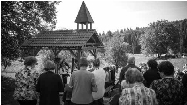
Zbrani, da se ne pozabi

Junija 1949 je bilo na zaprtem območju Kočevja, v nekdanji kočevarski vasi Verdreng, poslovenjeno Ferdreng (pozneje so jo preimenovali v Podlesje), iz katere so bili Kočevjarji izseljeni že med vojno, ustanovljeno žensko delovno taborišče, kjer so morale opravljati »družbenokoristno delo«. V enem mesecu so taborišče napolnili z 800 dekleti,