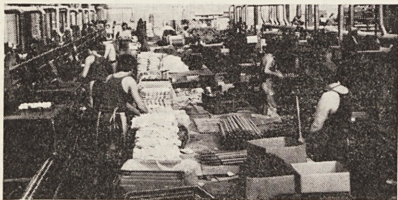
V TTI bodo predvsem modernizirali del visoko akumulativne proizvodnje

S pridobitvijo proizvodnih prostorov (10—15 tisoč kv. m) in preselitvijo tozda Preveleke valjev, Rotokirja in Velozračnic bo omogočena širitev proizvodnje cevi in klinastih jermenov.