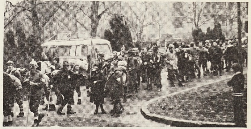
Na letošnjem Igmanskem maršu je sodelovalo okoli 300 udeležencev

Mi smo bili danes zvesti in ponosni poslušalci spominskih besed o velikem boju in žrtvah za našo svobodo, ki jo danes uživamo. Vse to, kar sem slišal, se mi je zdelo neverjetno, toda vse to so bili resnič-