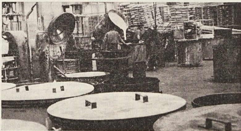
V Umetnem usnju bodo pripravili projekt izdelave PVC transportnih trakov

Ko smo skupaj s proizvodnimi tozdi analizirali njihove potrebe glede izdelave kalupov, novih strojev, izdelave rezervnih delov in od-