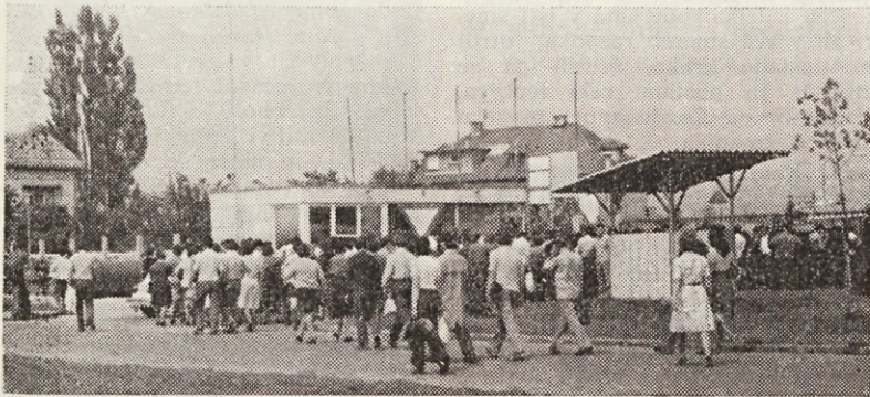
Z gibljivim delovnim časom bi radi dosegli: večje delovne učinke, manj prerivanja na cestah, večji red in disciplino pri prihodu na delo...

Kako je z uvedbo gibljivega delovnega časa v proizvodnji? Kot vemo je industrijska proizvodnja organiziran delovni proces, v katerem z deljenim delom in njegovo mehanizacijo predelujemo naravne snovi v proizvode. Delavci so v takšnem procesu neposredno odvisni drug od drugega. Svoboda odločanja posameznika o delu in delovnem času je malenkostna. Vendar je takšna oblika proizvodnje redka. V industrijskem procesu združuje svoje delo veliko število delavcev, zato je njihovo usklajenost najlažje doseči z natančnim predpisovanjem opravil, z določanjem načina in tudi časa za njihovo opravljanje. Vendar časovno planiranje izhaja največkrat iz poprečnih vrednosti. Vemo pa, da so te vrednosti vzete zelo naključno. Seveda pa časovno planiranje v