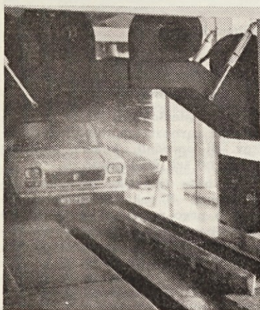
Temeljito čiščenje avtomobila v avtopralnici

naredilo namreč nadvse taktno potezo, ko je v sredstvih obveščanja razglasilo, da bo omejnega dne brezplačno pranje