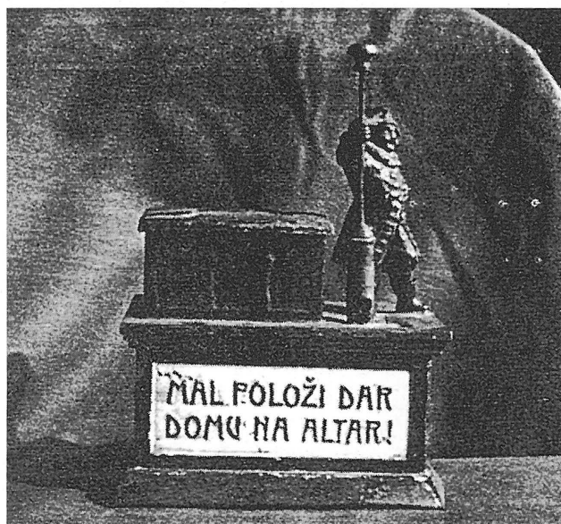
Nabiralnik Družbe Sv. Cirila in Metoda z značilno napravo za prerezovanje viržink. Tako odrezane kose so poleg denarja zbirali v nabiralnikih, CMD pa jih je prodajala kadilcem pip (Razstavna zbirka Slovenskega šolskega muzeja v Ljubljani).

S tem so zavedni slovenski borci za gimnazijo v Gorici postavili avstrijsko oblast pred odločitev, ali naj bi ta ustanovila eno slovensko in eno italijansko zasebno gimnazijo, sama pa bi vzdrževala nemško, ali pa se naj bi odločila po svoje. Avstrijska država je zavrnila možnost obstoja zasebne slovenske gimnazije, češ da ni dovolj sredstev za vzdrževanje šole, s tem pa se je odločila, da leta 1910 sama uvede slovenske in italijanske paralelke (kot so mnogi Slovenci to že zahtevali) na državni gimnaziji. Pri tem je predpisala, da se lahko vpiše na gimnazijo le določeno število dijakov in da bo za eden ali drugi predmet učni jezik nemški (Ipavec, 1914). S tem so se prizadevanja za slovenski učni jezik v gimnaziji nadaljevala. Takratni svetnik Fon je ponovno posredoval pri »naučnem« ministrstvu za rešitev goriškega gimnazijskega vprašanja. Nazadnje se je ministrstvo odločilo, da bo ustanovilo eno slovensko in eno italijansko paralelko pri c. kr. državni gimnaziji z nemškim učnim jezikom v Gorici, in sicer z omejitvi-