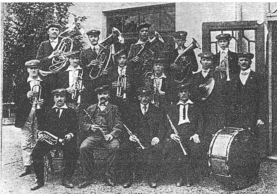
Godbeno društvo v Lokavcu pri Ajdovščini leta 1908 (iz Goriškega zbornika 1947–1957, Nova Gorica, 1957, str. 237).

Med prosvetna društva pa uvrščamo v omenjenem obdobju tudi slovenska učiteljska društva, ki so po vsem slovenskem ozemlju prav gotovo veliko prispevala k prebujanju in razvijanju slovenske narodne zavesti. Učitelji so delovali v šolah, pa tudi zunaj njih, imeli pa so tudi veliko vlogo pri strokovnem delu. Pri zavednih slovenskih učiteljih je bila pomembna njihova povezanost z okoljem, v katerem so skrbeli za vzgojo in izobraževanje ter širjenje pismenosti, bralnih navad, slovenske literature, s čimer so skrbeli za razvoj narodne zavesti. Seveda pa so bili v izredno težkem položaju v obmejnih slovenskih krajih, tako tudi na Goriškem. Spopadali so se s težnjami, katerih cilj je bil zlitje slovenskega prebivalstva s prodirajočo italijansko in nemško nacijo. Prizadevali so si za rešitev slovenske šole, da ne bi postala sredstvo asimilacije v rokah italijanskih iredentistov in nemških germanizatorjev. Verjetno bi lahko našli veliko primerov, ki nam kažejo zavedno zunajšolsko delovanje učiteljev; udeleževali so