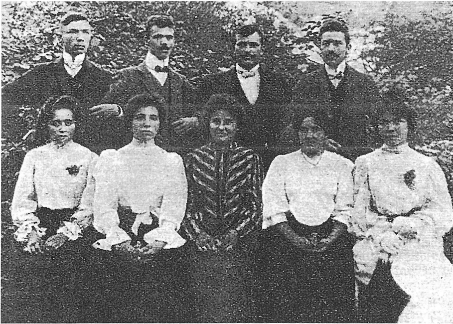
Mešani pevski zbor Rombon v Bovcu leta 1905 (iz Goriškega zbornika 1947–1957, Nova Gorica, 1957, str. 234).