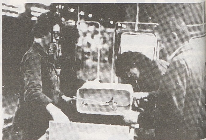
Linija za izdelavo hladilnih grup, ki jih izvažajo na Poljsko

Rezultat stalnih prizadevanj za dvig kakovosti je uspešen prodor Gorenja na najzahtevnejše svetovne trge. Danes imamo za naše proizvode več kot 500 atestnih znakov v vseh državah, kamor izvažamo, in seveda vse potrebne JUS ateste. Aktivno sodelujemo z mnogimi tujimi institucijami, pooblaščenimi za preskušanja in atestiranje proizvodov.