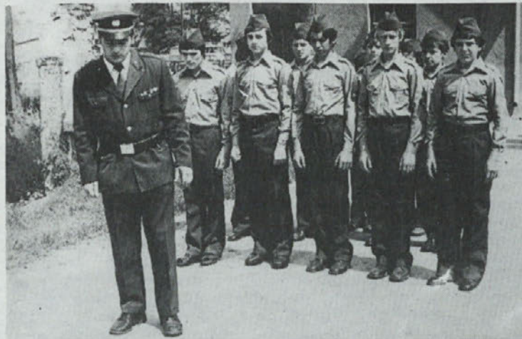
Gasilski podmladek z mentorjem