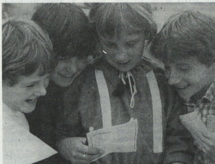
Bomo pustili, da takle smeh zamre? Zaradi nepremišljenega pohlepa po hitrejšem življenju?

Vedno bolj smo si tudi odtujeni, obremenjeni z lastnimi skrbmi. Izmiška se nam življenje, ki je bilo nekoč morda revnejše, toda prijaznejše in toplejše.