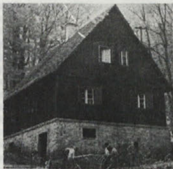
Koča »Plaz« na Debenca

– Junija – datum še ni dogovorjen – bo srečanje občanov, ki so najdlje člani naše družbe (tako imenovano srečanje starejših občanov). Srečanje bo skupaj z osnovno šolo organiziral RK Mirna.