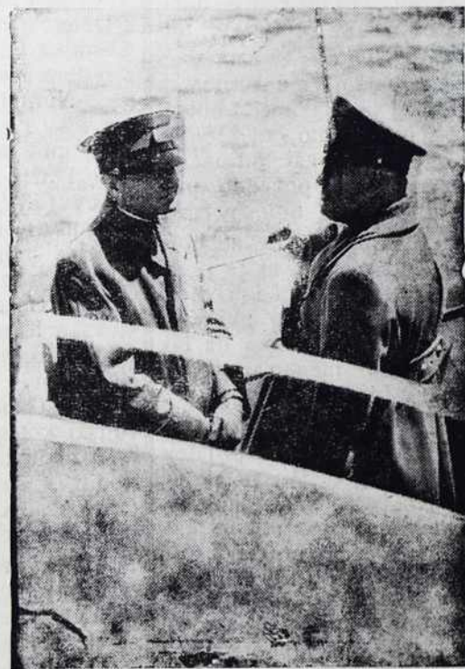
Knez namestnik Paveo i Musšolini na admiralskoj ladji „Trieste“.

Grad. Človek že ne ve, kak bi naj zadovolio dnešnju mladino. Dobra je. V nikakšem pogledi šče preveč goreča. Človek se skoro ne vüpa pokazati na cesti. Stavla te mlado i staro i pita, kda mo te zidali prosvetni dom. Ve nam pa že tak dugo obečavlete. Iz tej pitanj i nepotrplivosti se samo vidi to, kak je potreben našemi kraji dom, kde bi se naša mladina čütila kak doma. V narodi je tak močna vola, ka bi velke žrtve doprineso k tomi deli; delao bi den za dnevom kšenki, samo če bi meli telko penez, ka bi lahko plačali vse, ka trbej coj küpiti. Obračamo se s prošnjov na gospoda bana,