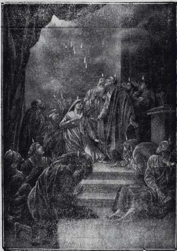
Sveti Düh Bog, razlej lübezen v naša srca.

Gda se dühovnik žrtvüje noč no den za svoje ovce, njim razdeli vse, ka ma, pa