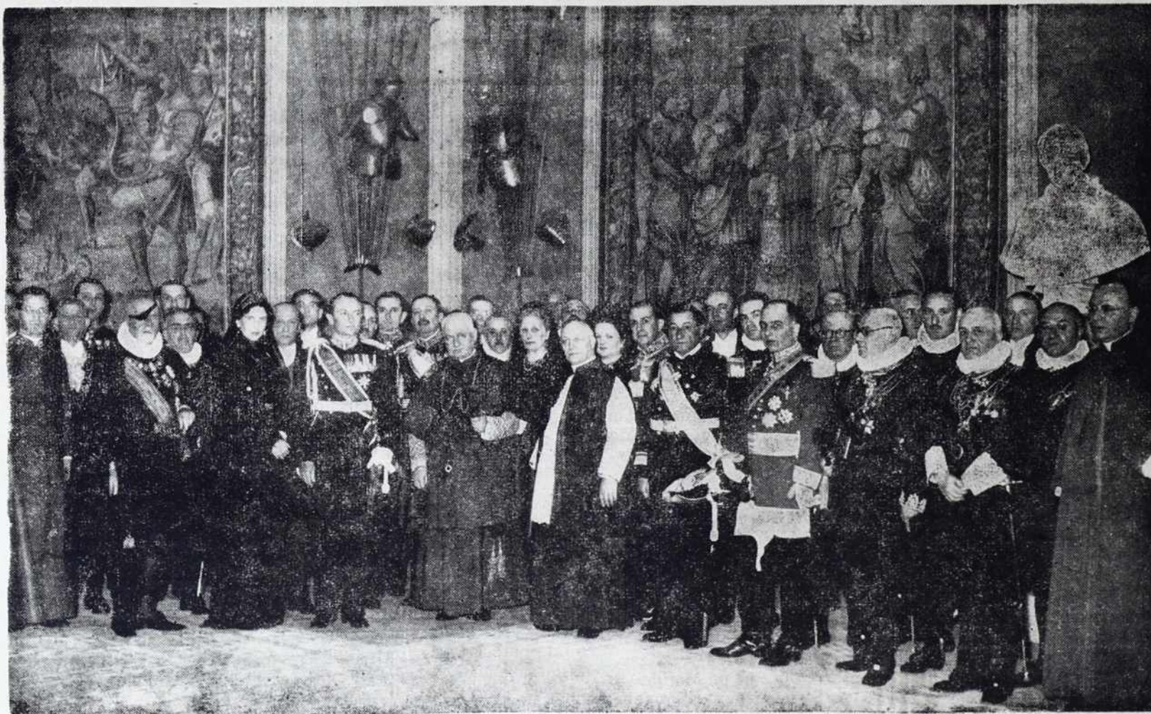
Knez namestnik Paveo i kneginja Olga s papovim državnim tajnikom kardinalom Maglionom v Vatikanu.