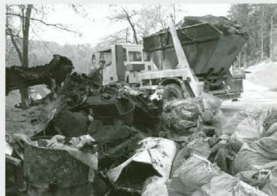
Del smeti na Gmajni pred odvozom