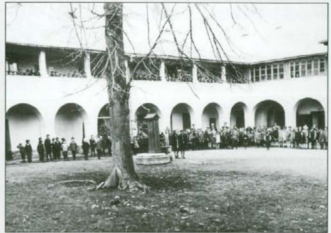
V atriju gradu Rotenturn je lepo viden vodnjak in okrog 200 let stara lipa, ki je hiralala in so jo odstranili aprila 2010 ter posadili novo. V Rotenturnu so obiskovale osnovno šolo številne generacije od leta 1901 do 1967.