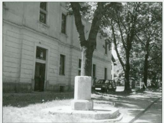
Ostank vodnjaka pred »ubožno hišo« v bližini p. c. sv. Duha (špitalska cerkev)