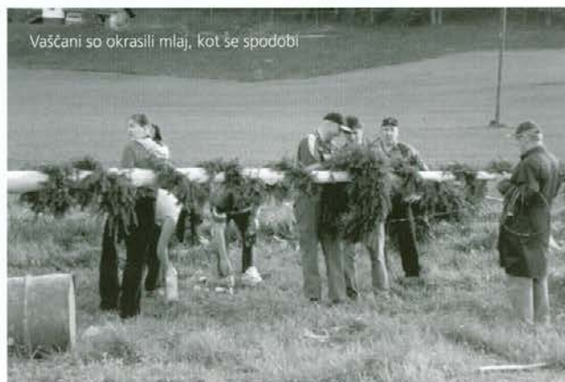
Vaščani so okrasili mlaj, kot še spodobi

mu pravijo tudi maj ali maja, kar se sklada z njegovo bajeslovno vsebino, ki poudarja bujno majsko rast in zelenje narave in s tem starodavno predstavo o kozmični materi, ki poraja življenje. Takrat so bili še časi lovcev, nabiralcev in v kasnejšem obdobju pastirjev. Kasneje je krščanstvo stara izročila preneslo na svetnike in nam jih s tem ohranilo do danes. Sam mesec maj pa je v krščanstvu