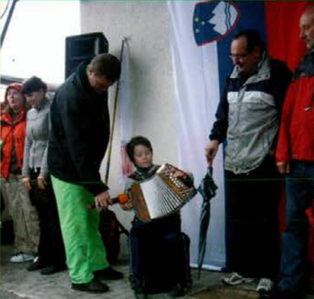
Pohodnikom je zaigral mladi frajtonar