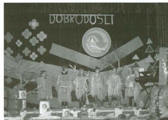
Aktualnost okoljske tematike so na humoren način predstavili učenci od 6. do 9. razreda