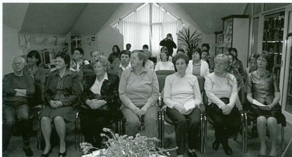
Povabljeni so z zanimanjem prisluhnili pisateljici

Povedala je, da je bilo njeno otroštvo izredno srečno in bogato z doživljaji. Oče je bil profesor književnosti in pisatelj, vanjo ji je bilo tako rekoč položeno v zibel. Vendar se je po končani maturi odločila za ekonomijo in vleklo jo je v svet, tako da si je za študij izbrala Ljubljano. Po poroki je nekaj časa z možem in hčerama preživela v tujini (Nizozemska) in ker je takrat prekinila službo, je bila nezadovoljna in čutila je, da želi iz sebe nekaj narediti in ljudem marsikaj povedati, zato je pričela pisati. Najprej dnevnik, potem pa je to pisanje raslo in raslo in pričela je izdajati romane. Njeni romani so zelo berljivi, skoraj bi lahko rekli, da so v knjižnicah zanje vrste. V čem je skrivnost uspeha? »Predvsem sem iskrena do bralcev. Opisujem resnične zgodbe, seveda jih