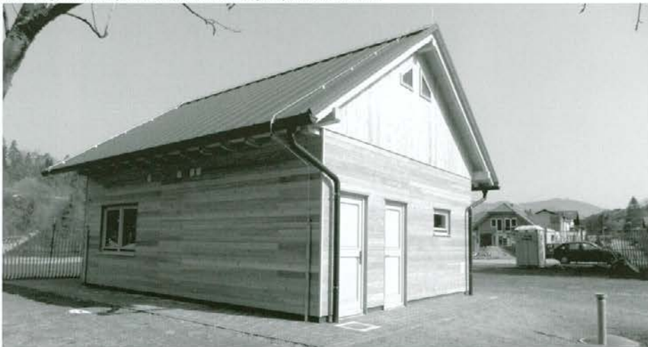
Lesen objekt, namenjen za turistično informacijsko pisarno v Vuzenici