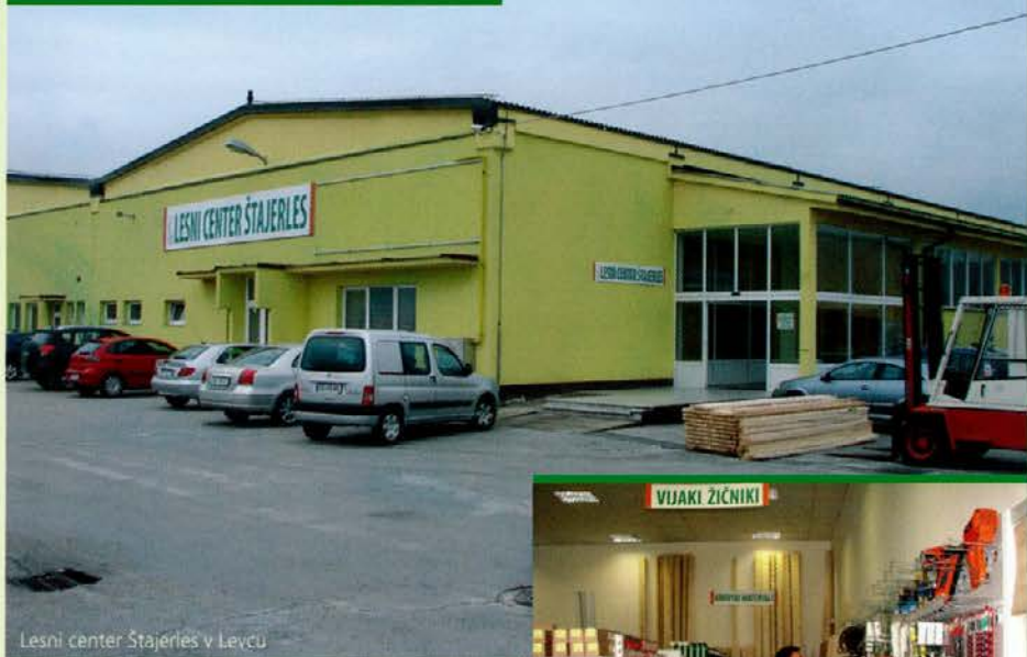
Lesni center Štajerles v Levcu

Z mesecem aprilom pa je v poslovnem centru Levec za Lesnino začel s poslovanjem tudi naš drugi lesni center. Ker je medtem ime Lesni center Štajerles pridobilo na veljavi, smo ime prenesli tudi v Levec. Kakor ptujski je tudi center v Levcu s svojo ponudbo specializiran za oskrbo vseh tistih, ki v svoji dejavnosti uporabljajo les in druge materiale, ki se