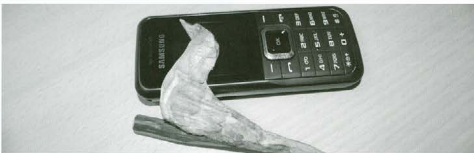
Ena izmed med malico izrezlanih figuric

Ljubo tekoče govori slovensko. Naučil se je sam. »Kdor v glavo daje in ven ne spušča, mora znati,« pravi. V Črni ima veliko prijateljev in za Slovence pravi, da so v redu ljudje. V Bosno v Gornji Vakuf hodi enkrat letno za teden dni. Razen brata in sester nikogar več ne pozna. Njegova generacija se je razselila po svetu, mnogi pa so tudi umrli med vojno. Njihova hiša je med vojno pogorela in z njo vsi dokumenti in spominki iz otroštva. V Bosni se počuti kot turist. Tudi ko se bo upokojil, bo ostal v Črni, saj se mu kraj zdi zelo lep.