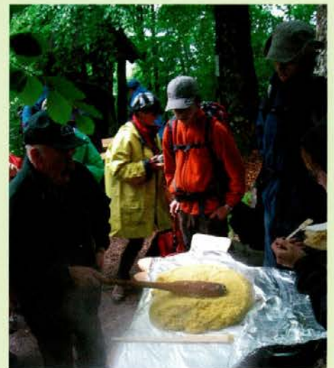
Iz polente nastane frika

Dokaz, da je srečanje uspelo je bil, da so premočeni pohodniki zapuščali zadovoljni v poznih popoldanskih urah Radlje ob Dravi, katero je evropska pešpot E 6 še bolj trdno povezala s sosednjo občino Eibiswald!