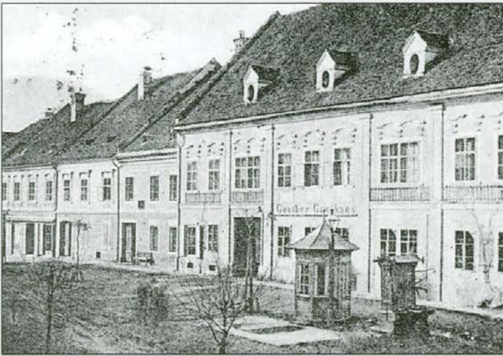
Del glavnega trga ob koncu 19. stoletja; vodnjak in mestna tehničar