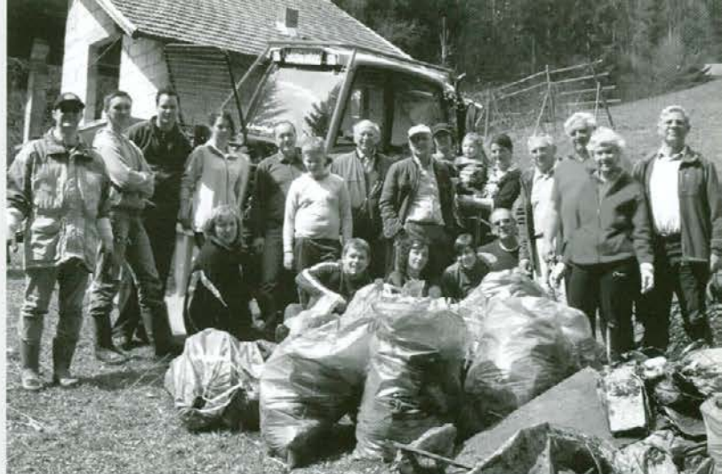
Del udeležencev med smetmi na Gmajni

V imenu Turističnega društva Slovenj Gradec in v svojem imenu se zahvaljujem vsem, ki ste kakorkoli prispevali k uspešni izvedbi projekta. Ponovno smo pokazali, da se s skupnimi močmi, voljo in jasnim ciljem da narediti velike stvari.