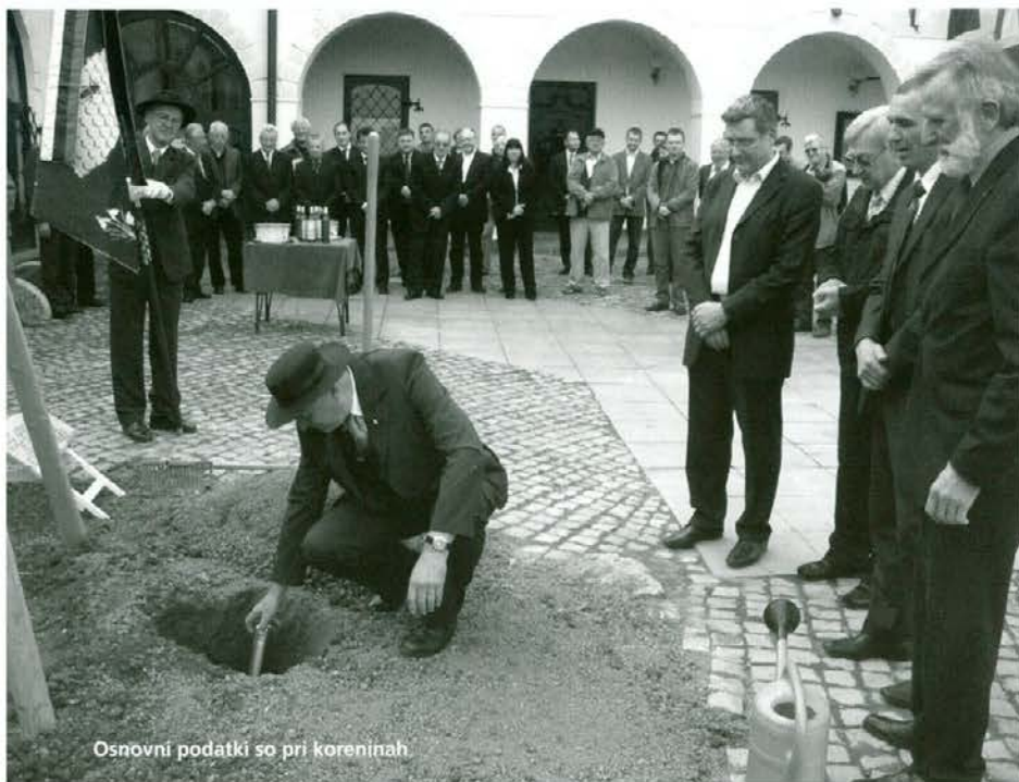
Osnovni podatki so pri koreninah