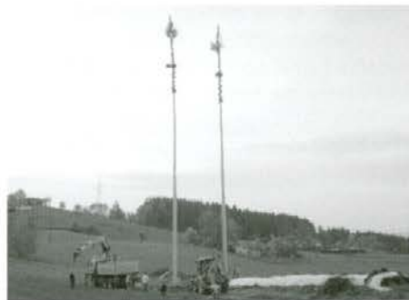
Postavljanje mlaja v Zgornji vasi v Podgorju

Danes mlaj pomeni olupljeno smreko z zelenim in lepo okrašenim vrhom ter vencem pod njim. Ponekod na Slovenskem