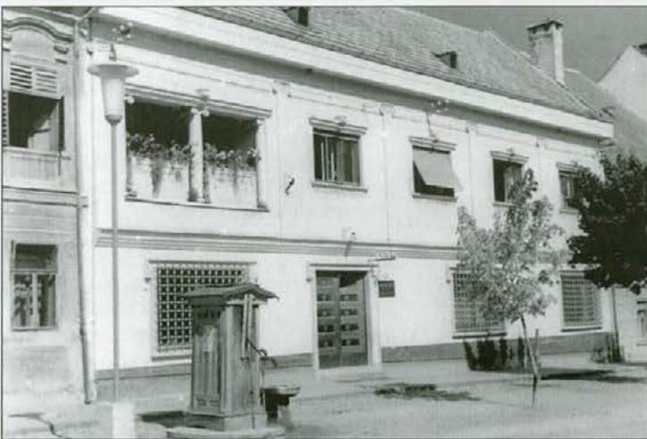
Sredi 20. stoletja je pred banko še ohranjena ljudska kultura