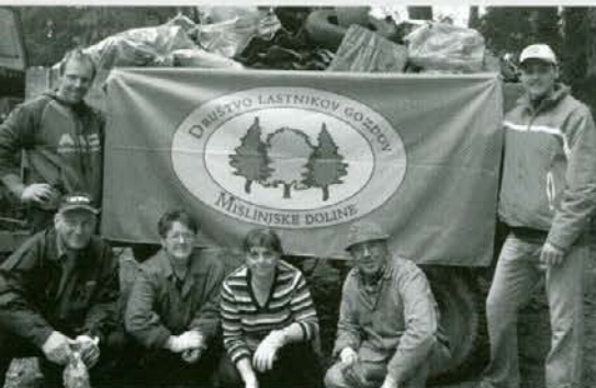
Samo lučaj od cerkve v Dovžah smo v dobri uri napolnili zvrhano traktorsko prikolico odpadkov

Člani društva Lastnikov gozdov Mislinjske doline smo se še posebej razveselili vseslovenske čistilne akcije. Znano je, da je na našem področju največ divjih odlagališč ravno v naših gozdovih. Gozdni posestniki smo