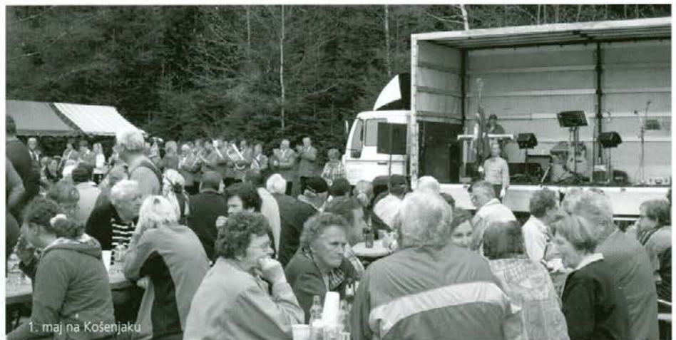
1. maj na Košenjaku