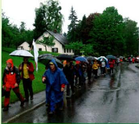
Pričetek pohoda v Eibiswaldu (Ivniku)