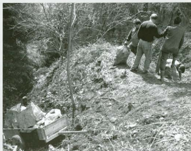
Izvoz smeti iz gozda