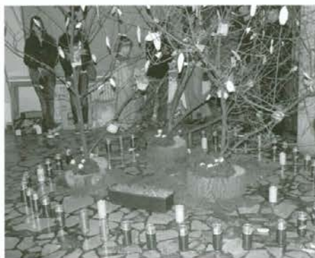
Del improviziranega gozda, ki je nastajal v sodelovanju španskega umetnika in učencev