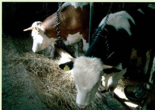
Govedo v hlevu

rože. Eden izmed konjičkov ji je tudi zeliščarstvo, sama nabira po travnikih zelišča, nekaj pa jih ima na vrtu. Iz zelišč dela mešanice čajev in mazila. Ker je po naravi zelo energična, je eno leto tudi plesala pri folklorni skupni Dravca iz Dravogarda, pa ji je zanjo zmanjkalo časa. Zaželela sem ji še naprej toliko energije in zdravja ter da ji volje nikoli ne bi zmanjkalo.