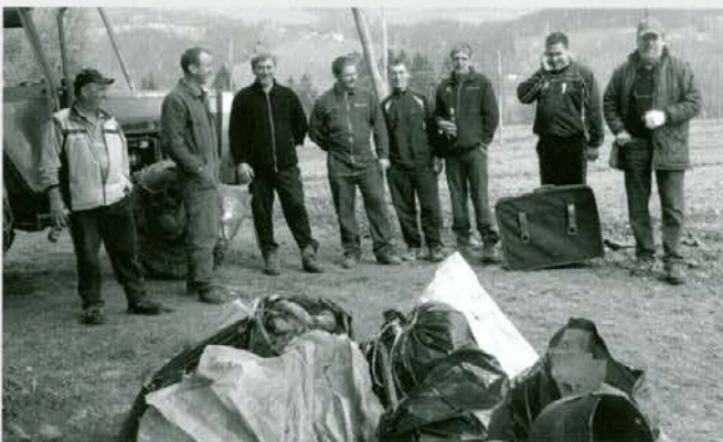
Gozdarji Zavoda za gozdove OE Slovenj Gradec med čistilno akcijo