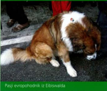
Pasji evropohodnik iz Eibiswalda