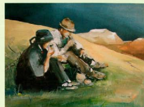
Leander Fužir – še ena iz cikla Vorančevih motivov