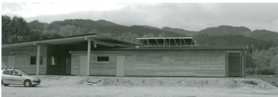
Objekti rekreacijskega centra ob Dravi v Radljah

Za nadaljnji razvoj v turizmu Koroške regije bodo v vsaki občini postavljeni turistično informativni centri oz. pisarne za sprejem gostov in turistov v občinah in za sprejem gostov za splavarjenje po reki Dravi, ki je postalo tradicionalno. Koroška je dežela gozdov in temu primerno je bil zastavljen koncept izgradnje turistično informacijskih pisarn. Objekti so lesena gradnja, okolju prijazni, kar je pomembno tudi za nadaljnjo promocijo z leseno gradnjo.