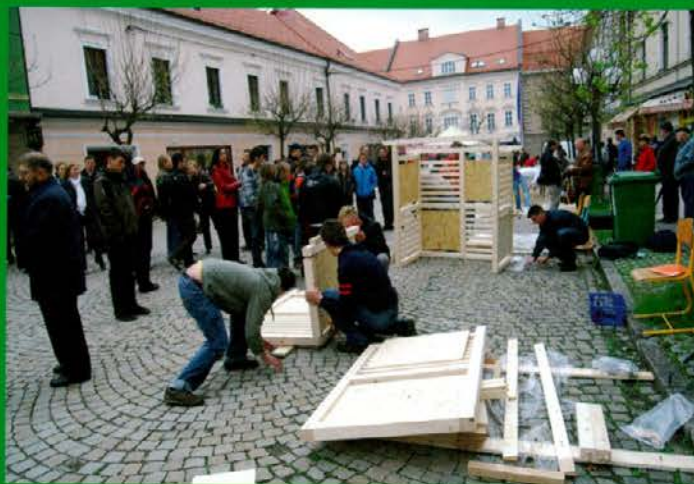
V hitrosti montaže nadstreškov za smetnjake so se dijaki pomerili v centru mesta Slovenj Gradec