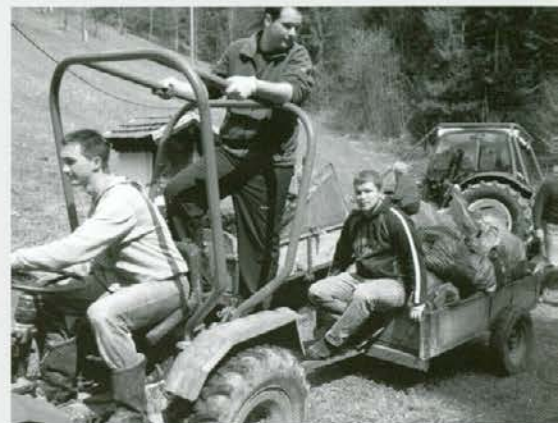
Brez tehnike ne gre