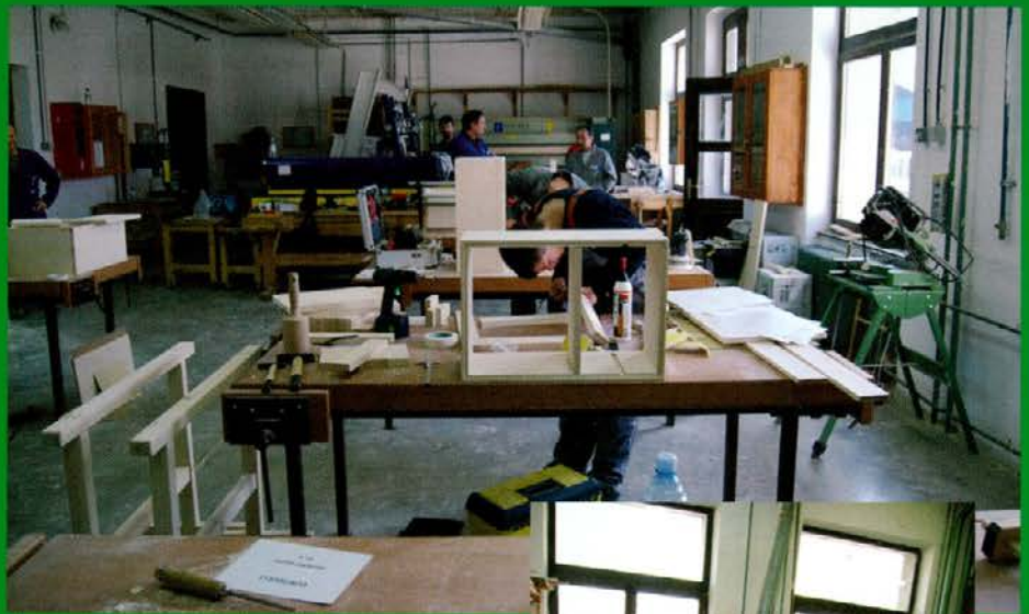
Tekmovanje v ročni obdelavi lesa je potekalo v učnih delavnicah Srednje lesarske šole v Slovenj Gradcu

Pred pričetkom tekmovanj so se vse ekipe zbrale pred športno dvorano Slovenj Gradec