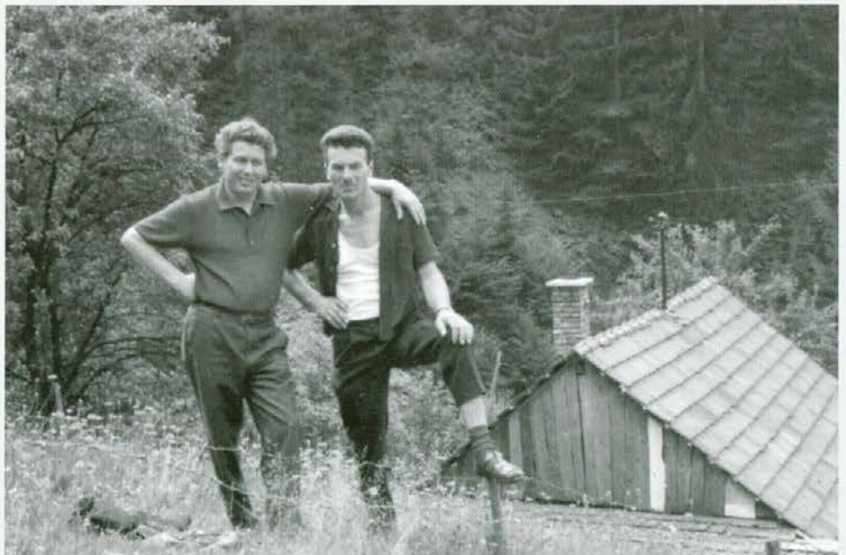
Tukaj, nad njegovim domom, sva nekoč lovila kokoš