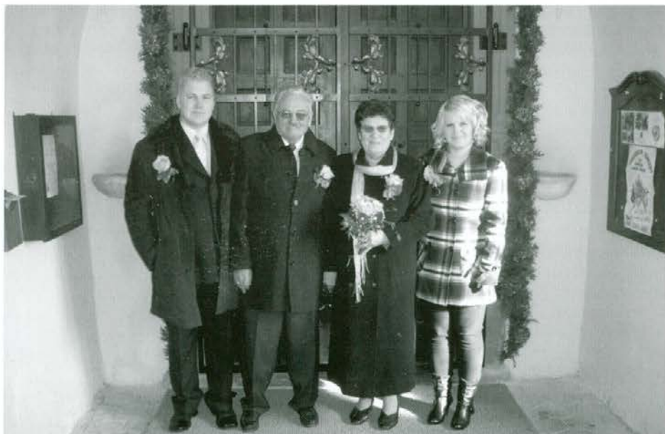
Zlatoporočena s pričama

Vse najboljše in še na mnoga leta zdravja in sreče!