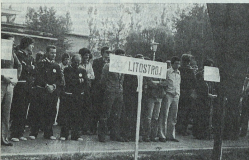
Slovesnost ob začetku letnih iger ZPS

Na igrišču Izobraževalnega centra je v teku dramatičen boj za gole, brez rumenih in rdečih kartonov, čeprav... Vratarji mekdo, da postavi nogo in že je »žoga v zraku in zrak v žogi«.