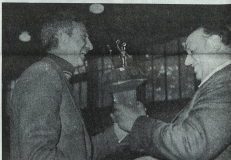
Pa smo ga spet osvojili