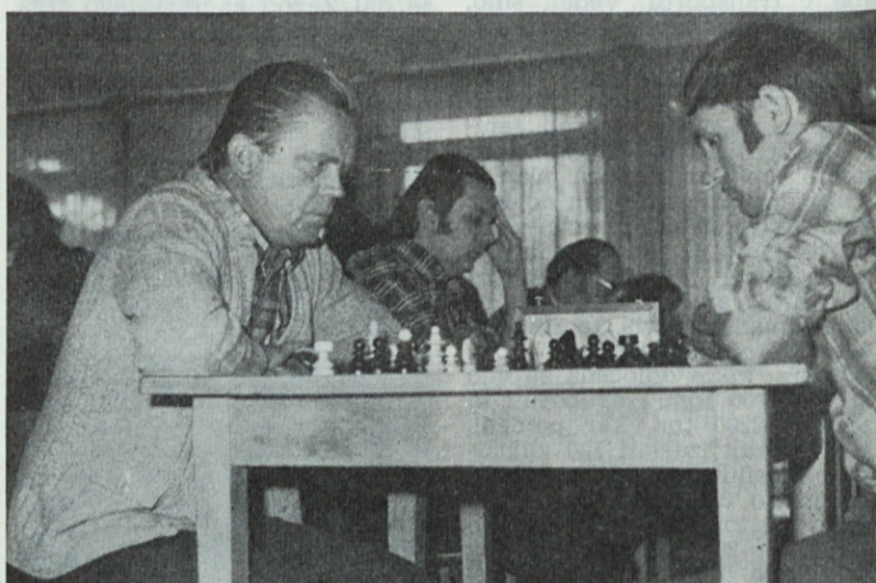
Sah — sami problemi in kombinacije