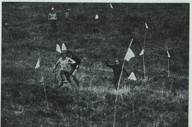
Po suhem med vratci