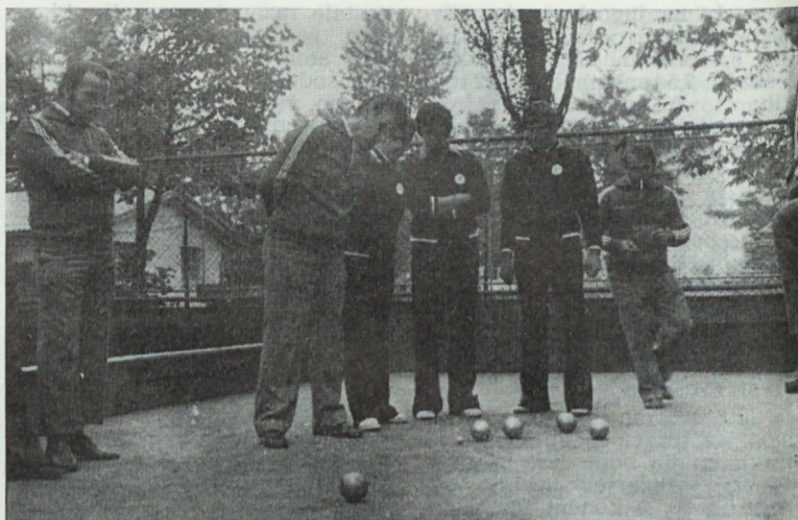
Balinarje — nikoli ne veš, kdaj bo končano