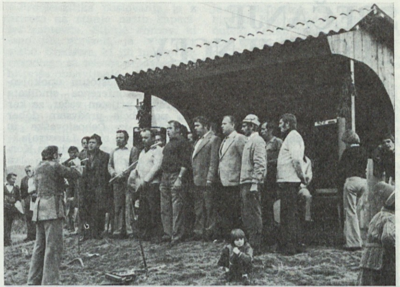
Tudi pevci so sodelovali

Dan se je nagibal v večer, ko so se vrhovi gora spet odeli v meglo in je neprijetno potegnulo skozi smreke. Ko so prve kaplje oznanile kasnejši naliv, so avtobusi že rezali ovinke proti So-