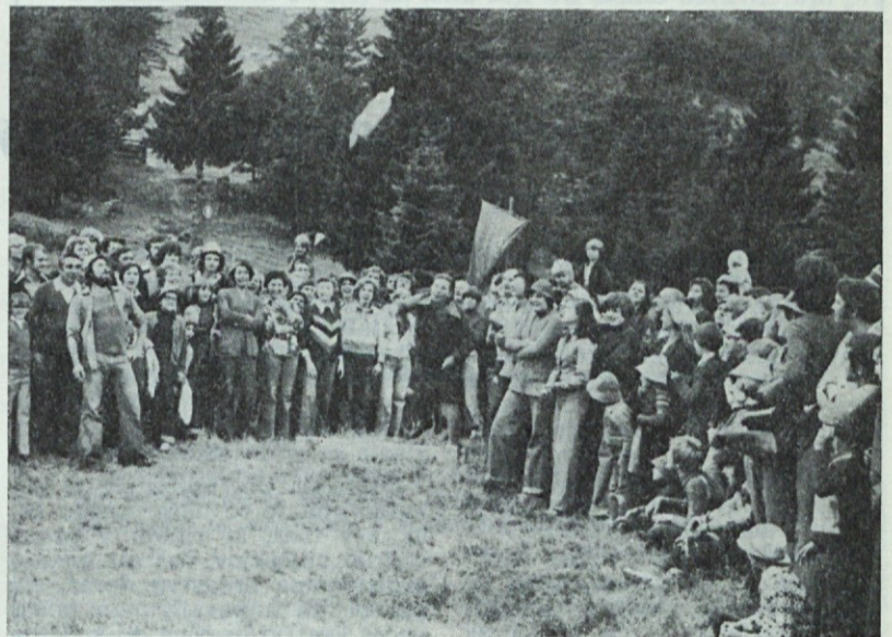
Nekaj visi v zraku