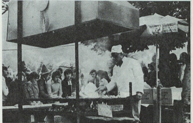
Specialitete na žaru

rici. Planina je na mah ostala skoraj prazna, le vrli planinci so se trudili, da jo spravijo spet v red.