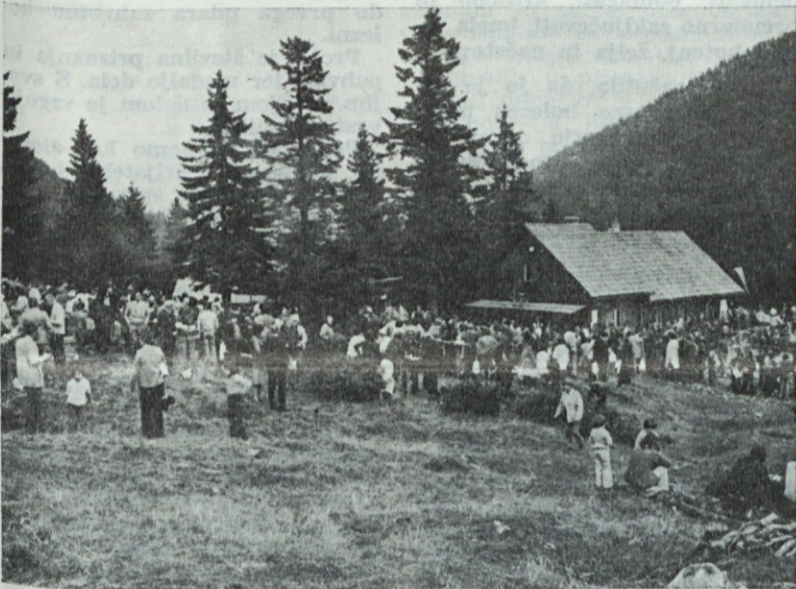
IV. srečanje na planini

Zato — na svidenje, Litostrojecani, na planino prihodnje leto! ETO