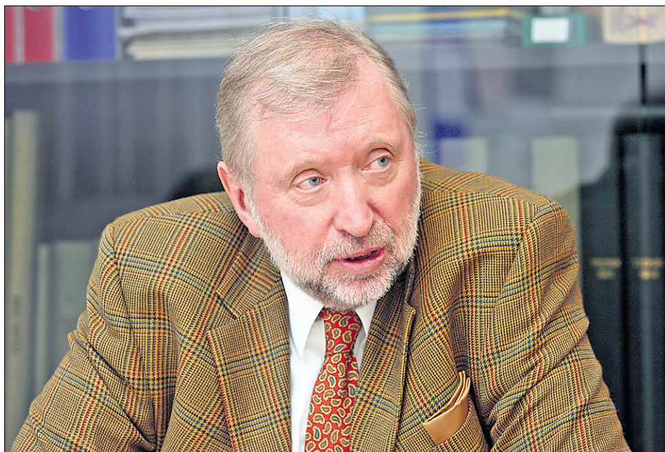
Dr. Dimitrij Rupel: »V času predsednikovanja EU bo Slovenija imela v rokah niti svetovnih mednarodnih odnosov.«

predsednikovanja EU bo Slovenija imela v svojih rokah niti svetovnih mednarodnih odnosov. Organizirati bomo morali celo vrsto sestankov med EU in drugimi velikimi playerji v svetu, Rusije, ZDA, Latinske Amerike, azijskih držav, Kitajske. Slovenija bo prevzela vodstvo EU v celoti, kar je velika odgovornost, veliko tveganje in hkrati velik izziv. Mislim pa, da se bomo dobro pripravili. Navsezadnje smo imeli eno »vajo« že, Slovenija je eno leto vodila OVS, za opravljeno delo smo prejeli same pohvale.«