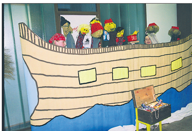
Z igrico Gusarji s čistimi zobmi so navdušili osnovnošolci iz Podlehnik.

let uspešnega dela preventivne zobozdravstvene dejavnosti, ki bo lahko tudi v bodoče uspešna le, če bodo še naprej povezano delovali z vzgojitelji, učitelji in starši. Ptujška zobozdravstvena preventiva se lahko pohvali z zglednim sodelovanjem s šolami na Ptujskem. Lutkovna predstava Gusarji s čistimi zobmi iz Podlehnik pa je še korak novega približevanja, sodeč po izkušnjah lahko največ za ustno zdravje, kot zelo pomemben del splošnega zdravja, naredimo skupaj, zobozdravstvo,