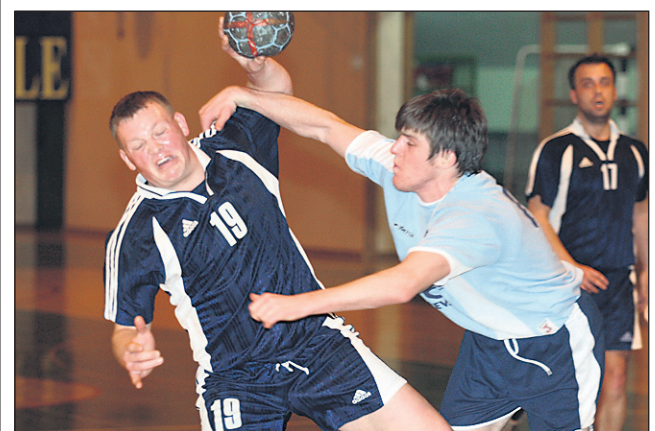
Maloštevilni rokometarji Drave (temni dres) so zdržali le en polčas.