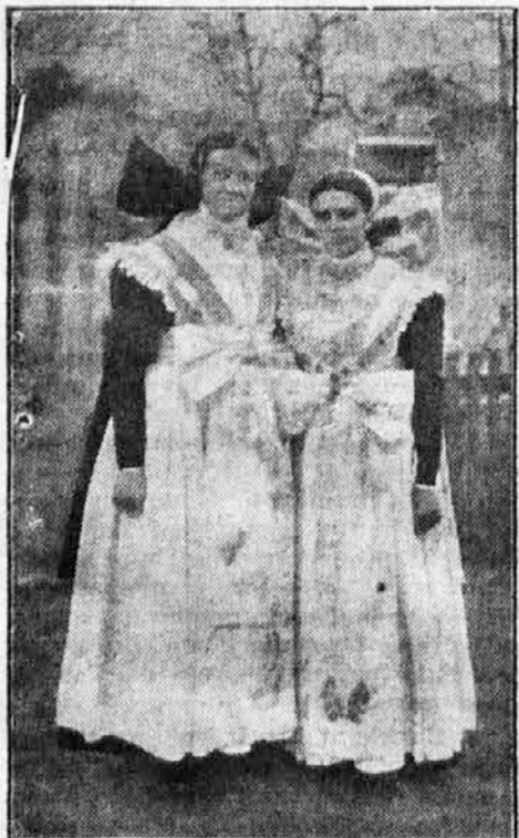
Narodna nošnja u katoličkoj Lužici.

Rožant (nem. Rosenthal) najznamenitije je hodočašće katoličkih Lužičkih Srba. U stanovitim godišnjim dobama hodočašći ovamo na hiljade i hiljade