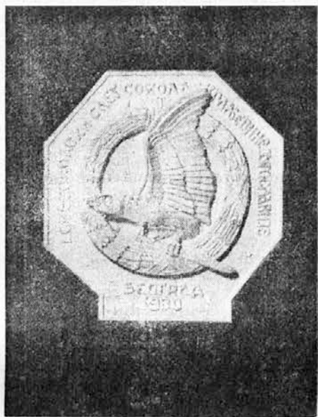
ČLANSKA SLETSKA ZNAČKA.

Značku je izradio arhitekta brat Gligorije Samojlov, Beograd. Od mnogih prispelih radova, žiri je prihvatio ovu značku i dodelio joj prvu nagradu.