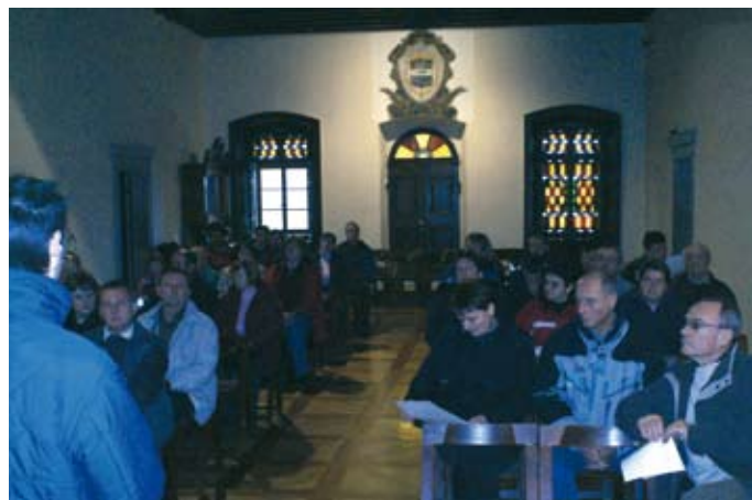
vse o ponudbi gradu

Kot je znano, so letošnji prikaz martinovanja in vinskih običajev za Martinov večer v Moravčah prikazali gostje iz Goriških Brd. Takrat so si tudi ogledali naš sejem, ki ga je pripravila Občina v sodelovanju z društvi. Ker imajo v turizmu bogato tradicijo, so se odločili, da vrnejo povabilo. Poleg čudovite narave, ki je sicer značilna tudi za naše področje, so nam prikazali več zanimivih turističnih objek-