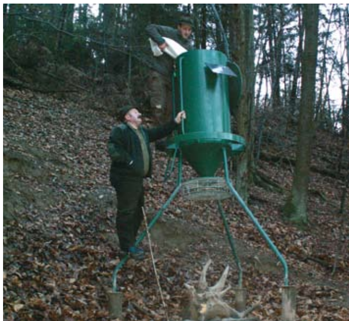
Zalaganje krmilnice Herkules.

Življenjski prostor divjadi se neprestano krči zaradi urbanizacije. Močan je tudi pritisk obiskovalcev narave, ki mnogokrat z nepotrebnim hrupom motijo mir, da o agresivnih motoristih, ki prihrumijo že na vrh vsakega hriba, niti ne govorimo. Vendar pa vsa divjad ne reagira enako. Prilagodljive vrste (srnjad, divji prašič, lisica) se navadijo na spremembe v okolju, druge pa kažejo na padanje staleža ali celo popolnega izginotja iz lovišča. Še nekaj desetletij nazaj smo imeli na Moravškem divjega petelina, jereba, fazana. To je žal zgodovina. Neizpodbitno dejstvo pa je, da