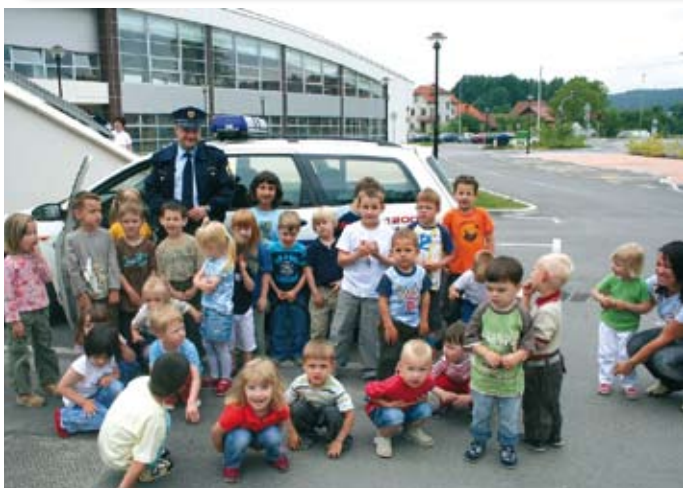
Policistiv okviru preventivnega dela predstavljajo svoje aktivnosti tudi najmlajšim.

Na koncu bi rad dodal še nekaj besed o otrocih. Vsi vemo, da se otroci učijo od odraslih, vendar se starši vse premalokrat tega zavedamo. Velikokrat se zgodi, da učitelji ali policisti pokličejo starše in jim povejo, da je njihov otrok v šoli ali na ulici metal petarde, starši pa se temu neznanosko čudimo in zatrjujemo, da naš otrok tega ni sposoben storiti, da ga mi vzgajamo pravilno in da svojega otroka poznamo, da če je že to storil, je bil