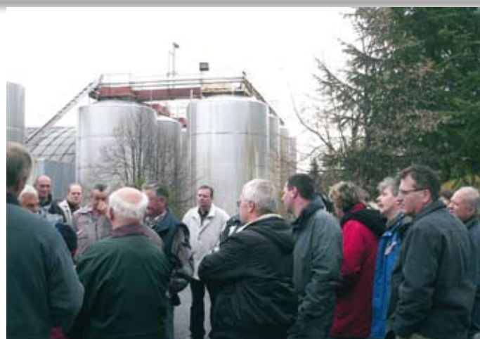
predavanje o vinski ponudbi

tov. Njihova prva dejavnost je vinarstvo, obenem pa znajo ponuditi ogromno drugih zanimivosti, od vasi, kjer predstavljajo vaško življenje v preteklosti, gradu, galerij, doma kulture, razgledne točke, cerkve, do seveda bogate gostinske ponudbe. Kakor so poudarili, je potrebna visoka