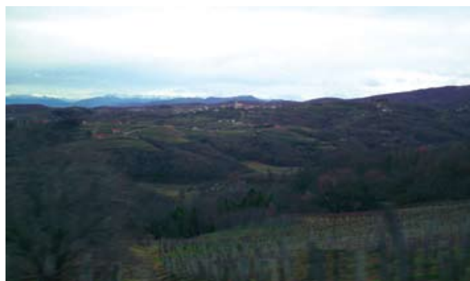
pogled na Goriška Brda

Občina Moravče je za dobro sodelovanje povabila na ekskurzijo v Goriška Brda svetnike v Občinskem svetu Moravče, predstavnike društev in Uredniški odbor Novic iz Moravske doline.