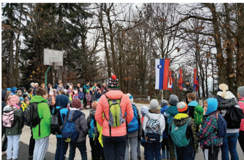
Tradicionalna spominska slovesnost vrh Golišč nad Jevnico