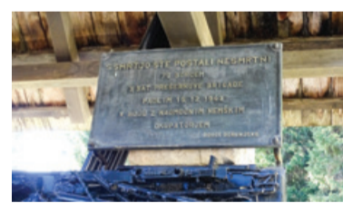
Spomenik na Pokljuki

15. decembra 1943 so nemške sile na Goreljku na Pokljuki obkolile 3. bataljon Prešernove brigade. V hudem boju je padlo 79 partizanov.