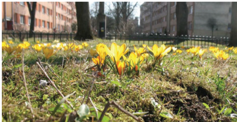
Projekt Krokus ima velik simbolni pomen.

Projekt Krokus je nastal na Irskem na pobudo združenja HETI (Holocaust Education Ireland). Združenje mladim in šolarjem, starim deset let in več, podarja čebulice rumenih krocusov (žafrana), da jih posadijo v spomin na 1,5 milijona judovskih otrok, ki so umrli v holokavstu, in v spomin na tisoče drugih otrok, ki so bili žrtve nacističnih grozodejstev. Rumene cvetovi spominjajo na rumene Davidove zvezde, ki so jih bili Judje prisiljeni nositi v času nacistične vladavine. Krokus cveti proti koncu januarja, približno v času mednarodnega dneva spomina na žrtve holokavsta (27. januar). Ko ljudje občudujejo rože,