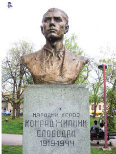
Kip Konrada Žilnika v Nišu.

Bil je zraven pri ustanovitvi Topliškega in Ozrenskega partizanskega odreda, v katerem je bil nekaj časa namestnik komandanta in