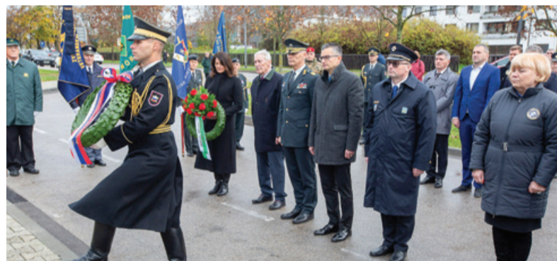
Polaganje venca v Vojkovi ulici v Ljubljani

Slovesnost, ki jo pred spomenikom pred stavbo ministrstva za obrambo pripravljamo že tradicionalno, je le ena od oblik počastitve spomina na generala Maistra v obrambnem resorju. Po generalu Rudolfu Maistru je poimenovana