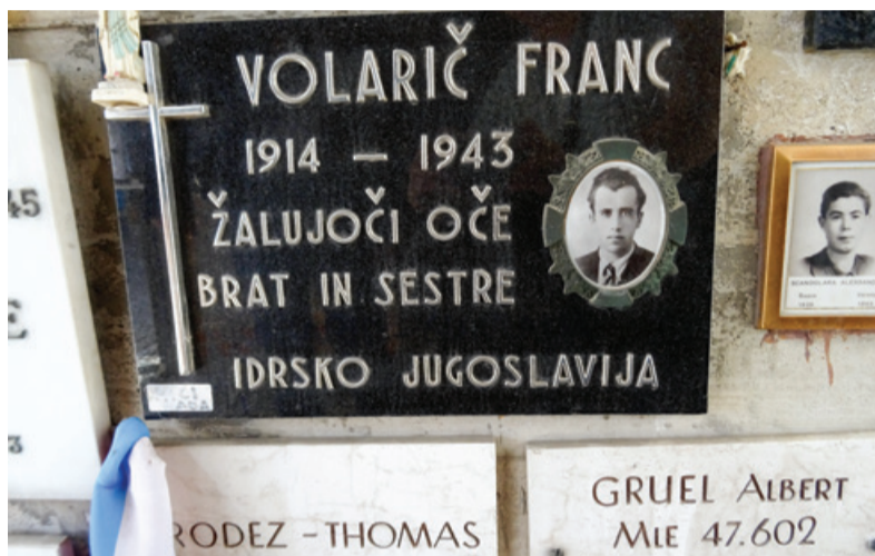
Spominska plošča slovenskemu taboriščniku v Gusnu, nekdanji podružnici koncentracijskega taborišča Mauthausen

žal Slovenci še nimamo. CIM bo v prihodnosti tudi prijavil mednarodni projekt Via Memoria Mauthausen, s čimer bodo predstavljene poti taboriščnikov v koncentracijsko taborišče Mauthausen in njegove podružnice. V ta namen so člani odbora dobili tudi gradivo za pripravo projekta v okviru razpisa Cultural Routes pri Svetu Evrope. To je nadnacionalno množično omrežje, ki deluje kot kanal za medkulturni dialog in spodbuja boljše poznavanje in razumevanje skupne evropske