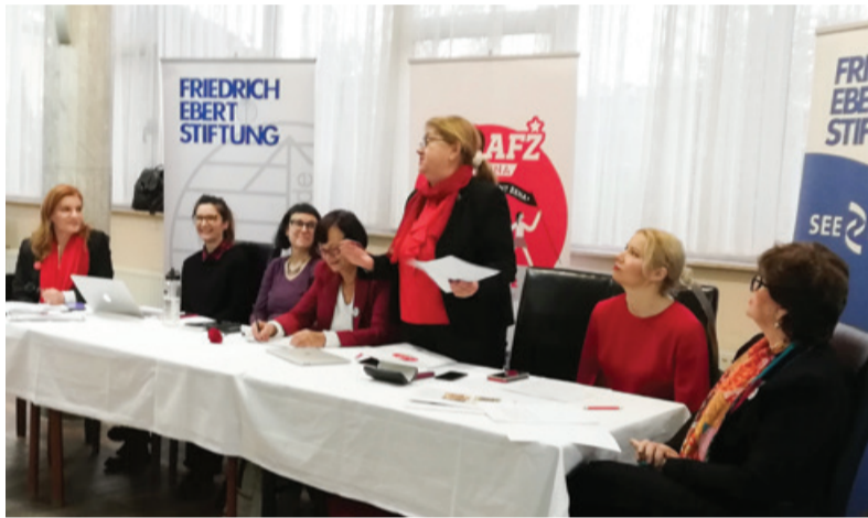
Ženska konferenca je potekala v Bihaću, tudi z udeležbo slovenskih predstavnic.

Na končnem plenarnem zasedanju je bilo sprejeto vse, kar so