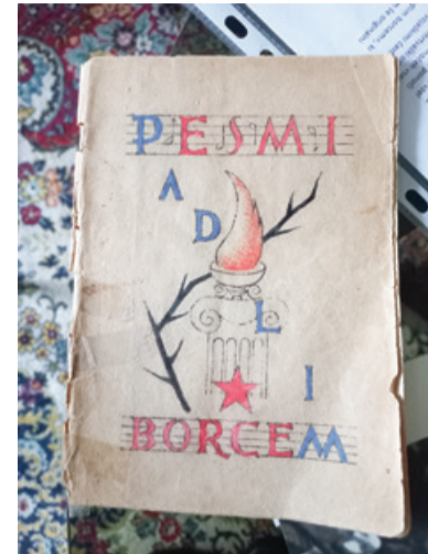
Pesmi padlim borcem iz 12. decembra 1944

pomočjo je tašča našla svojega pokojnega sina, ki so ga nato prekopal v Ljubljano.