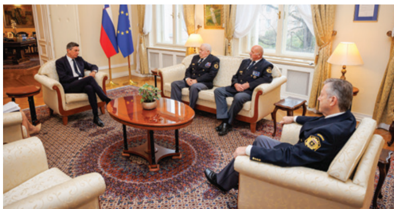
Delegacija Severja na obisku pri predsedniku Borutu Pahorju

Predsednik Pahor je delegacijo sprejel ob 33. obletnici akcije Sever, ko so leta 1989 takratni organi za notranje zadeve z odločno akcijo zaščitili demokratične procese v