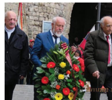
Polaganje skupnega venca na spominski slovesnosti v Jajcu

»Člani borčevskih in protifašističnih organizacij na območju nekdanje Jugoslavije se moramo danes