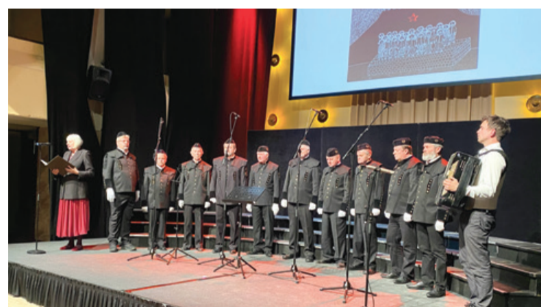
Rudarski pevski zbor Loški glas iz Zagorja ob Savi

V Festivalni dvorani v Ljubljani je bila 26. novembra 14. prireditev Praznik partizanske pesmi. Njen namen je ohranitev dediščine enega od pomembnih delov naše pevske kulture, za katerega zdaj sistemsko v Sloveniji nihče ne skrbi, da bi se ohranil, in je tako postal bela lisa na narodovem pevskem zemljevidu.