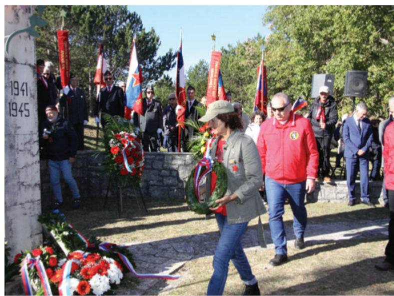
Polaganje vencev v Kučibregu

V tem delu Istre so delovale skupine VOS-a, 3. bataljon Istrskega odreda. Ta bataljon je imel četo italijanskih borcev. Njihov komandant