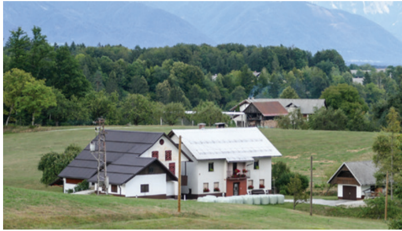
Potočnikova kmetija v Rovtah danes

V leseni baraki na Malem vrhu pod Jamnikom (821 m. n. m), tudi zanjo