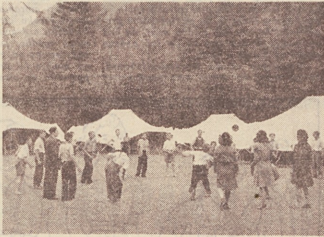
Pionirji so si postavili šotore

Zato bodo pionirji koristno uporabili vsak nasvet partizanov. Obenem pa se bodo seznanili tudi z junaško zgodovino, ki so jo prehodili stotisoči v času narodnoosvobodilne borbe. Zato bodo tudi vsi taborni vodje skrbeli, da bo delo in vsebina življenja na taborjenjih organizirana in izvajana v tem smislu. Ker se bodo taborjenja vršila v juliju, v katerem bo tudi praznik vseljenske vstaje — 22. julij, bodo ta praznik praznovali na taborjenjih na najdostojnejši način, z bogato pripravljanim programom. C.