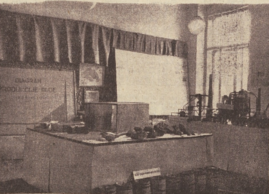
Del razstave, ki prikazuje proizvodnjo naših rudnikov

Delovni kolektiv »Istre« ima vse pogoje, da si bo tudi še tretji pridobil prehodno zastavo in izpolnil obveznosti, ki jih je sprejel.