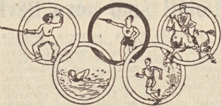
Moderni olimpijski peterboj obsega sabljanje, plavanje, streljanje, cross-country in jahanje

Zadeva pa ni tako enostavna, kajti zahteva so precej visoke. Kakor že rečeno, je prva točka modernega peterboja sabljanje. Precej tež je seveda igrati v športnem sabljanju, da lahko tekmuješ na olimpijskih igrah, kjer se sestajajo le najboljši na svetu! Tudi za drugo točko ni dovolj, da si kolikor toliko izurjen plavalec: treba je hitro plavati na 300 m! Tretja točka je streljanje s pištolo, četrta pa cross-country, kar