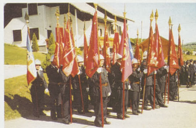
Zbor gasilcev pred svečano parado