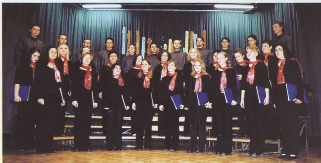
Mešani zbor PZ Strune