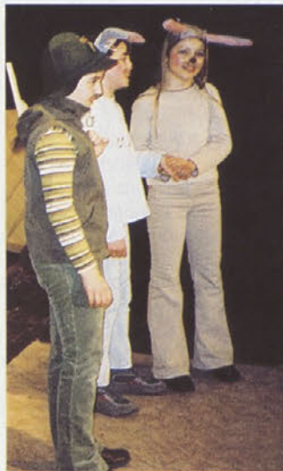
Dramska sekcija mirnske OŠ.