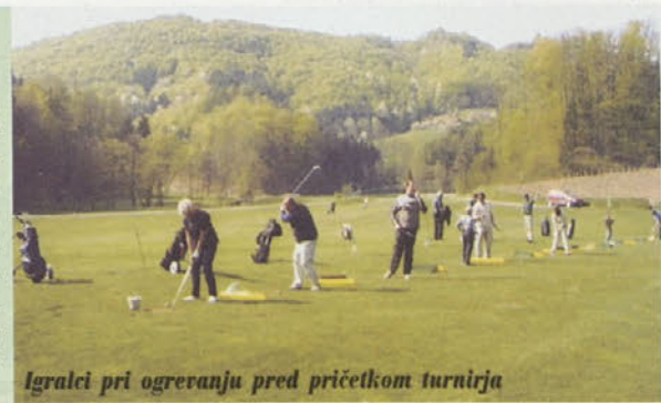
Igralci pri ogrevanju pred pričetkom turnirja