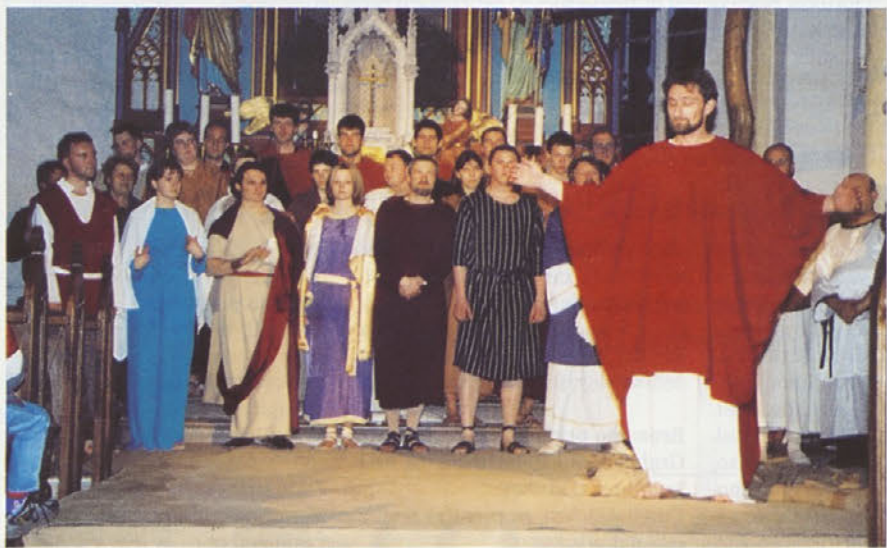
KUD Klas Mirna

Na območno srečanje gledaliških skupin se je uvrstila gledališka sku-