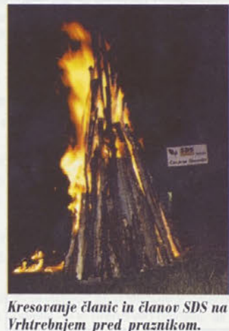
Kresovanje članic in članov SDS na Vrhtrebnjem pred praznikom.

Pričakovali smo večji odziv ostalih društev in občanov, saj smo za čisto okolje vsi odgovorni. Občinski odbor SDS Trebnje