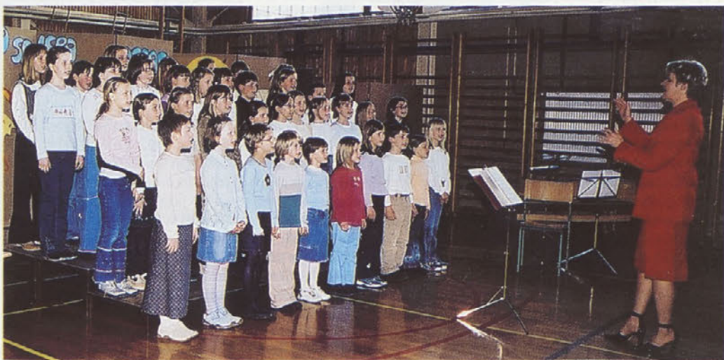
Pevski zbor OŠ Trebnje