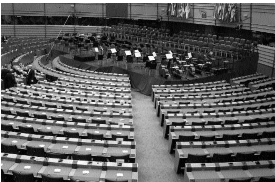
notranjost Evropskega parlamenta med pripravami na koncert (na sliki parlamentarne sluge)