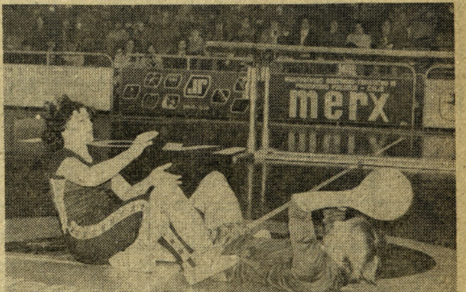
Podajanje žoge v paru je prijetna vaja, ki zahteva precej spretnosti