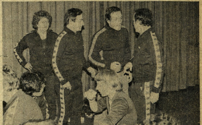
Posvet in razlaga pravil med odmorom