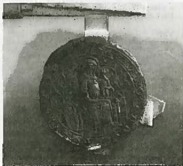
Pečat z motivom Matere božje z Jezučkom v naročju na listini opata in konventa v Stični iz leta 1351. Arhiv Republike Slovenije, Zbirka listin, Rep. II, št. 18

Der Beitrag behandelt die Entwicklung der Aktengeschäftsführung seit 1955 bis zur Veröffentlichung der Geschäftsordnung über die Kanzleigeschäftsführung vom Jahre 1988. Es werden genauer die Anweisungen für die Ordnung der Kanzleigeschäftsführung bis zur Verordnung über Kanzleigeschäftsführung von 1957 beschrieben, auch die vorläufige Anweisungen für die Kanzleigeschäftsführung von 1961, als Kartiregister eingeführt wurde, und die Geschäftsordnung über die Kanzleigeschäftsführung von 1988, die noch immer in Kraft ist.