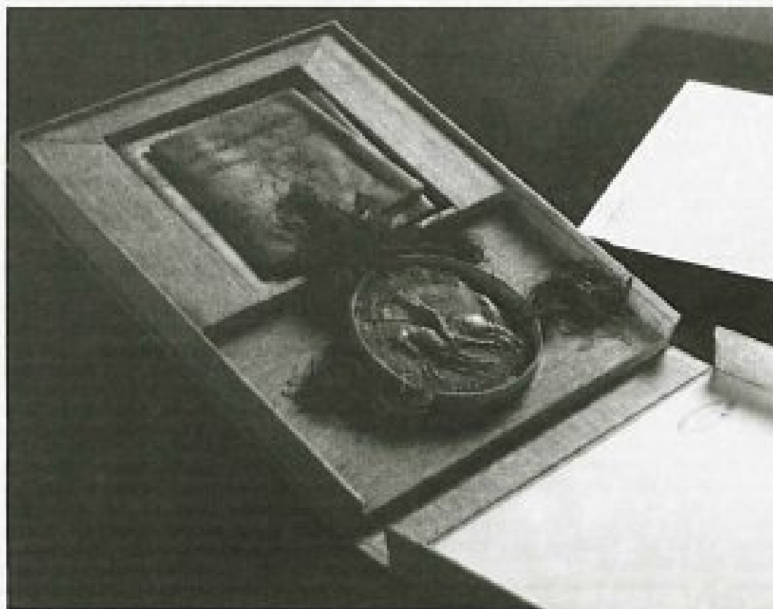
Primer hranjenja listine s pečatom

Eine der Grundweisen und vielleicht auch der billigsten für den Schutz der geschriebenen, gedruckten und gezeichneten Mitteilung ist die Auswahl des entsprechendsten Papiers als haltbaren Niederschriftsträgers. Die Qualitätsbewertung der Schreib- und Druckpapiere hinsichtlich der Dauerhaltbarkeit ist auch weltweit noch in der Entwicklungsphase. Es bestehen einzelne Empfehlungen die in der nächsten Zukunft sowohl von den Papierverwendern als auch Papiererzeugern und -bearbeitern werden definiert werden müssen. Und denen muß man sich so bald wie möglich anschließen.