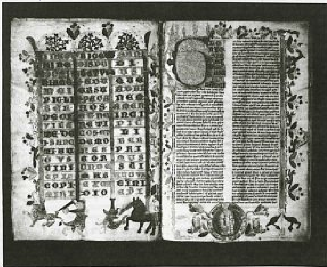
Bistrski rokopis, Liber de Civitate Dei sancti Augustini episcopi, 1347. NUK, Ms 2, fol. 2' in 3