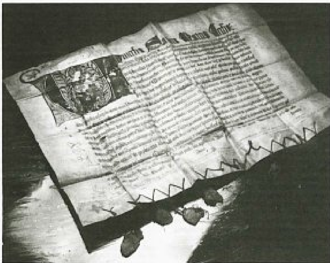
Listina štirinajstih tituliranih škofov, ki podeljujejo odpustke obiskovalcem samostana sv. Marije pri Kostanjevici, izdana v Avignonu leta 1347.

Die Problematik des Aufbewahrens und der Bearbeitung des Wirtschaftsregistraturgutes ist im großen Maße in der heutigen slowenischen Archivistik anwesend, weil die- artigem Registraturgut bei der Bearbeitung nicht genug Aufmerksamkeit gewidmet wird, so daß dieses Registraturgut meistens un bearbeitet in den Archivmagazinen liegt und für die Forschung leider nicht zugänglich ist.