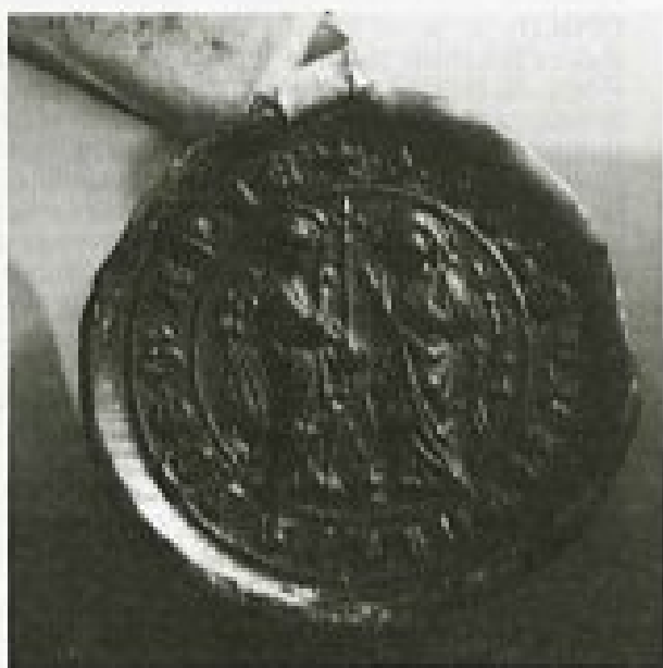
Pečat z motivom Marijinega oznanenja samostana v Velesovem na listini iz leta 1381.

Arhiv Republike Slovenije, Zbirka listin, Samostanske listine - Velesovo, št. 592