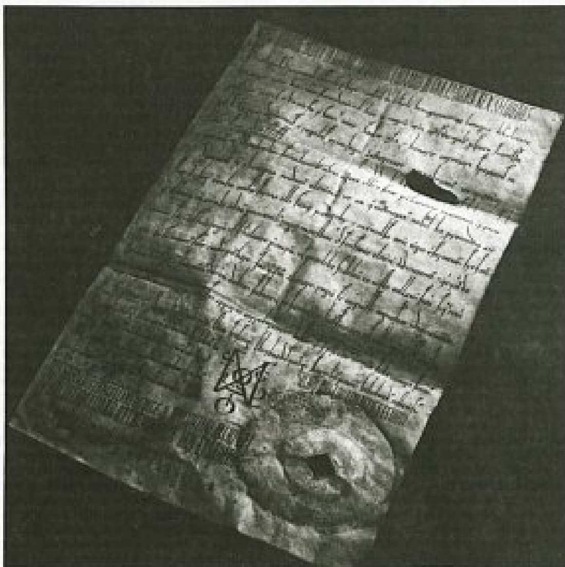
Listina rimskega kralja Konrada II., ki potrjuje ustanovitev benediktinskega samostana v Gomjem gradu in vtisnjen odpadli pečat, izdana v Regensburgu leta 1147. Nadškofijski arhiv Ljubljana, Zbirka listin, Gomji grad

In seinem Beitrag beschreibt der Autor die Charakteristika des Gerichts der slowenischen Nationallehre als einer Institution und macht auf die Grundkategorien des Archivguts, das bei der Geschäftsführung der einzelnen Senate dieses Gerichts entstand, aufmerksam.