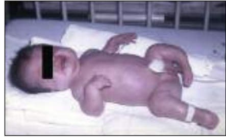
Slika 8. Otrok s hondrodistrofijo. Vidne so kratke okončine in makrokranija.

Kostne displazije so klinično in genetsko heterogena skupina, za katero je značilna neproporcionalno znižana rast. Najpogostejša je ahondroplazija, ki je posledica mutacije gena, ki določa receptor 3 fibroblastnega rastnega dejavnika (angl. fibroblast growth fac-