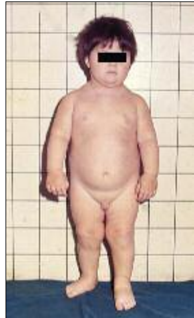
Slika 11. Šestletni deček z nizko rastjo in centripetalno debelostjo zaradi hipotiroze, ki je posledica ekto-pične ščitnice.