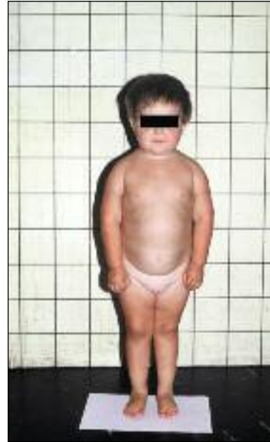
Slika 10. Štiriletni bolnik z Laronovim sindromom. Poleg nizke rasti so očitni okrogel, luskast obraz, relativna makrokranija, sedlast nos, centripetalno kopičenje maščevja, mikropenis, majhne dlani in stopala – akromikrija.

Rast je zavrtja tudi pri Cushingovem sindromu zaradi povečanega izločanja glukokortikoidov npr. zaradi adenoma hipofize, ki prekomerno izloča adrenokortikotropni hormon (ACTH), ali tumorja nadledvične žleze (slika 12). Enaki znaki se pojavijo tudi pri