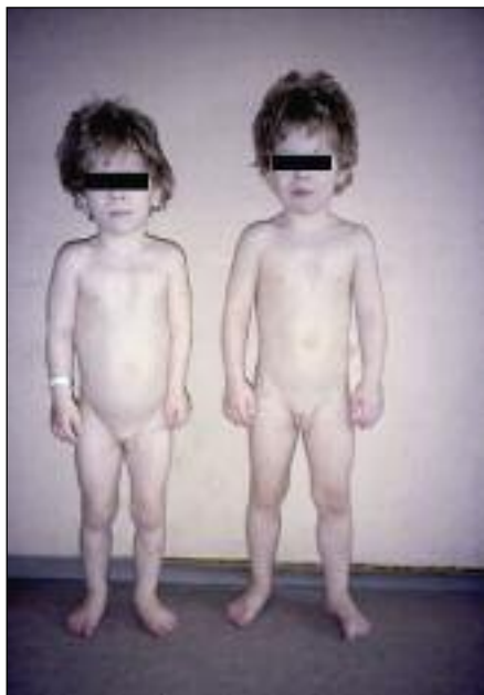
Slika 4. Značilen videz pri triletnih bratih dvojčkih z Aarskog-Scottovim sindromom.