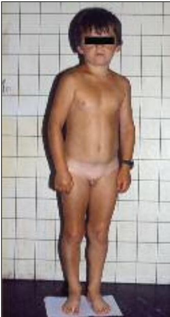
Slika 9. Sedemnajstletni bolnik s panhipopituitarizmom. Poleg nizke rasti je očitna odsotnost sekundarnih spolnih znakov.