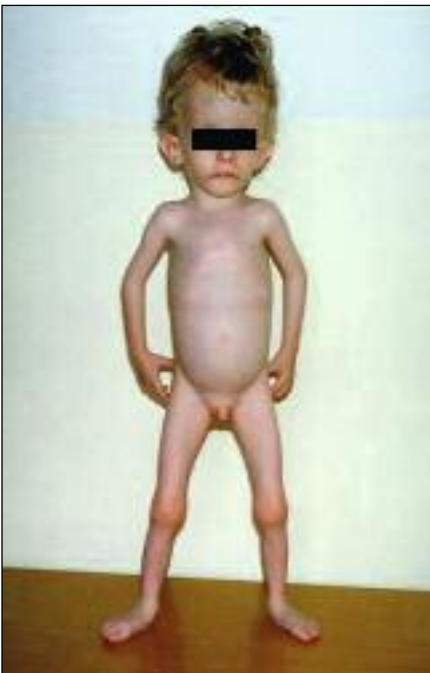
Slika 2. Tipičen videz otroka s Silver-Russellovim sindromom.

Deden je tudi sindrom Aarskog-Scottov oz. facioidigitogenitalni sindrom, ki sta ga opisala Aarskog leta 1970 in Scott leta 1971. Za sindrom so značilni: nizka rast, okrogel obraz, hipertelorizem, antimongoloidna lega oči, spuščene veke, štrleče nosnice, majhne dlani in stopala, kratki prsti – brahidaktilija, vdrt prsni koš in kožna guba okrog spolovila (slika 4).