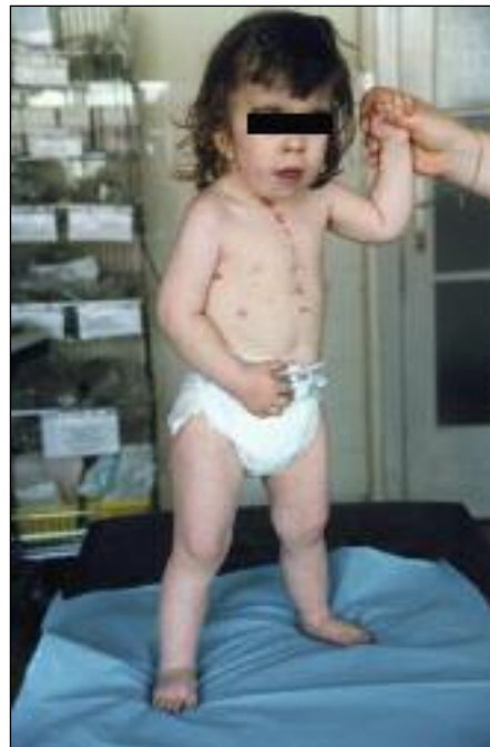
Slika 3. Tipičen videz triletne deklice s sindromom po Cornelijji de Lange.