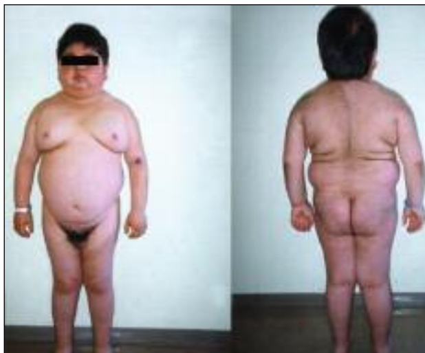
Slika 12. Tipičen videz osemletnega otroka s Cushingovo boleznijo zaradi adenoma hipofize, ki prekomerno izloča adrenokortikotropni hormon. Otrok je nizke rasti, ima lunast obraz, centripetalno kopičenje maščevja in strije.