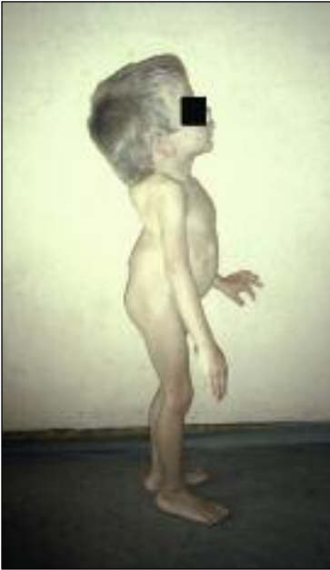
Slika 7. Otrok z mukopolisaharidozo. Poleg nizke rasti je očitna deformacija hrbtenice in prisnega koša.

razgradnji in sintezi glikogena. Znanih je devet vrst bolezni, ki se klinično razlikujejo in so povezane s prekomernim kopičenjem glikogena v jetrih, mišicah in vseh telesnih strukturah. Rast je izrazito znižana pri tipu 1, ki nastane zaradi pomanjkanja encima glukoze-6-fosfataze, tipu 4 zaradi pomanjkanja encima amilo-1,4-1,6-transglukozidaze in tipu 9, pri katerem manjka encim fosforil-beta-kinaza (20).