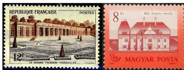
Slika 11. Veliki trianon v Versaillu in grad v Bük.