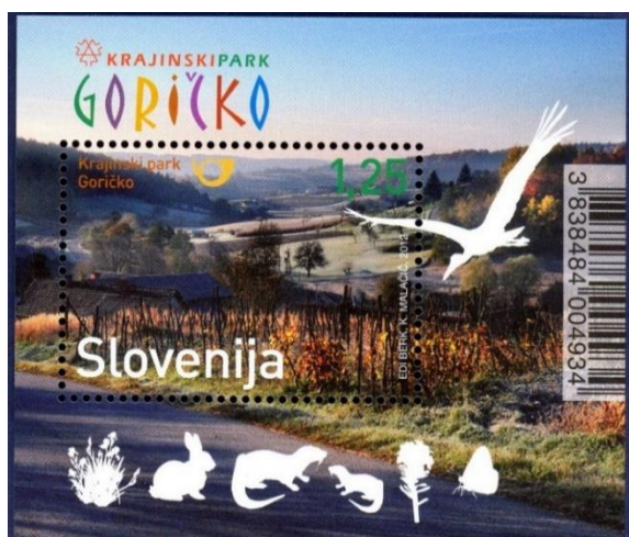
Slika 10. Blok z motivom Krajinskega parka Goričko.