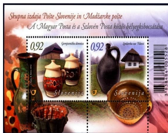
Slika 9. Blok skupne izdaje Pošte Slovenije in Madžarske pošte.

V Muzejski vasi Železne županije v Szombathelyu so obnovili slovensko dimnico iz Zgornjega Senika iz začetka 19. stoletja. Stene so iz lesenih brun, slemensko ostrejšje je izoblikovano na »škarišča« in pokrito s slamo. Hišo s črno kuhinjo so leta 1978 razstavili in ugotovili, da je bil stanovanjski del prvotno sestavljen iz dimnice, veže in kleti. V dimnici je bilo pet lin z giblivo desko, ena odprtina za zračenje in ena odprtina za odvajanje dima. Pri madžarskem tipu dimnice je imel vsak prostor poseben vhod iz odprtega hodnika. V skupni izdaji znamk sta Pošta Slovenije in Madžarska pošta izdali blok z dvema znamkama z nazivno vrednostjo za 0,92 evra v Sloveniji in 260 forintov na Madžarskem z motivom Lončarske vasi in Dimnice.