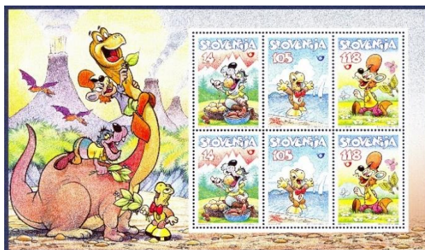
Slika 4. Blok z znamkami na katerih so Zvitorepec, Trdonja in Lakotnik.