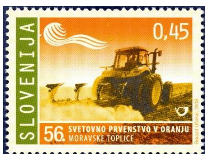
Slika 7. Znamka posvečena 56. svetovnemu prvenstvu v oranju.

5. Leta 2009 je bilo od 4. do 9. septembra 56. svetovno prvenstvo oračev v Tešanovcih. Prvo svetovno tekmovanje oračev je bilo leta 1953 v Kanadi. V Sloveniji smo imeli prvo republiško prvenstvo v oranju leta 1956 v Novem mestu. V samostojni Sloveniji je bilo prvo državno tekmovanje leta 1991 v Apačah v Pomurju. Danes tekmujejo orači v oranju s plugi krajniki in z obračalnimi plugi na strnišču in ledini. Dva najboljša tekmovalca z državnega tekmovanja se udeležita svetovnega prvenstva, ki poteka vsako leto v drugi državi. Na sliki 7 je znamka za 0,45 evra, posvečena temu prvenstvu z motivom traktorja.