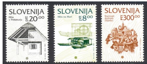
Slika 1. Znamke iz serije »Slovenija Evropa v malem« - prekmurska hiša, plavajoči mlin in dožnjek.