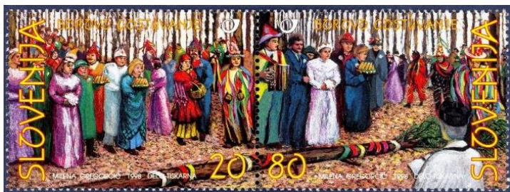
Slika 3. Borova gostuvanje.