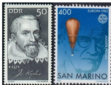
Slika 12. Znamki posvečeni Johannesu Keplerju in Augustu Piccardu.

Ta pregled kaže, da je tudi Prekmurje uvrščeno na filatelistični zemljevid. Morda bo kdo našel še katero znamko, ki bi jo lahko dodal k gornjemu pregledu. Prepričani pa smo lahko, da bodo pošte tudi v prihodnje izdajale znamke, ki ji bo možno uvrstiti v tak pregled.