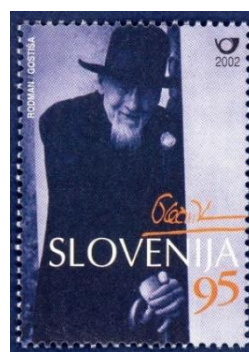
Slika 5. Znamka s portretom arhitekta Jožeta Plečnika.