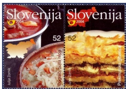
Slika 6. Znamki, ki prikazujeta značilne prekmurske jedi.

5. Leta 2009 je bilo od 4. do 9. septembra 56. svetovno prvenstvo oračev v Tešanovcih. Prvo svetovno tekmovanje oračev je bilo leta 1953 v Kanadi. V Sloveniji smo imeli prvo republiško prvenstvo v oranju leta 1956 v Novem mestu. V samostojni Sloveniji je bilo prvo državno tekmovanje leta 1991 v Apačah v Pomurju. Danes tekmujejo orači v oranju s plugi krajniki in z obračalnimi plugi na strnišču in ledini. Dva najboljša tekmovalca z državnega tekmovanja se udeležita svetovnega prvenstva, ki poteka vsako leto v drugi državi. Na sliki 7 je znamka za 0,45 evra, posvečena temu prvenstvu z motivom traktorja.