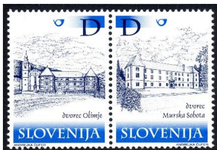
Slika 2. Znamki v sotisku iz serije »Grajske stavbe na Slovenskem« - dvorec Olimje in grad v Murski Soboti.