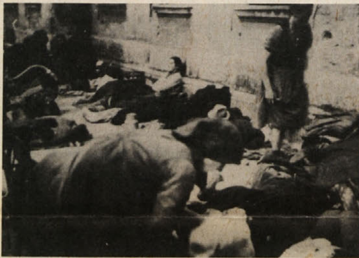
Izseljenci ob povratku na beljaškem kolodvoru

Izid knjige je finančno podprlo Zvezno ministrstvo za znanost, pa tudi Zveza slovenskih izseljencev; obsega 480 strani in stane prav toliko šilingov. Skoraj odveč je povedati, da je ta dokument koroškega etničnega čiščenja neobhodno potreben za vse generacije in za oba naroda na Koroškem. S.W.