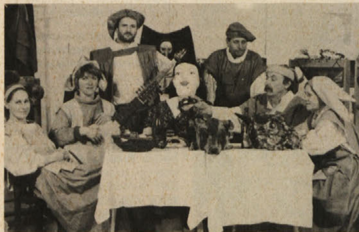
Biser srednjeveške glasbene umetnosti so lahko poslušali v Šentjanžu: Hortus Musicus z madrigalno komedijo

Glasbo, kakršne ne moremo slišati vsak dan „v živo“, pa tudi ne v tako kvalitetni izvedbi, nam je v ponedeljek zvečer predstavila skupina Hortus Musicus. Ti glasbeniki (šest jih poje, igra instrumente in pleše) so znani daleč preko koroških meja in dežela Koroška jih ra-