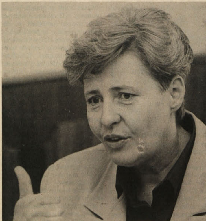
Zvezna ministrica za ženska vprašanja Johanna Dohnal