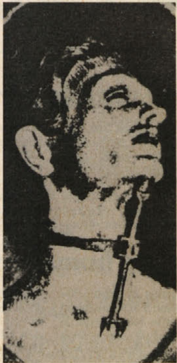
Razstavo mučilnega orodja si je doslej po Evropi ogledalo že ogromno obiskovalcev.

proti kršitvi človekovih pravic po vsem svetu, je soorganizator zato, ker je mučenje tudi danes eno najbolj razširjenih zločinov nad človekom. AI bo ob razstavi srednjeveških instrumentov imela svoj prostor, kjer bodo obiskovalcem predložili današnje metode mučenja po svetu. Grozljivo je, da je mučilno orodje, kakršno so uporabljali nekoč, tudi še danes v rabi, nekateri samo še bolj prefinjeni z novimi tehničnimi možnostmi.