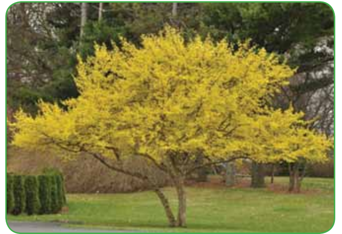
Rumeni dren - zgodnjepomladanski okras

Japonska medvejka je gost grmiček, ki zraste do 0,70 metra visoko. Cveti rožnato rdeče od konca junija do konca avgusta. Od drugih sort se loči po globoko in ostro napiljenem, zavihanem listnem robu. Primerna je za prosto rastoče