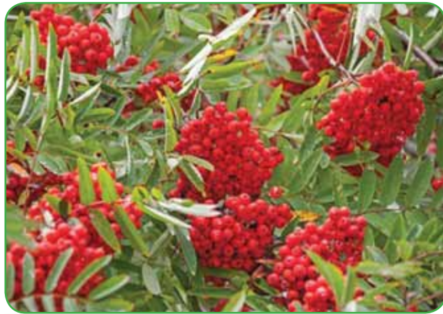
Jerebika z oranžnimi plodovi

Naš dom oziroma hiša, v kateri bomo dogo živeli, nam je pobrala veliko prihranjenega zasluzka. Ko se lotimo urejanja okolice, pa nam običajno