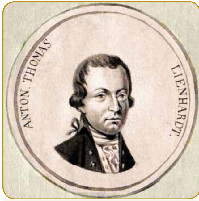
Komedije Antona Tomaža Linharta eške gnes dostakrat špilajo v slovenski gledališčaj