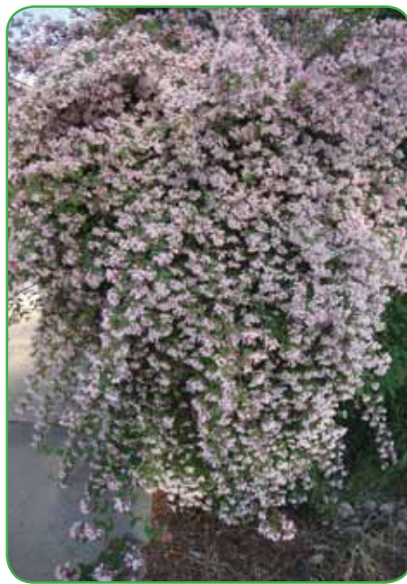
Kolkvicija z rožnatimi cvetovi

mo pritlikavega pohabljenca. Kolkvicija je cvetoča grmovnica, ki cveti od maja do junija. Cvetovi so rožnati z rumenim grlom zvončaste oblike. Primerna je za prosto rastočo do tri metre visoko ali striženo