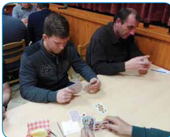
Koncentracija domačega igralca

Letos so Sakalovci gostili mednarodno tekmovanje v šnopsu, ki so se ga udeležili kvartopirci iz štirih vasi. Ob domačinih so sodelovali ljubitelji šnopsa iz Slovenske vesi v Porabju in iz Peskovec ter Šalovec v Prekmurju.