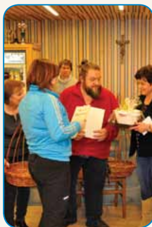
VINO, ROGLJIČKI IN MLADI stran 4