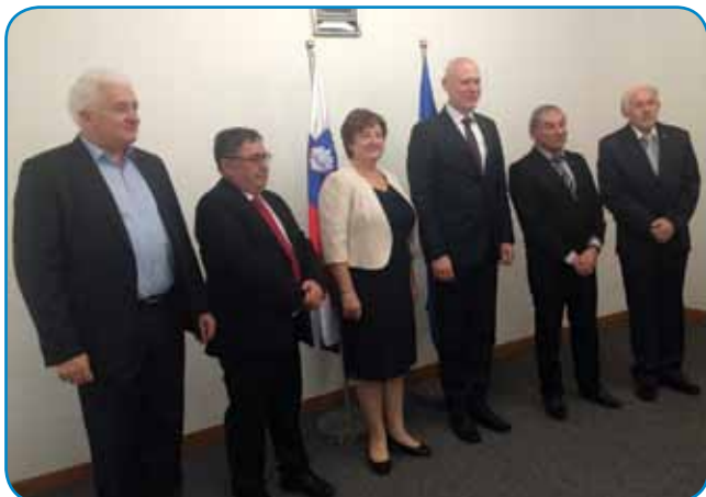
Slovenska zagovornica pred sejo mešane komisije v Ljubljani v družbi predsednika Državnega zbora, generalnega konzula in predstavnikov Porabskih Slovencev

moramo nameniti največ pozornosti. Če imamo na kulturnem in jezikovnem področju veliko stvari urejenih, predvsem kar se tiče financiranja, moramo zdaj več narediti za gospodarski razvoj Porabja. Predpogoj za to, še posebej za