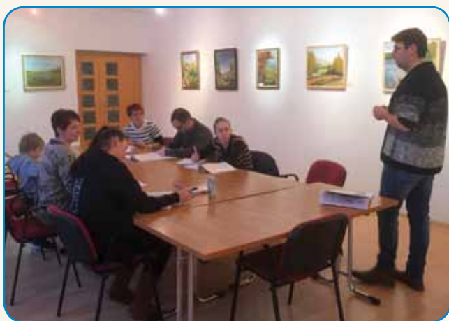
VSAK PONEDELJEK SE SKLANJA IN SPREGA V SLOVENSKEM DOMU stran 3