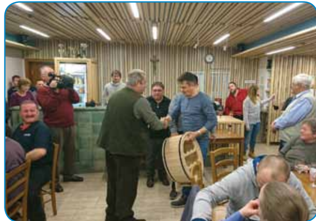
Podelitev priznanj za najboljša vina

Pređen je po zimskem premoru Slovenska vzorčna kmetija na Gornjem Seniku ponovno odprla svoja vrata tistim, ki hočejo ob koncih tedna kaj dobrega pojediti