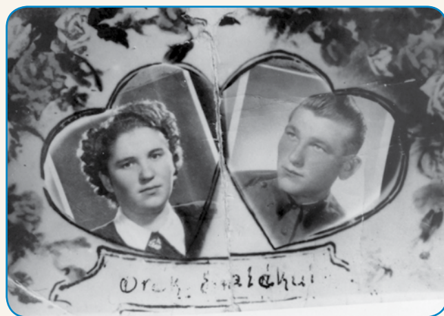
DJA SEM NAPREJ KOSILA, MLAJŠI PA ZA MENOV stran 8