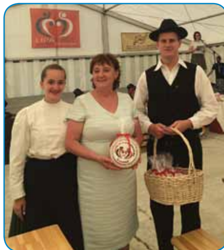
Z mladima folkloristikoma na Lipafestu

Prvi mandat, v katerem je trinajst narodnosti na Madžarskem prvič imelo svoje zastopnike v parlamentu, je po mnenju sogovornice prinesel veliko pozitivnega: »Poslanca,