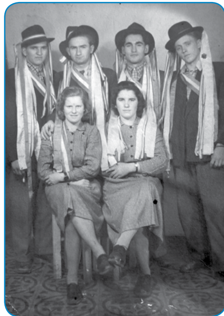
S padaškinjov pa andovskimi regruti (naborniki)

»Nej je bilau lagvo, vejn samo dvakrat. Gnauk, gda so ene čakali, steri so prejk meje