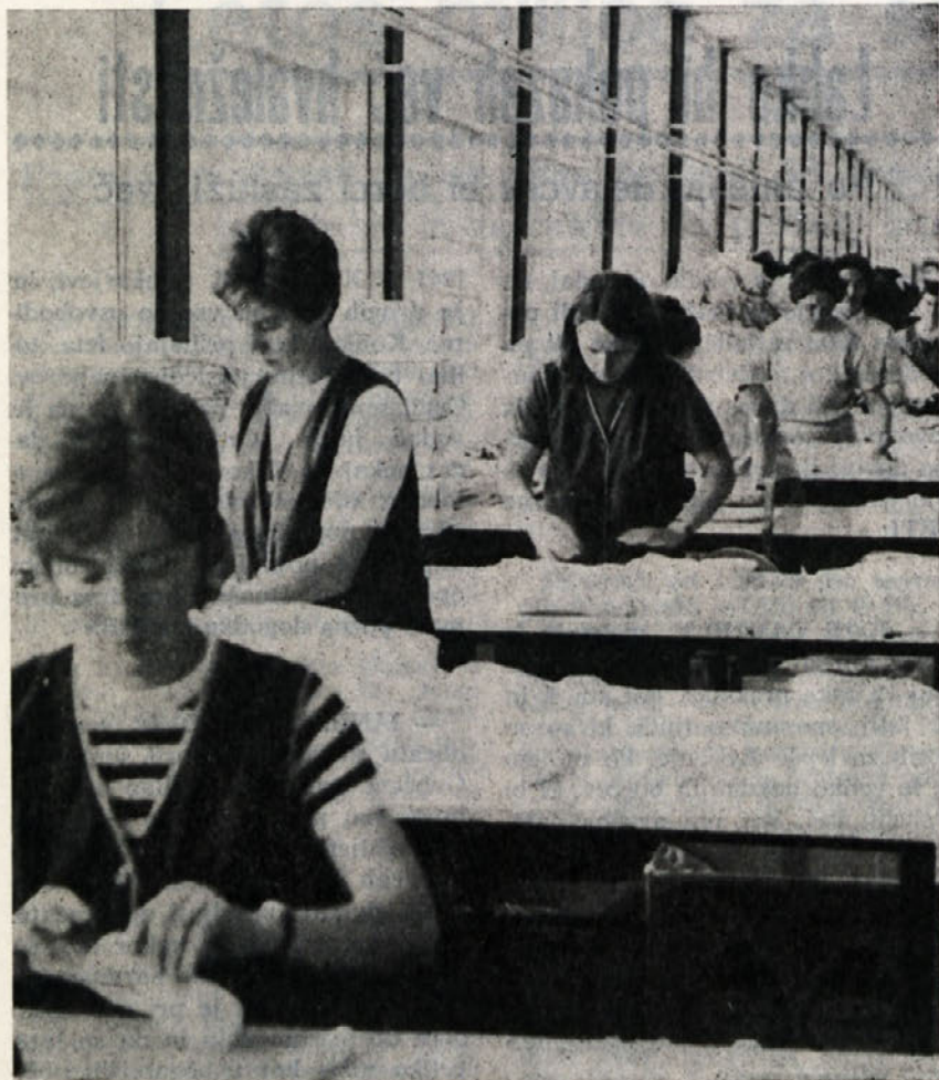
V metliškem obratu so v konfekciji pred kratkim uredili prostor za pakiranje izdelkov. Vrsta delavk ima tu zaslužek.