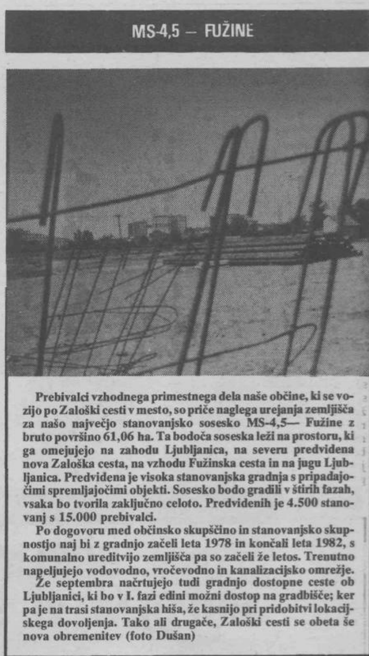
MS-4,5 — FUŽINE

Dosedanja praksa kaže, da so bila ta vprašanja največkrat postavljena v ozadje. Zato se bo treba lotiti postopnega in nemo-tenega reševanja le-teh ter za to maksimalno angažirati vse družbene subjekte, še zlasti pa družbenopolitične organizacije, ki so soodgovorne za uresničevanje ustavne ureditve KS. Težiti moramo za hitrejši proces oblikovanja KS kot naravnih življenjskih skupnosti in za dosledno izvajanje samouprave v KS. Jasno moramo opredeliti funkcije zborov delovnih ljudi in občanov, zbo-