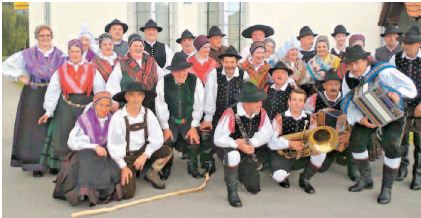
Kamniški folkloriki smo to polejte zaključili še eno lepo in bogato sezono ljudskega plesa in petja.