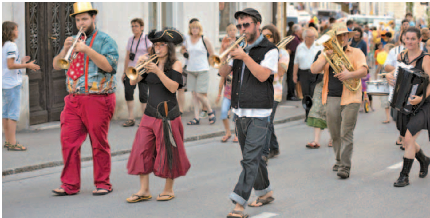
S povorko, ki jo je vodila mednarodna zasedba Banda Krenšnita od Keršmančevega parka do Samčevega predora, se je začel letošnji 11. Festival Kamfest, ki je znova postregel z vrsto presežkov. Preko 80 organiziranih dogodkov, lepo število spontanega dogajanja in skoraj 27.000 obiskovalcev na več kot desetih prizoriščih v desetih dneh pove dovolj.