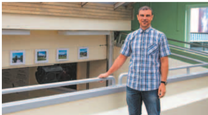
V času počitnic so na Gimnaziji in srednji šoli Rudolfa Maistra Kamnik izvedli nujno potrebna investicijsko vzdrževalna dela. Med drugim so prepletkali skupne prostore, ki so sedaj odeti v svetlejšo in bolj umirjene barve.