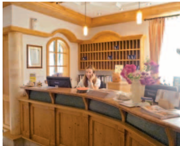
Razgibano delo receptorja zahteva ustrezno izobraženo in vsestransko osebo.

Doslej so se odrasli pri nas lahko vključili v programe gimnazija, ekonomski tehnik, predšolska vzgoja, maturitetni tečaj ter različne jezikovne in računalniške tečaje, sedaj pa širimo ponudbo na področje gastronomije in turizma . Kot pove že samo ime, je program sestavljen iz gastronomskega in turističnega dela, na GSSRM Kamnik pa bomo izvajali module s področja turizma. Program je štirileten, seveda ga lahko v okviru izobraževanja odraslih, še posebej ob prekvalifikaciji, zaključite v krajšem času. Četudi bomo usmerjeni na module turizma, si bodo udeleženci pridobili še nekaj osnovnih znanj s področja gastronomije, kar bodo lahko s pridom uporabili pri svojem delu. Pri oblikovanju odprtega kurikula bomo upoštevali značilnosti našega okolja in želje oz. potrebe turističnih ponudnikov, ki so nas podprli že pri pridobivanju programa.