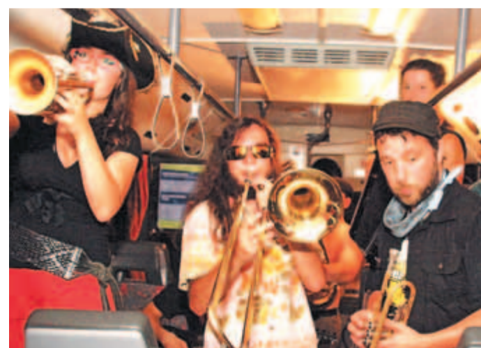
... zvečer pa je vsakega izmed njih zavzel drugačen glasbeni žanr. V prvem so poslušalci lahko prisluhnili nežnemu prepletu kitare in harmonike, na drugem so udarjali balkanski etno ritmi, zadnji pa je bil namenjen elektroni. Vsekakor enkratno doživetje, ki si ga lahko izmisli le Kamfest!