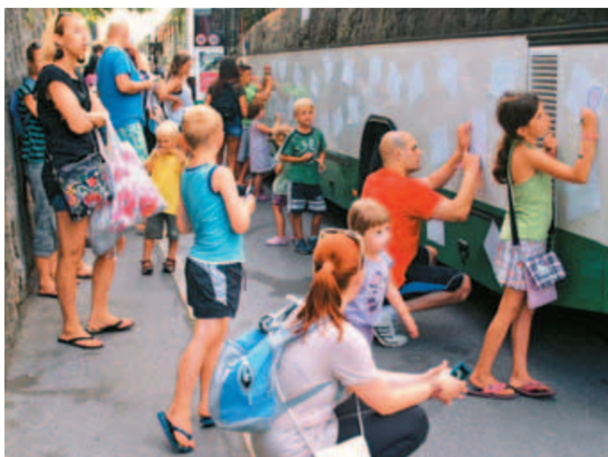
Kam-bus oz. »Kamničan« je vsekakor del kamniške folklorne. Avtobusi, ki neumorno povezujejo Kamnik s preostalimi deli Slovenije, so namreč prepeljali že številne generacije. Tudi letos sta Kam-bus in Kamnikbus brezplačno vozila obiskovalce na festival. V okviru DDV programa so Samčev predor zavzeli kar trije Kam-busi. Že pozno popoldne so na njih risbice lepili otroci.