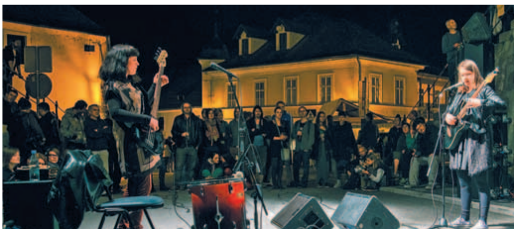
Večerni oder je postregel z biseri novejših glasbenih produkcij, s koncerti manj znanih, a vseeno izvrstnih glasbenih skupin, filmoljubi so letos na svoj račun prišli na projekcijah Kina Kamfest na dvorišču Osnovne šole 27. julija, na gradu Zaprice pa je muzej postregel z arheološkimi delavnicami, potpisnimi predavanji in nočnimi vodenji po muzeju.