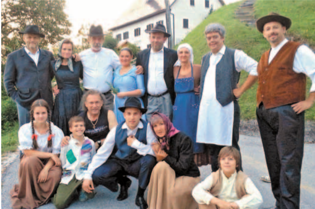
Igralci sezone 2014 z režiserjem.

no, pa tudi v prihodnje, sem bil skeptičen iz dveh razlogov: nisem poznal igralcev in ni bilo prostora za izvedbo. Z Ano sva obhodila dobršen del tunjiške zemlje: spodaj pri sadovnjakih, zgoraj pri cerkvi, na parkirišču, kjer je nekoč že stal kulturni dom... Tudi ideja za gradnjo doma pri sadovnjakih in zgoraj na parkirišču se je pojavila (imam zrisano), a ob spoznanju, da za kulturo v Tunjicah ne bo denarja, je bilo vse skupaj le pobožna želja. Potem sem si dejal: