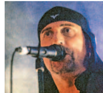
Vrhunec koncertnega dela Kamfesta z največ poslušalci so bili zagotovo Laibachi, ki so se po osmih letih znova vrnili na kamniški festivalski oder. Popolnoma nabito koncertno prizorišče dokazuje, da je mednarodno priznana slovenska skupina še vedno zelo aktualna. Tudi vreme je pripomoglo k še bolj doživljajevemu koncertu enega izmed najbolj impozantnih bendov.