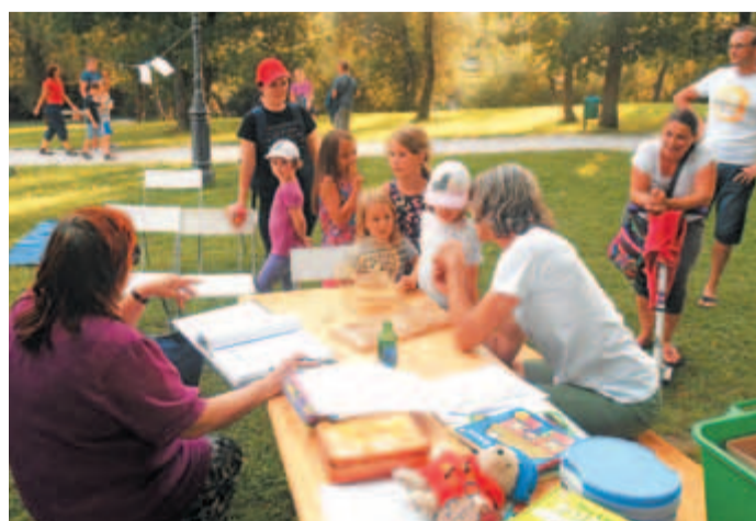
Otroci so se udeležili različnih delavnic, z veseljem so sodelovali v nagradni igri bingo, ki jo je pripravila kamniška jezikovna šola ITA. Zanimivo konverzacijo je vodil Anglež.