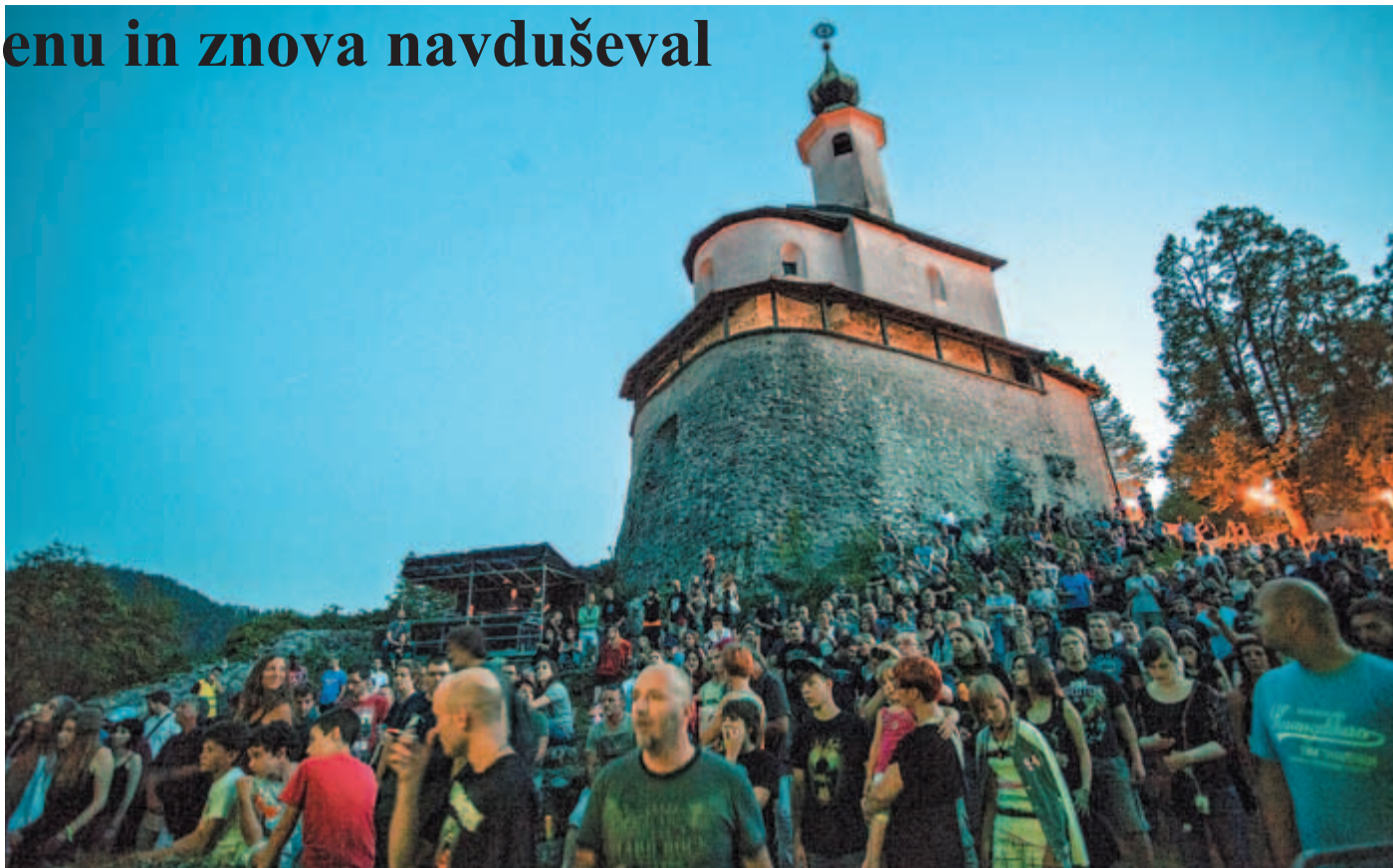
Glavni koncertni oder na Malem gradu že od prvega dne festivala pred enajstimi leti privablja največ obiskovalcev in ponuja najboljši festivalski razgled daleč naokoli. Letos je sicer organizatorjem malo prekrizalo načrte muhasto vreme, a Kamfestovci so vseeno odlično izpeljali ves načrtovan program.