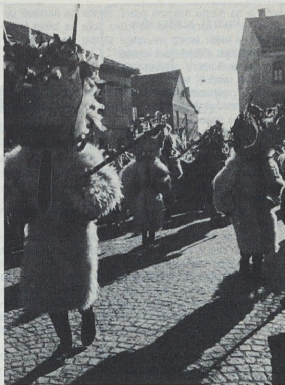
PUSTNI KORANTI poskakujejo z oglušujočim zvenketom zvoncev skozi Ptuj.