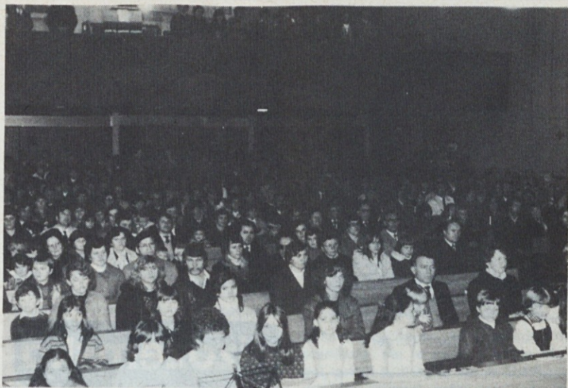
Na Miklavževo nedeljo, 5. decembra 1982, je bilo pri maši v Stuttgartu 600 rojakov, med njimi 240 otrok.

Na zdmskih župnijah je za božič bolj mirno, saj se večina zdomcev odpravi domov; tu ostanejo navad-