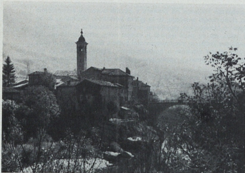
KANAL, slikovito naselje v Soški dolini, je strnjeno ob mostu čez žlebasto strugo Soče.

897 občanov je v tem tednu šlo v slovenske gozdove po kurjavo. Več kot 15 tisoč Slovencev pa si je že pred tem uradnim časom nabralo dovolj drv v gozdovih. V drvarnice je bilo spravljeno nekaj nad 79 tisoč kubičnih metrov lesa. Gozdarji so to akcijo začeli prepozno in povrhu tega še v času, ko so se začele kazati velike bencinske zagate, ki so transport drv na domove skoraj onemogočile. Letos bo gotovo naval v gozdove še večji, saj slovenska gospodinjstva pospešeno vzdavajo štedilnike na drva, peči in kamine. V to smer kažejo tudi povsem izpraznjena skladišča prodajal drv in premoga. Tudi zasebniki, ki so posekali več le-