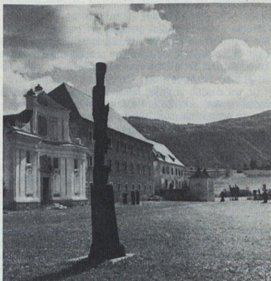
KOSTANJEVICA NA KRKI je znana po svojem gradu, nekdanjem cistercijanskem samostanu, enem najpomembnejših gradbenih spomenikov Slovenije.

A močno sva bila ogoljufana: hodilo je po poti skoraj toliko množic kakor tedaj, ko hodi ljudstvo na božja pota. Hribovcev in dolincev — vseh je bilo polno, in nekateri so bili še tako brez vsake pameti, da so vlačili s sabo otroke. Vse je hitelo v mesto in skoraj več jih je bilo kakor tisti dan, ko so ob glavo dejali onega iz polka Fer-