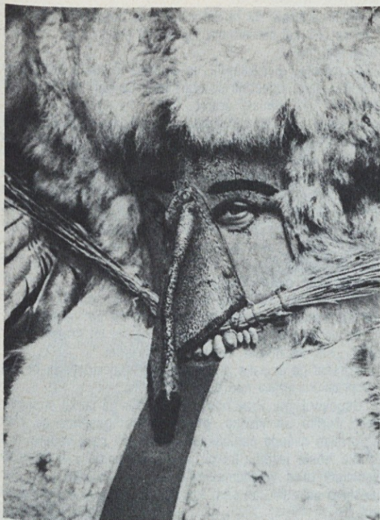
KORANTOVA MASKA vzbuja strah; hvala Bogu, da so koranti dobrodušni!

sodnikov, ki so ji zagrenili tujo domovino. Potem je povesila pogled in ga neprestano upirala predse v desko, prav kakor bi se čudila nad težko verigo, ki je ležala na ti deski in vezala njene opešani nogi.