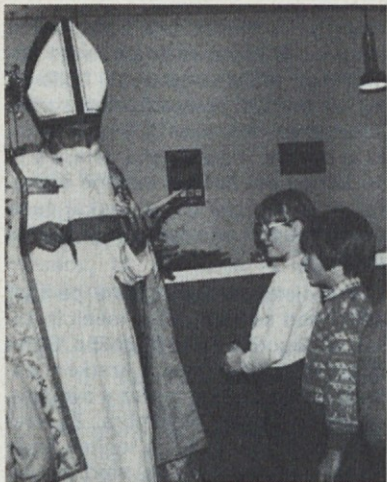
V Kirchheimu na Württemberškem je bil Miklavž radoveden, kaj otroci znajo.

od nas luč zemeljskega življenja utrnila in večna luč zasvetila. Praznovanje v cerkvi pa nadaljujmo in sklenimo doma s slovesom od jaslic. Naj bo ta dan še enkrat pri nas sveti večer: otroci naj jaslice še enkrat lepo uredijo, vse lučke prižgo, tudi blagoslovljeno svečo; skupni rožni venec ali vsaj vera in očenaš z zdravomarijo pa naj bodo naša domača izpoved vere, obenem pa zahvala in prošnja zanjo.