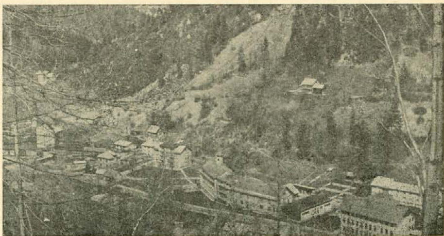
Teber po gozdnem požaru

Kljub vsem preventivnim ukrepom in opremljenim požarnim stražam nam je nad Črno 14. aprila 1980 zaradi neprevidnosti pri kajenju pogorelo dva hektarja mladega macesnovega in borovega gozda, ki smo jih pri prejšnjih dveh velikih požarih 1974/75 leta uspeli očuvati. Zdaj je na Tebru ostalo še okrog tri hektarje borovega nasada. Bodo dorasli ali pa jih bo neke sušne pomladi doletela enaka usoda?