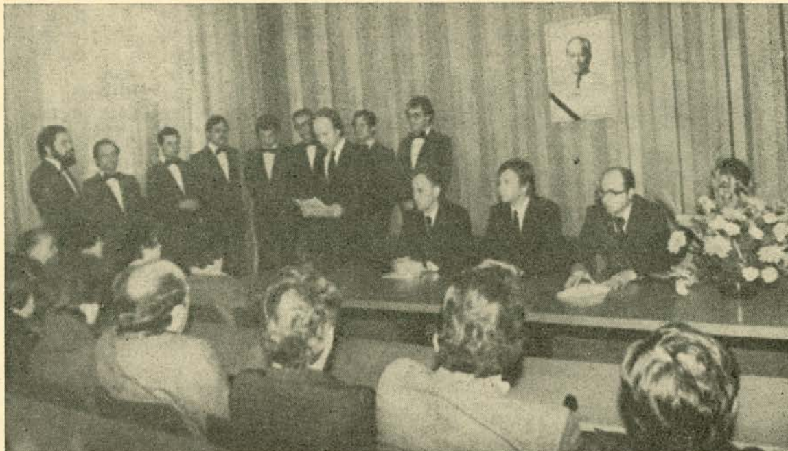
Žalni zbor delavcev delovne skupnosti za opravljanje del skupnega pomena, dne 6. 5. 1980