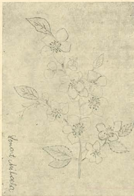
(Risba). Narisala Mihaela Lenart

Pokojni sodelavec se je vselej trudil, da bi zadostil tem povečanim naporom, čeravno so se že nekaj let po nastopu službe pri Lesni, začeli pri njem pojavljati prvi znaki bolezní. Z leti se je z (Nadaljevanje na 15. strani)