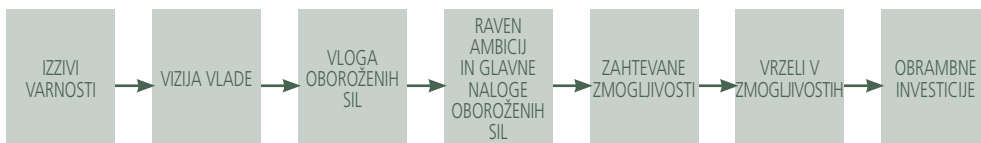
Shema 2: Potek strategije preoblikovanja kanadskih oboroženih sil