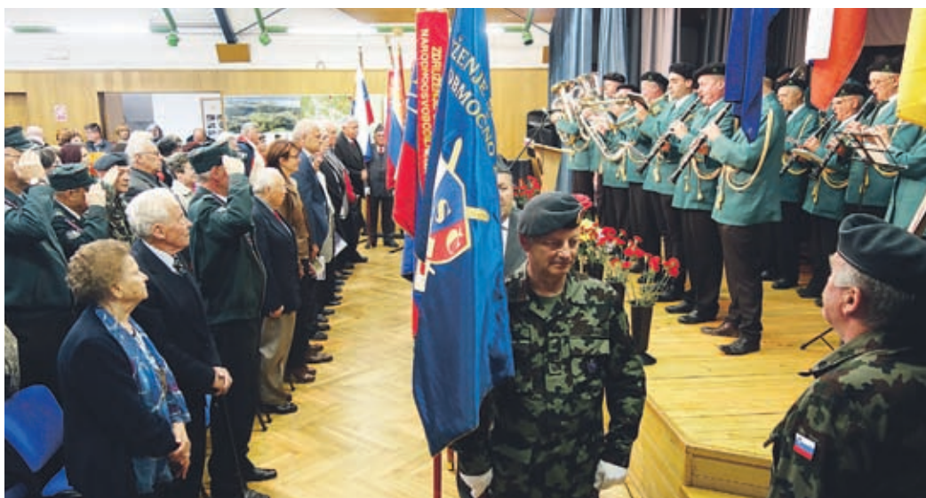
Polna dvorana škalskega doma krajanov je pokazala, da so tamkajšnji prebivalci in prebivalci še kako ponosni na domoljubje, pogum in požrtvovalnost sokrajanov.

Ko je vojna prenehala, pa so borci in aktivisti začeli delovati