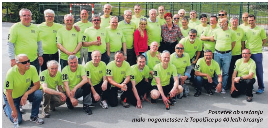
Posnetek ob srečanju malo-nogometašev iz Topolšice po 40 letih brcanja