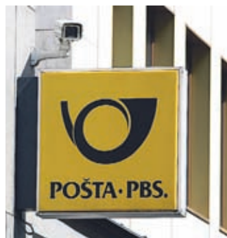
Potem ko so se pri Pošti odločili za opomin pred odpovedjo predsedniku sindikata, so sindikat nedavno izločili iz pogajanj kot nereprezentativnega

Ministrica za zdravje Milojka Kolar Celarc se je sešla z vod-