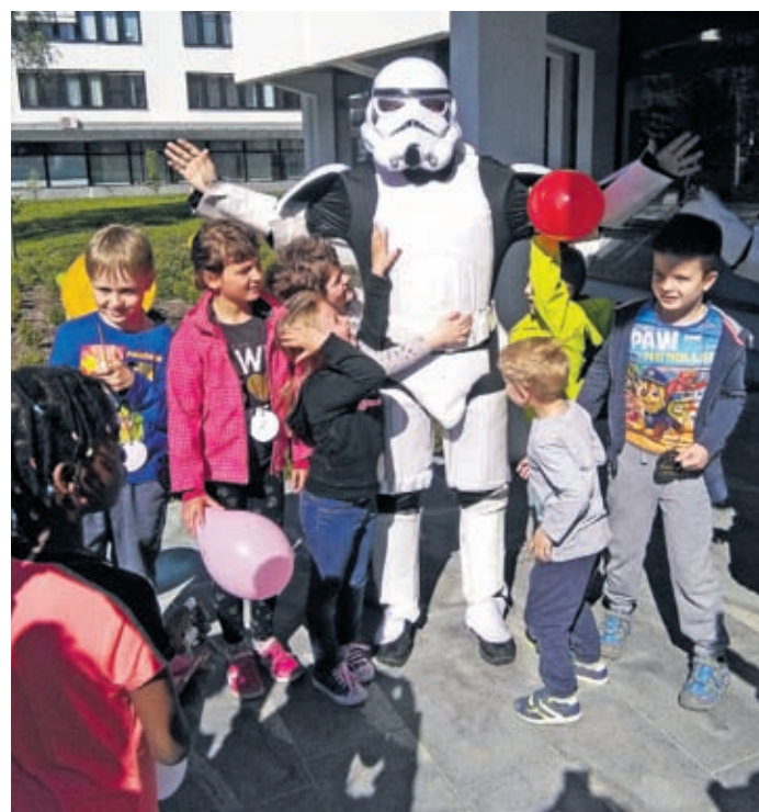
Spanje v velenjski galeriji je bilo za udeležence polno doživetje.

Zvezdogleda, ki jim je pokazal Luno. Z njegovo pomočjo so poleteli do galaktične spalnice, kjer so ob prijetnem zvoku pravljic vsi sladko zaspali. Ob sončnem vzhodu so se mali astronomi počasi začeli prebujati, tisti, ki pa so še sanjali v objemu zvezd, pa so se dokončno zbudili ob pravi vesoljski telovadbi in seveda pri astronomskem umivanju. Ali ste vedeli, da astronaut pri umivanju zob zobno kremo pogoltno? Če bi jo izpljunil, bi plavala po ladji. Preden so se razšli, so ob zajtrku pod zvezdami skovali načrt, kako bodo zavzeli Mars. Z inženirsko dovršenimi izdelki avtomobilov so se podali proti Marsu in se po epski bitki vsi skupaj poslovili.