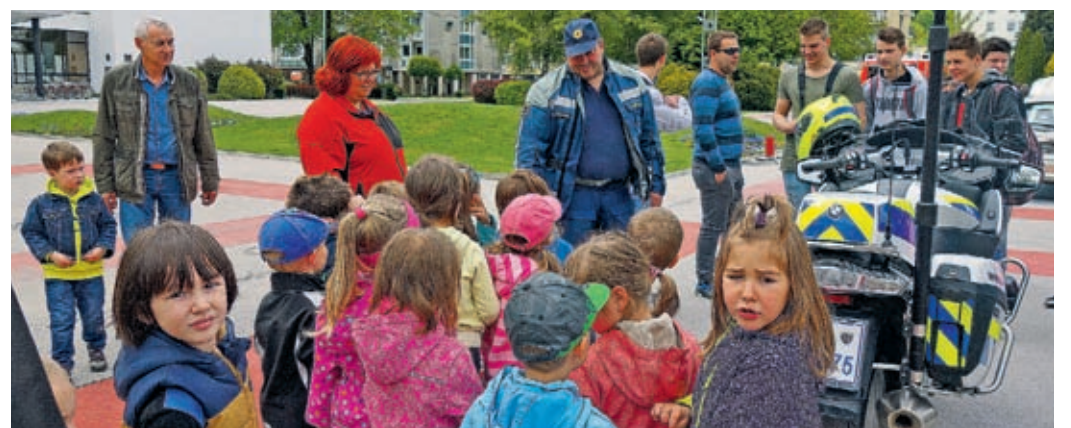
Vsebine, ki so se odvijale na Titovem trgu, niso bile namenjene le devetošolcem, ampak tudi drugim.