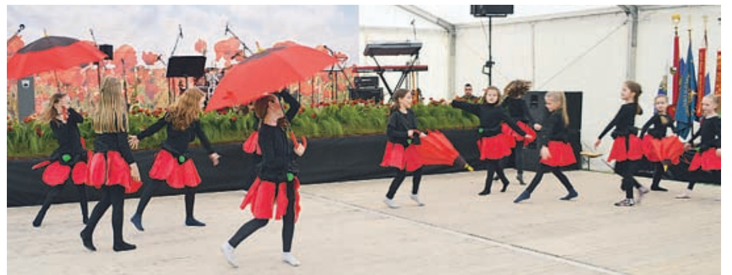
Program je bil lep kot mak, ko zacveti.

skaj vojna, ki nas je lomila in hromila skoraj pol stoletja.« Nadaljeval pa: »Čeprav ima vsak od nas glede narodne pomiritve in sprave svoje občutke, se mi zdi prav, da si že zavoljo naših otrok in vnukov prizadevamo za sožitje in spravo. Če hočemo ostati, če hočemo preživeti nedvomno burno 21. stoletje in se kot narod ohraniti, izkoristimo ta čas za to, da si med seboj kakšno