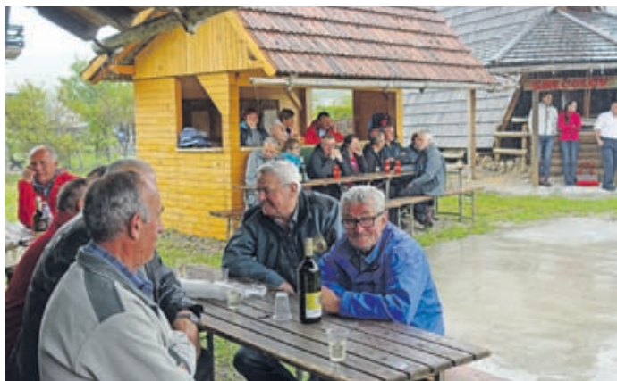
Slabo vreme ne bi smelo biti razlog za skromen obisk na prireditvi ob praznovanju jubileja, so menili organizatorji.