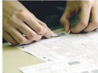
Bil je dan za preverjanje znanja.

Učenci 6. in 9. razredov osnovne šole so s preizkusom iz slovensčine začeli nacionalno preverjanje znanja, maturanti pa z esejem iz materne jezika splo-