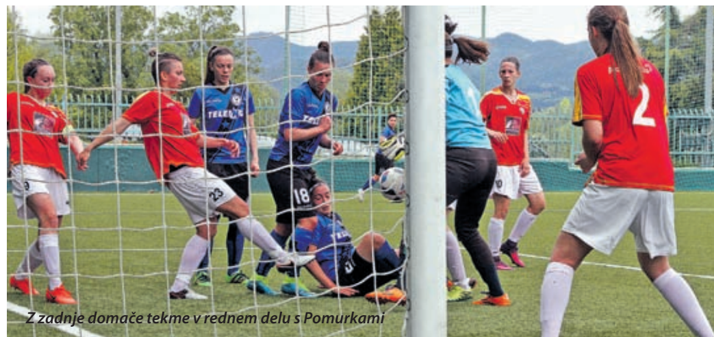
Z zadnje domače tekme v rednem delu s Pomurkami