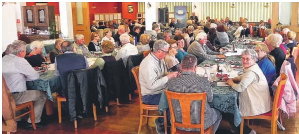
Število članov se je povečalo za dobrih deset odstotkov.

jevali so sklepe, ki so bili sprejeti na Skupščini v preteklem letu. Članstvo je bilo z opravljenim zadovoljno. Med drugim so