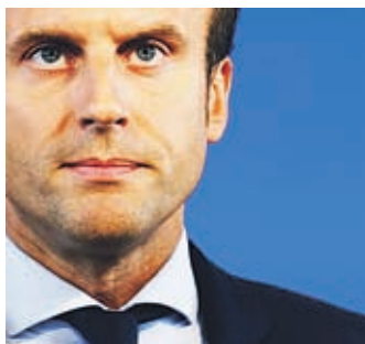
Novi francoski predsednik je Emmanuel Macron.

Bil je dan volitev. V Franciji so v drugem krogu izbrali predsednika: to je postal Emmanuel Macron, ki je s 66 odstotki glasov prepričljivo premagal Marine Le Pen, ki jih je dobila 34 odstotkov.