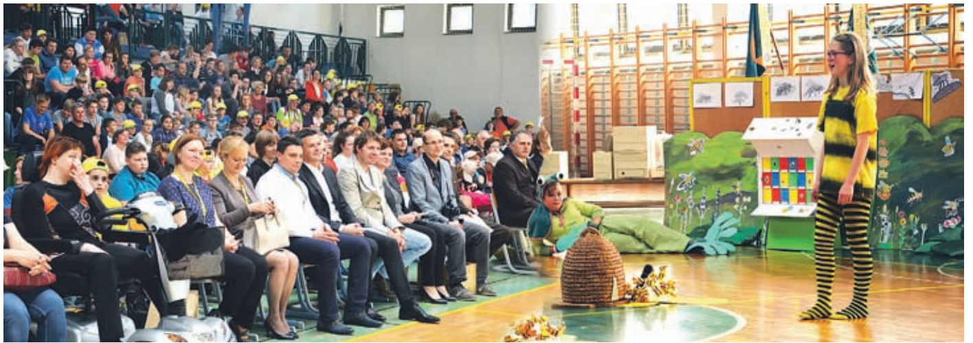
Simpatičen kulturni program na zaključni prireditvi so pripravili učenci in učitelji šole gostiteljice tekmovanja. Rdeča nit je bila narava in prijateljstvo, glavna junakinja pa čebelica Maja. Na zaključni prireditvi so mlade čebelarje iz vse države pozdravili tudi najvišji predstavniki čebelarske zveze, občine in države.

Na tekmovanju je sodelovalo več kot 550 učencev in njihovih mentorjev iz 110 osnovnih šol, srednjih šol in čebelarskih društev iz vse Slovenije. Bilo jih je toliko, da so morali tekmovalce