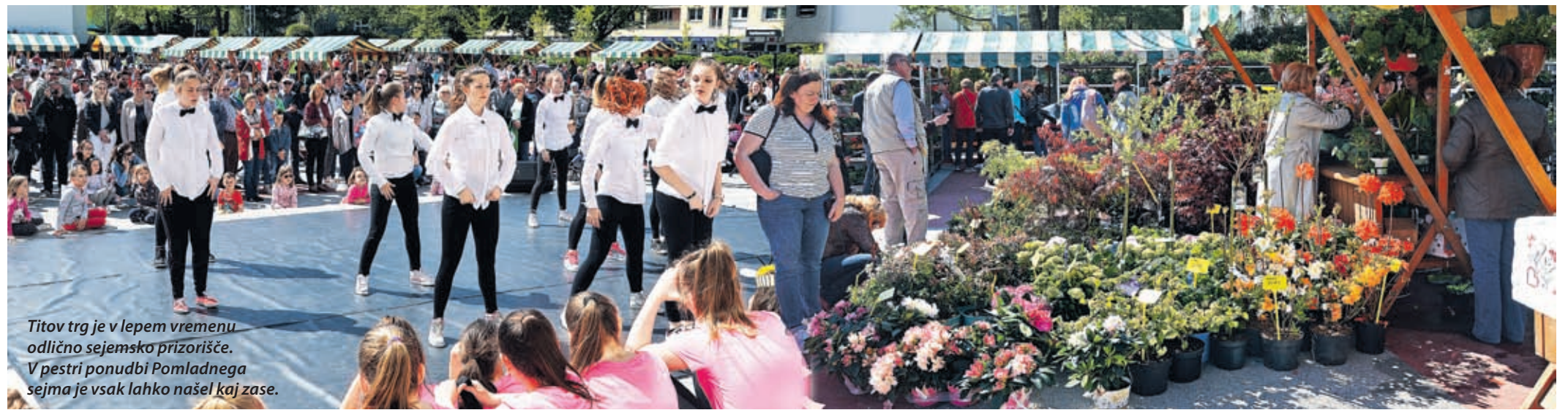
Titov trg je v lepem vremenu odlično sejmsko prizorišče. V pestri ponudbi Pomladnega sejma je vsak lahko našel kaj zase.