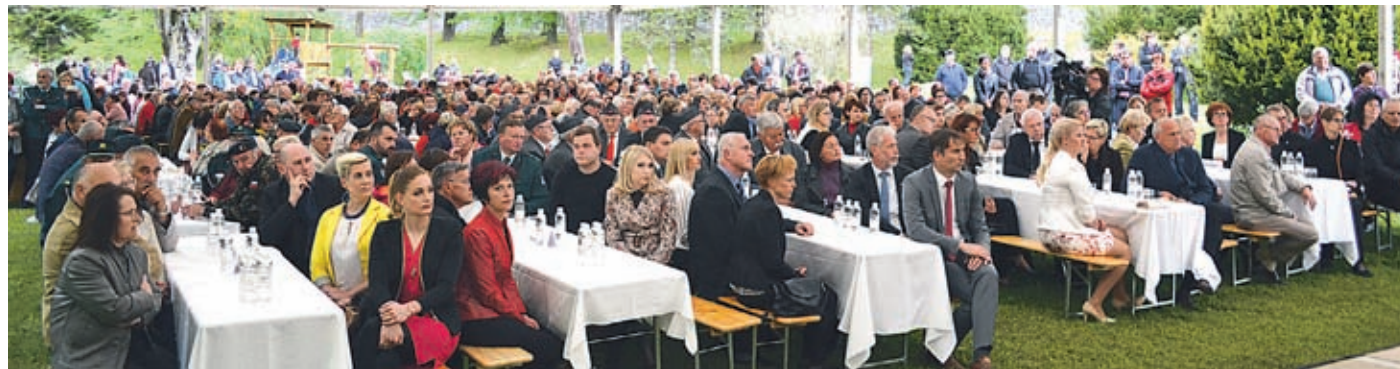
Čas, da dosežemo spravo in odpustimo, je bilo osnovno sporočilo proslave – ne samo zbranim na njej, ampak vsem Slovincem in Slovincem.

stvar odpustimo. Nič ni potrebno pozabiti. Nasprotno. Vsega se je treba dobro spomniti! Čas pa je tudi, da kaj odpustimo, da se pomirimo, da zaradi tragičnega narodnega razkola v polpretekli zgodovini danes ne živimo eden