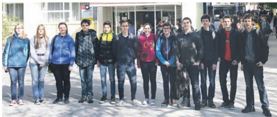
Udeleženci 61. tekmovanja srednješolcev v znanju matematike za Vegova priznanja z velenjske gimnazije