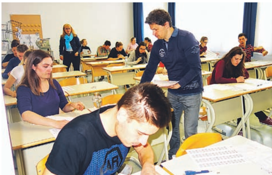
S pisanjem eseja se je začel letošnji spomladanski del splošne mature.

Kot je še pojasnil, je v zadnjem letniku srednje šole namenjenih pripravi na matura kar nekaj šolskih ur. Maturitetni standard