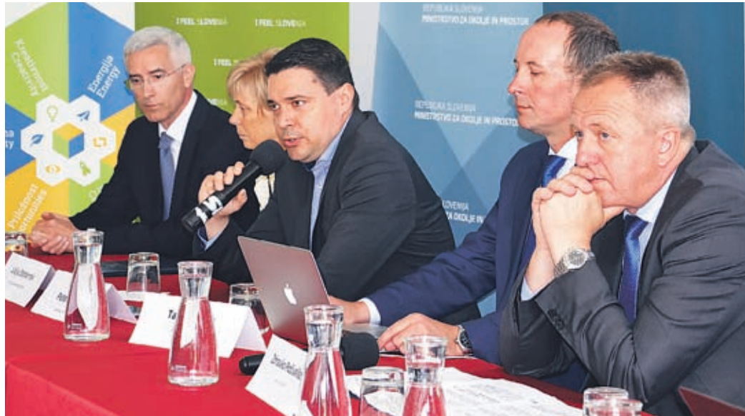
V Velenju je vlada začela dvodnevni obisk v SAŠA inkubatorju, kjer je potekal posvet o spodbujanju krožnega, predvsem zelenega gospodarstva.

Slovenija se, kot smo slišali na posvetu, uvršča med vodilne države na svetu pri prehodu v krožno gospodarstvo. »Prehod v zeleno gospodarstvo pri tem predstavlja priložnost za razvoj novih