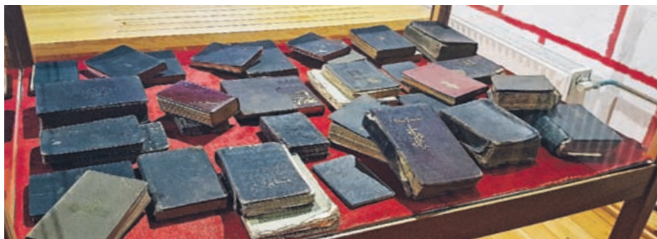
Ker gre za dragocene knjige, so jih razstavili v vitrinah.