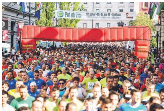
Pot ob žici je tudi letos privabila veliko rekreativcev.

Sodišče je odločilo, da je rektor Univerze na Primorskem trpinčil in spolno nadlegoval nekdanjo direktorico tamkajšnjih študent-