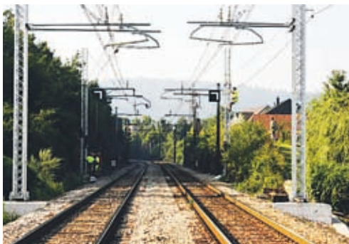
Po vetu Državnega sveta so poslanci še enkrat potrdili zakon o drugem tiru.

Nemški finančni minister je predlagal, naj ima Velika Britanija po izstopu iz EU sicer dostop do enotnega trga unije, a le v zameno za plačilo.