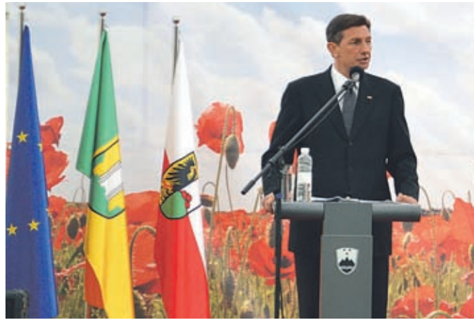
Slavnostni govornik Borut Pahor: »Nič ni treba pozabiti. Nasprotno. Vsega se je treba dobro spomniti.«

»Najprej in predvsem izrekam izredno hvaležnost vsem, ki ste nam z uporabo ubranili in ohranili našo narodno svobodo, vaš srčni pogum, domoljubje in žrtvovanje ne bodo nikoli pozabljeno.« S temi besedami je začel slavnostni nagovor vsem Slovincem, ne le prisotnim na proslavi v Topolšici, predsednik republike Borut Pahor. »Slovinci smo bili sredi prejšnjega stoletja, na začetku dramatične morije, obsojeni na uničenje. Temu smo se uprli. Partizansko gibanje je bilo izraz domoljubnega upora proti okupatorju. Postalo je del svetovnega zavezništva proti nacizmu in fašizmu in ga porazilo. V tem smislu je bila narodnoosvobodil-