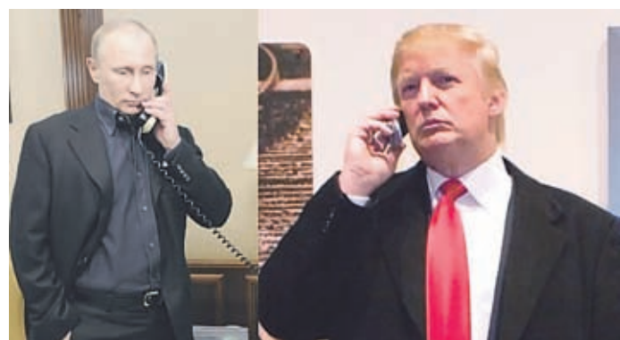
Predsednika sta se pogovarjala po telefonu, v živo pa sta imela ob sebi vsak druge pomembneže.