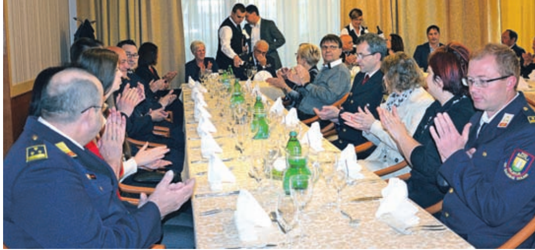
Sprejem poveljnikov velenjskih gasilskih društev je bil tudi letos sproščen. Druženje s predstavniki MO Velenje pa so vseeno izkoristili tudi za pogovore o delu.

nji pišejo zgodbe s pozitivnim predznakom. Nam pa je povedal tudi, da ne le da bo občina finančno pomagala pri obnovi velenjskega gasilskega doma, v roku treh ali štirih let bodo vsa