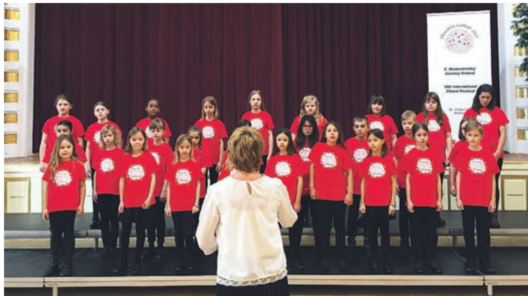
Otroški pevski zbor Glasbene šole Velenje v Bratislavi