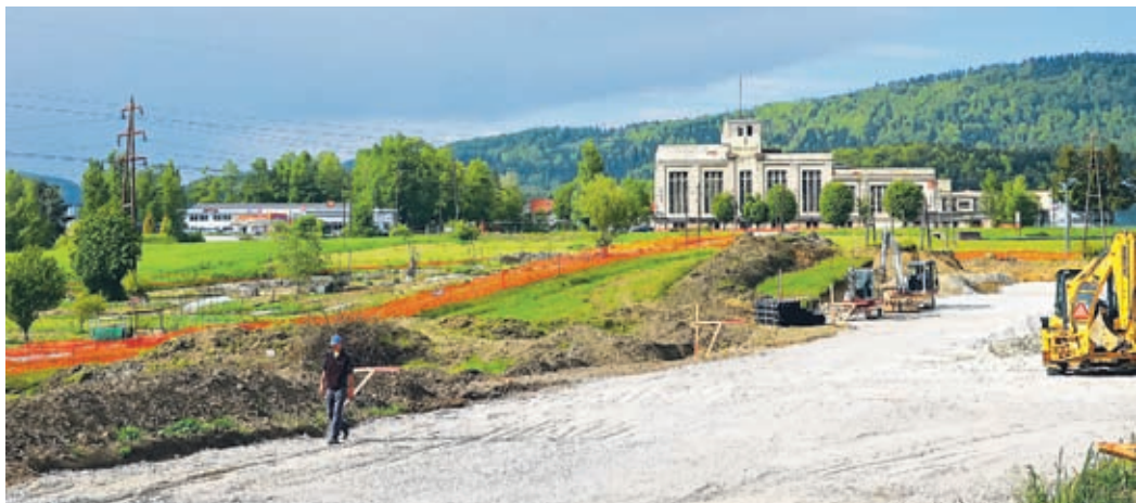
Na severnem delu ob Koroški cesti verjetno že kmalu ne bo več vrtičkov, nekaj pa jih je z začetkom del pri izgradnji industrijske cone v Stari vasi že »ugasnilo«. Najemniki so se umaknili takoj po obvestilu MO Velenje.

na ostaja enaka kot prejšnja leta, 20 evrov za letni najem. Velika večina vrtičkarjev svoj košček zemlje pridno obdeluje in vztraja, letno imajo le 5 do 10 najemnikov, ki se iz različnih razlogov vrtičku odpovedo. Praviloma ga hitro oddajo naslednjemu najemniku. Sploh, ker je občina na vseh vrtičkarskih naseljih poskrbela za vodo, odvoz komunalnih odpadkov in stranišča.