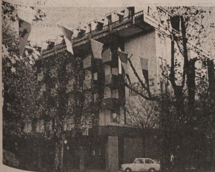
PH-PALACE HOTEL, Corso Italiana 63

34 170 Gorizia-Gorica, Italy; Tel.: 0481-82166; Telex 461154 PAL GO I