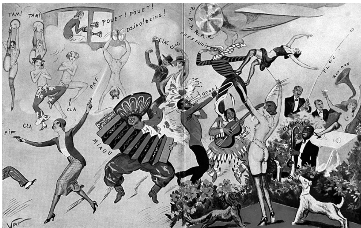
Razvratno rajanje v zlatih dvajsetih letih 20. stoletja.

tam počne! Srbski častniki se čudijo in zgražajo nad tem pijančevanjem pri Slovencih, kakršnega v Srbiji niso vajeni. « Eden od prvih ukrepov nove vlade, ki je kmalu po koncu vojne razveselil pivce žganja, pristaše protialkoholnega gibanja pa bridko razočaral, je bila splošna sprostitev žganjekuhe (ki je za časa habsburške monarhije bila dovoljena le ob plačilu takse) z obrazložitvijo, da bi šlo sicer veliko sadja v nič. 3