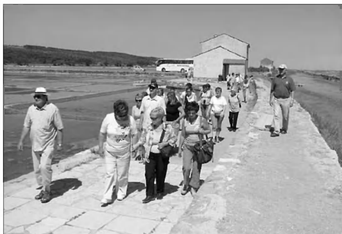
Prihod v Sečoveljske soline

Že v jutranjih urah smo jo z Gradeža mahnili čez Bloško planoto proti Notranjski, mimo Cerknškega jezera do Unca in po avtocesti proti morju. Naš prvi cilj je bil grad Socerb, ki stoji na samem kraškem robu. Prav na tem delu se kraški rob najbolj približa morju in s svojih prepadnih pečin nudi prekrasen razgled na Tržaški zaliv in na kraje ob njem. Sprehodili smo se okrog gradu, se naužili svežega primorskega zraka in modrine morja ter se tik pod Socerbom, na obnovljeni stari kmetiji odprtih vrat v Kostelu, na Osmici, okrepčali z domačim kraškim pršutom, sirom in kruhom. Belo vino in refošk sta stekla po grlu in nam vtila novih moči za nadaljevanje poti.