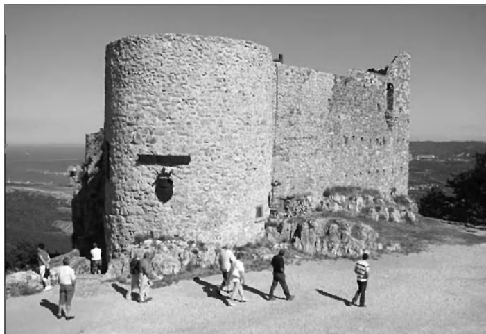
Sprehod po Sočerbškem gradu