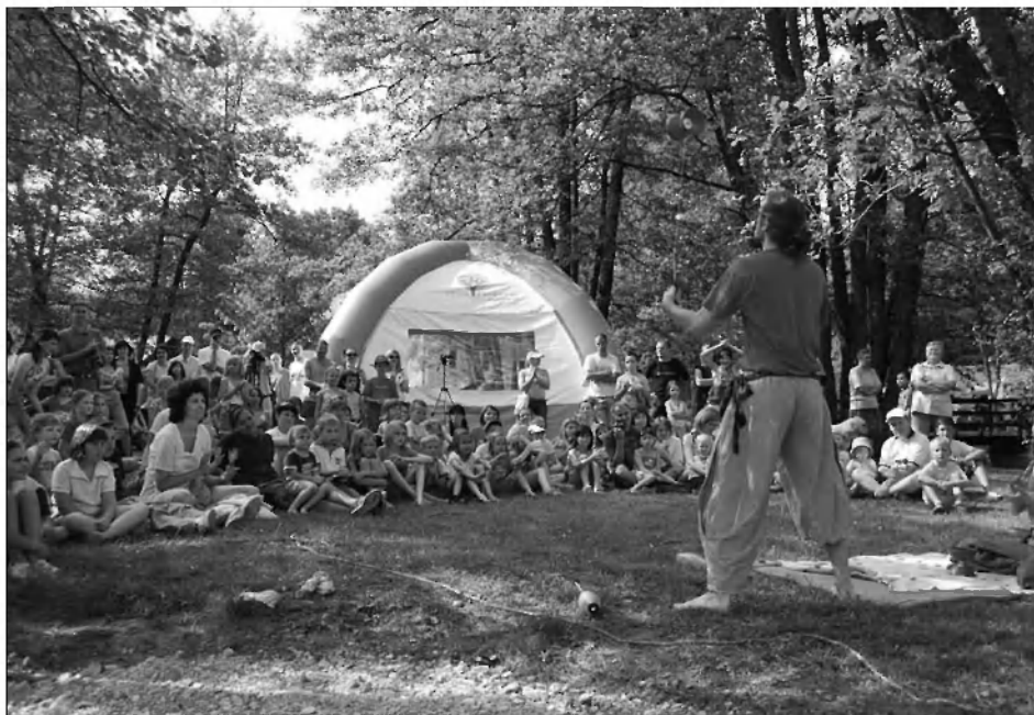
Cirkokrogov Cirkuški piknik.

Predstavili so se številni ustvarjalci in prostovoljci s širšega slovenskega prostora, ki so pripravili več kot 40 delavnic in dogodivščin, tako za tiste najmlajše kakor tudi za tiste mlade po srcu. Obiskovalci so lahko ustvarjali z umetniki, športniki, mentorji, strokovnjaki za različna področja ter ljubiteljskimi znalci in snovalci, ter si ogledali nekaj skupinskih kreacij. Z bližnjega prostora so se predstavili: Zavod Parnas s projektom Mokrišče – izziv za podeželje, OŠ Primoža Trubarja Velike Lašče s Komarčki – Turističnim podmladkom in njihovim Komarčkovim špasom, Unicefovimi punčkami, Lutkovnim krožkom; Velikolaška tržnica JZ Trubarjevi