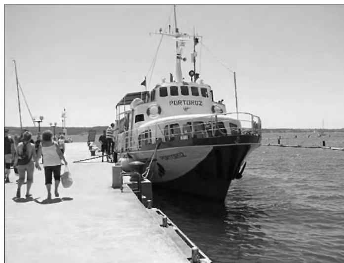
S turistično ladjo na križarjenje

ki je ponosno plapolala na Jorasovi hiši, medtem ko je gospodar ravno kosil trato. Nadaljevali smo po ozki makadamski cesti do Sečoveljskih solin in Solinarskega muzeja. Lokalni vodiči so nas podučili, da je pogoje za nastanek stoletja starih Sečoveljskih solin ustvarila reka Dragonja s svojimi naplavinami, največji obseg obdelovalnih površin pa so dosegli v 1. polovici 19. stoletja. Danes soline z delujočim območjem merijo več kot 650 hektarjev. Bogato kulturno pričevanje postavlja Sečoveljske in Strunjanske soline na raven etnološke, tehnične, zgodovinske in krajinske dediščine izjemnega pomena v državnem merilu. Od leta 1990 sta oba kompleksa varovana z občinskimi odloki znotraj dveh krajinskih parkov, kot njunih najpomembnejših delov. Območje kanala Čiasini in Covane 131 v Sečoveljskih solinah je leta 2001 pridobilo status kulturnega spomenika državnega pomena, krajinski pa je tudi pod zaščito UNESCO. Kot pravijo, so soline darilo sonca, morja in pridnih rok solinarjev, katerih delo je bilo od nekdaj težko. Ogledali smo si ohranjene peči za peko kruha. Po pripovedovanju solinarjev so bile v solinah štiri takšne