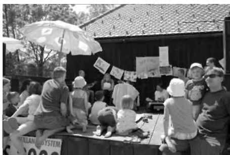
339 - Predstava Daj mi poljubček .

Dan sonca je vesela in razigrana prireditev, ki podpira medgeneracijsko pristno druženje in sodelovanje, ekološko vedenje in medkulturni dialog. Kot je že tradicija, je bil tudi letos vstop na dogajanje povsem brezplačen. Dan sonca je festival, na katerem družine in skupine ustvarjajo, spoznavajo in se preizkušajo v najrazličnejših gibalnih, umetniških, znanstvenih in glasbenih dejavnosti ter ročnih spretnostih.