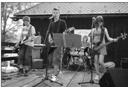
Mladi domači glasbeniki.