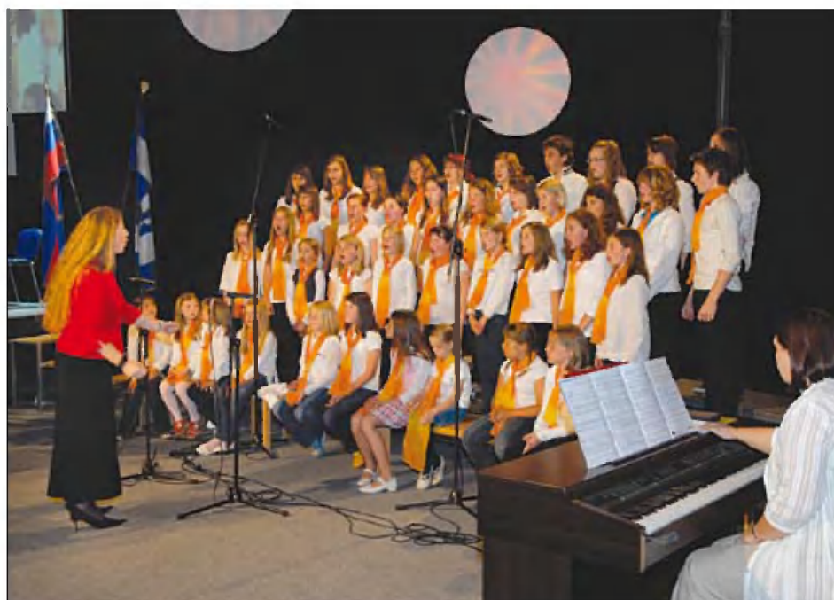
Otroški in mladinski pevski zbor iz Osnovne šole Primoža Trubarja