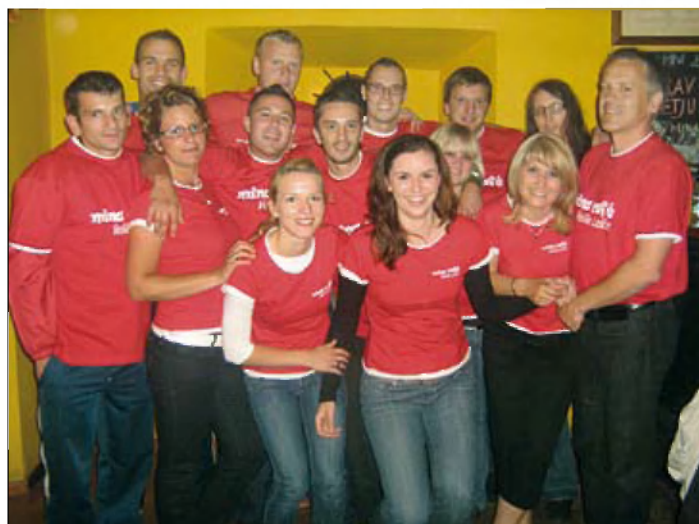
Malonogometna ekipa MINA CAFÉ z navijači

Športni pečat lokalu dajejo nogometaši. Tretjo sezono nosi domača malonogometna ekipa njeno ime MINA CAFÉ. Letos