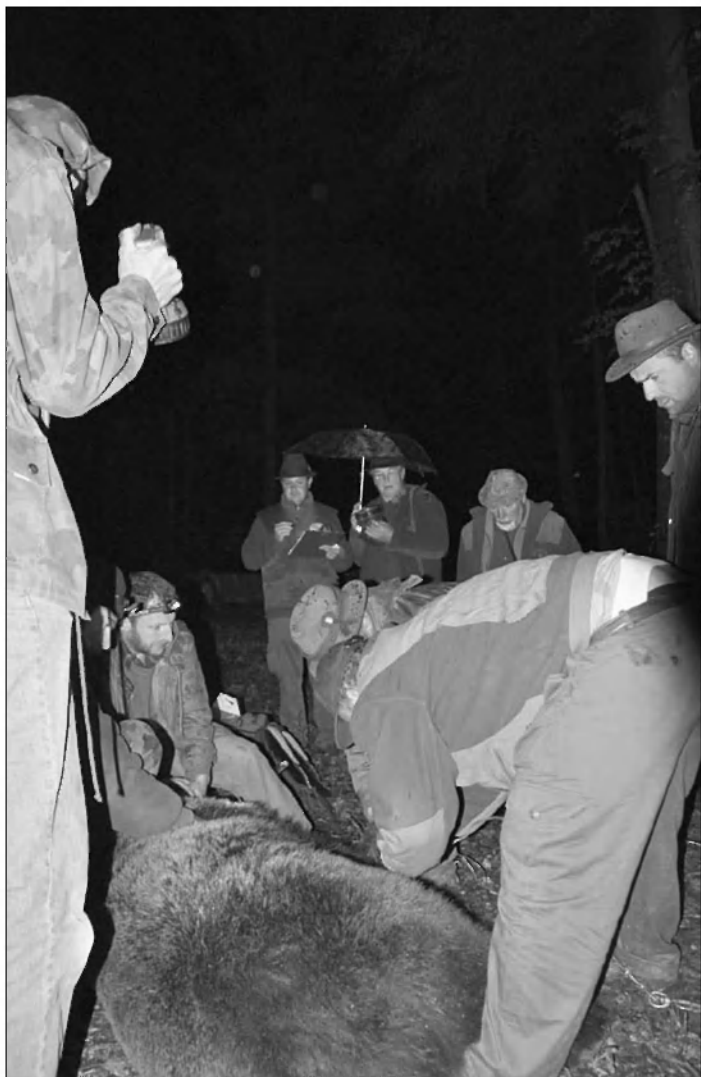
Ekipa je kljub dežju z usklajenim delom za izmero vseh potrebnih podatkov, odvzem vzorcev in namestitvev ovratnice potrebovala vsega dvajset minut.