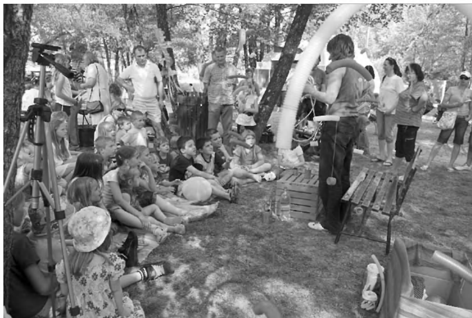
Tlak po vilinsko.

jem, ki se je pričel ob 19. uri in končal v trdi temi. Na sklepnem dogodku festivala so najprej nastopili mladi glasbeniki, ki so presenetili s svojo dobro uigranostjo in interpretacijo znanih pesmi (Schorch, Distorsion) ter tudi s svojimi avtorskimi pesmimi (Ogrožena vrsta). Vse mlade glasbene sile izhajajo iz OŠ Primoža Trubarja, kjer so začele delovati. Večer so popestrile etno zabavne Ribničanke, klepetulje Radia Mlajku VETD iz Hrovače, s seboj so imele celo mlajkarja in od njih smo izvedeli, kaj se govori po vasi o dnevu sonca. Z vročimi ritmi in orientalskim plesom je navdušila skupina Nawar, da smo peli in odplesali po travnem otočku pri mlinu v noč, pa sta poskrbeli glasbeni skupini Šambala in Što prašičkov poje.