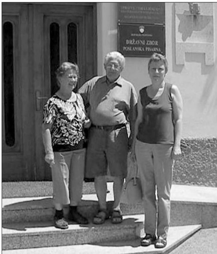
Na potovanju po Avstriji in Sloveniji sta se Švicarja ustavila v pobrateni Občini Velike Lašče.

Od prvega stika z Občino Lutzelfluh letos mineva trinajst let. V teh trinajstih letih smo se spoznavali, učili in kulturno bogatili z različnimi izmenjavami občinskih delegacij, društev, učiteljev, pevcev, učencev, podjetnikov, vzpostavili stike z veleposlaništvu v Bernu in v Ljubljani ter s Švicarji v Sloveniji, podpisali sporazum o pobratenuju obeh občin in skupaj praznovali velike obletnice (Jeremiasa Gotthelpha in Primoža Trubarja).