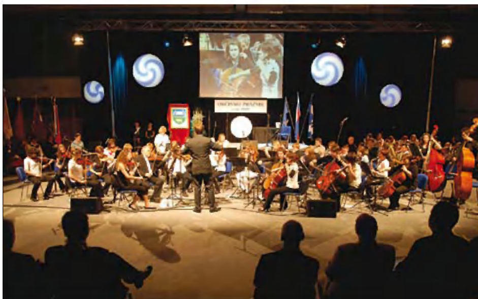
Simfonični orkester Glasbene šole Ribnica