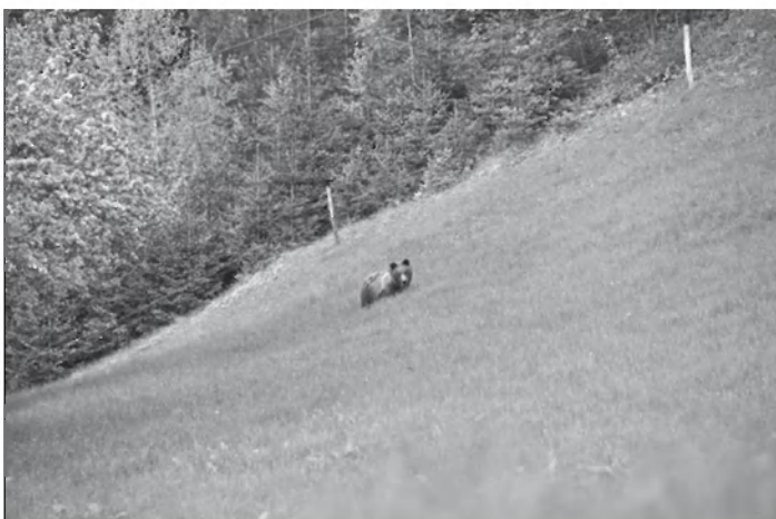
Medved se pase v travi.