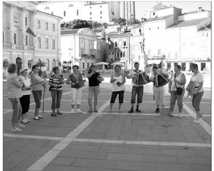
Prepevanje na Tartinijevem trgu

Sicer majavih nog smo stopili na trdna tla in se sprehodili po najlepšem in najstarejšem mestu na naši obali, Piranu. Na