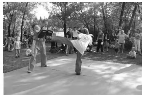
Kickboxing klub Spirit.

Da smo uspeli pripeljati festival do te prepoznavnosti v širšem prostoru, smo zelo hvaležni našim ustvarjalcem in prostovoljcem ter številnim podpornikom festivala. Tako so nas v letu 2009 podprli Občina Velike Lašče (ki nam tudi omogoča brezplačno uporabo prostora), Zavarovalnica Triglav Zdravstvena zavarovalnica, podjetje Domex Elektronika d.o.o., Didakta.