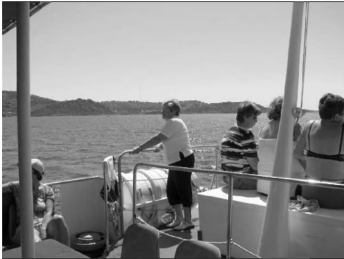
Ogled obale iz turistične ladje

Polni vtisov in že razgreti od žgočega sonca smo se odpeljali do Portoroža, kjer so se nekateri najbolj vroči ohladili v morju, drugi pa v bližnjih lokalih. Da se sami povsem prepričamo o površini modrine slovenskega morja, smo se s turistično ladjo Portorož podali na »križarjenje« od Portoroža do Ankarana in nazaj do Pirana. Mornarji so nam na ladji pripravili