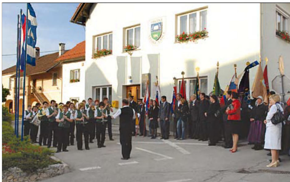
Koncert godbe Kostanjevica na Krki