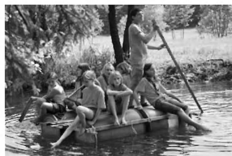
Skavti so naredili pravi splav, ki je deloval.