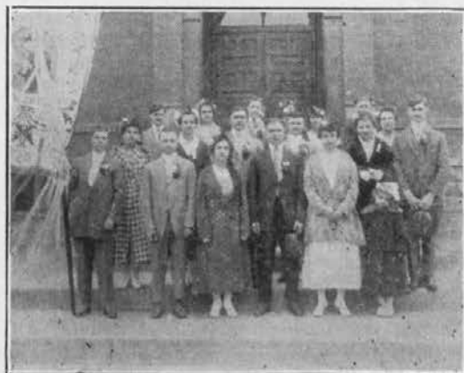
Botri in botrice zastave društva sv. Alojzija v Pueblo, Colo.

Da smo pokrili te stroške smo imeli zabavo 1. aprila v dvorani sv. Jožefa. Zahvalimo se tudi dr. sv. Jožefa, ker nam je dalo v ta namen dvorano brezplačno.