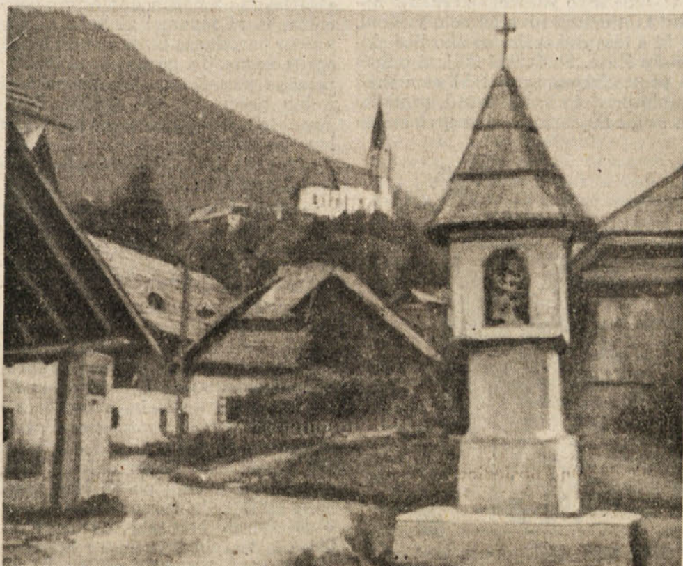
Rimsko znamenje v Drevljah

vplivati na potek volitev samih. Tem ljudem, naj so že zaostali, nerazpoloženi proti naši oblasti ali pa večni godrnjači, je treba pokazati naše uspehe. V vsej naši propagandi pa moramo vedno in vselej dosledno stremeti za tem, da ne bo pri nas noben človek zapeljevan in zapeljan, da se ne bo zaradi napačne in lažne, neresnične propagande nihče odločil proti svojim pravim, lastnim interesom. So tudi taki, ki z našimi pridobitvami ne morejo biti zadovoljni, ker sedaj pač ne morejo več živeti od izkoriščanja dru-