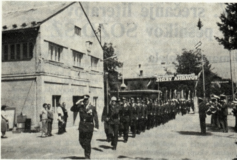
40-letnica gasilskega društva Verige 1977. leta

Vselej so se odlikovali po udarnem delu, bodisi pri graditvi v Radovni, graditvi vodovoda za bolnico Jesenice ali gradnji stanovanja za člana gasilskega društva. Dolga