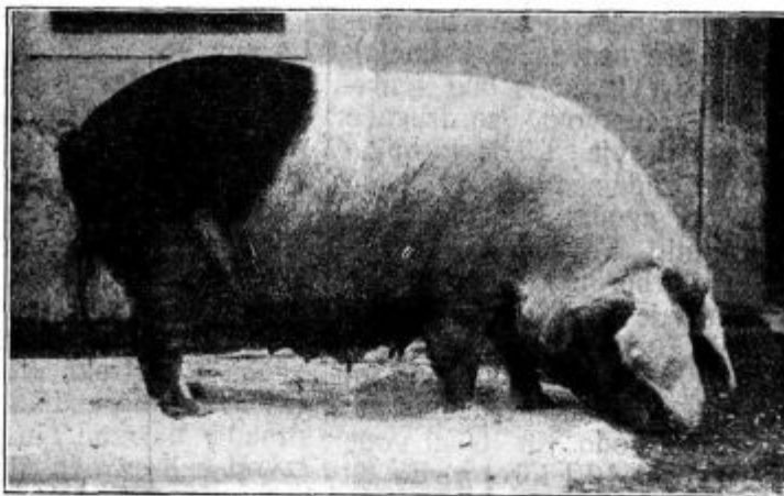
Pod. 43. Gorenjska črnolisasta svinja, po odstavitvi mladičev. Skotila je trikrat po 10 do 14 pujskov ter se je odlikovala tudi z veliko mlečnostjo. Vzrejena je bila v Lescah pri Radovljici.