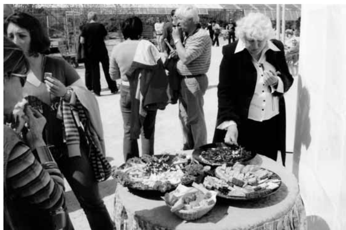
Obiskovalci so se navdušili nad bogato kulinarčno ponudbo.