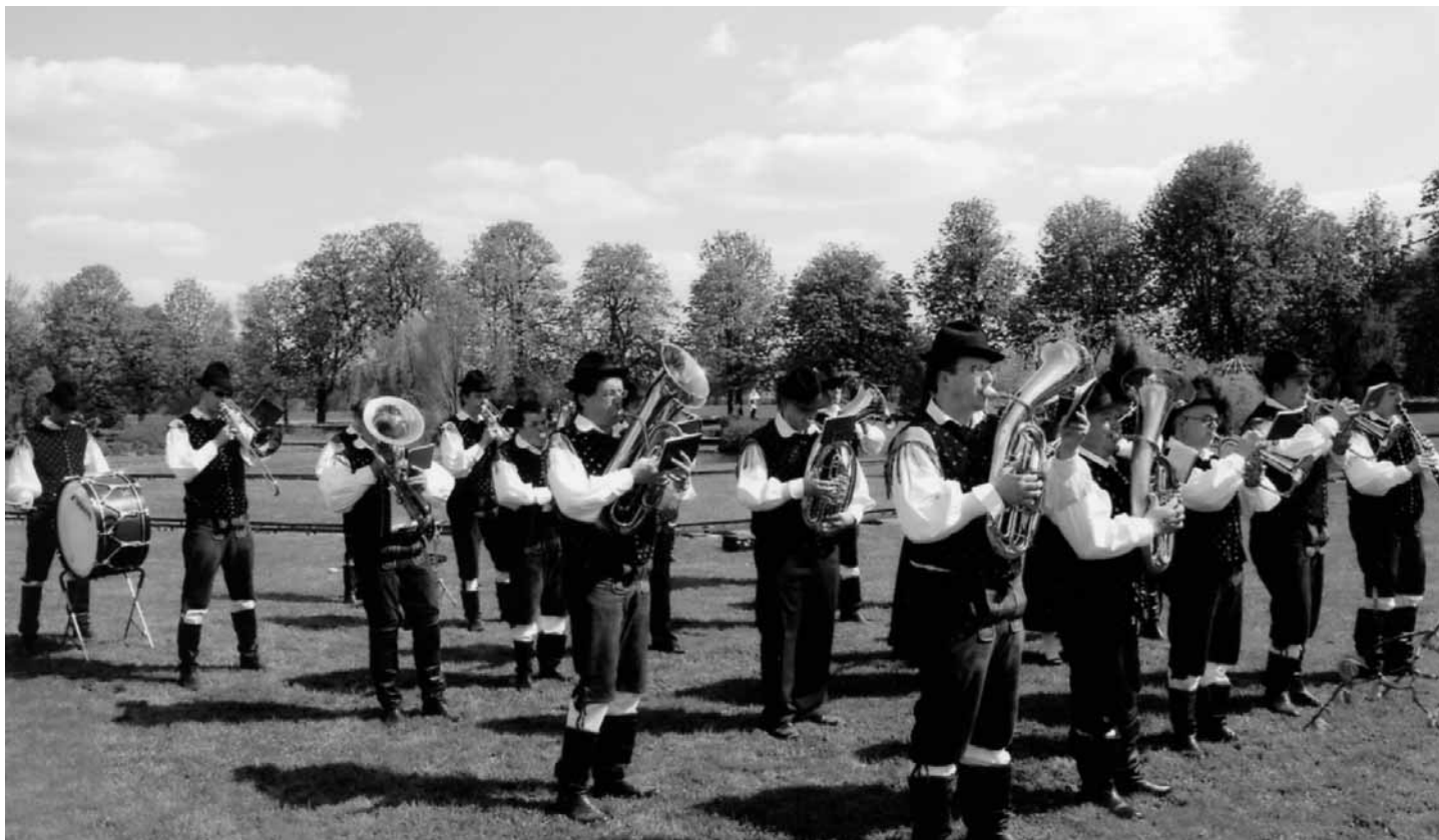
Mengeški godbeniki so nastopili v tradicionalnih narodnih nošah.