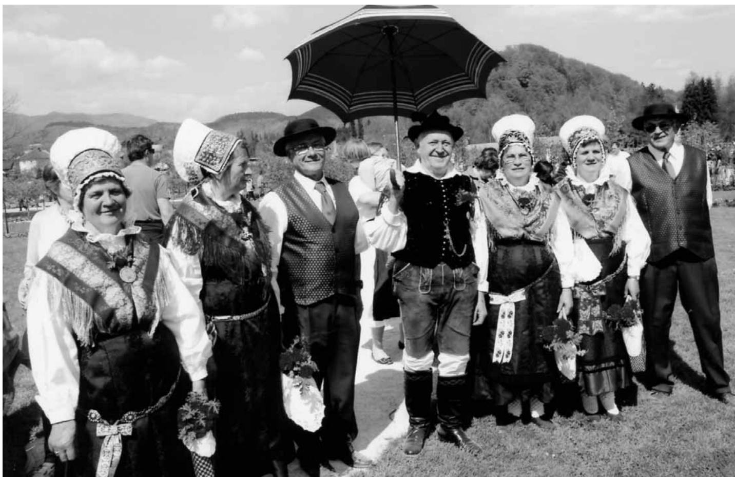
Narodne noše in čebelarji so pozirali številnim fotografom.