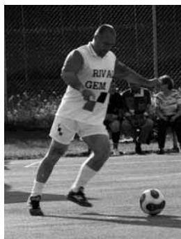
Mengeški župan v akciji