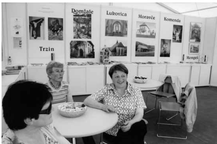
V skupnem paviljonu se je predstavilo sedem občin.