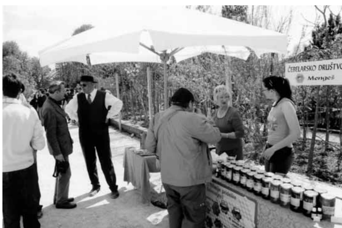
Uspešen je bil tudi nastop Čebelarkega društva z bogato ponudbo čebeljih proizvodov.