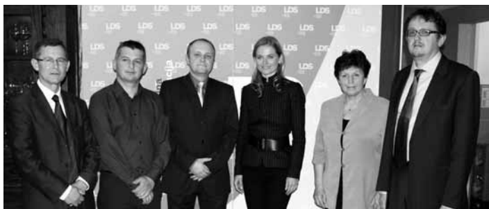
Občinski obor LDS Mengeš je obiskala predsednica Liberalne demokracije Slovenije