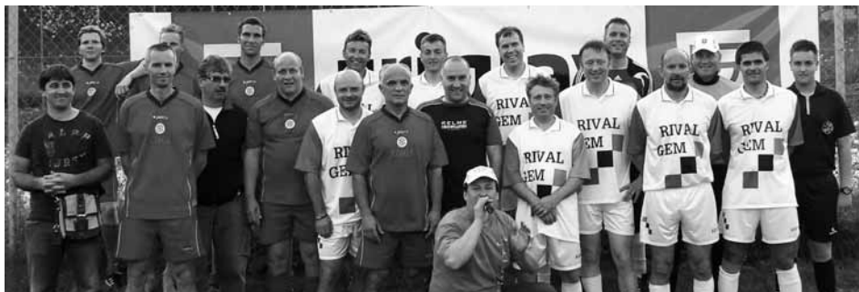
Skupinska slika vseh športnikov