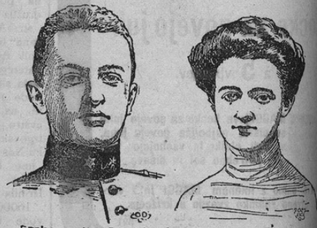
Erzherzog Karl Franz Josef Prinzessin Zita v. Bourbon-Parme Zur Verlobung am Wiener Hofe.

ki drži kaj na zdravo negovanje kože, ki hoče zlasti pege odstraniti ter mehko, nežno kožo in beli teint dobiti in obdržati, umiva se edino z „Steckenperfd“ lilijanim mlečnim milom (znamka „Steckenperfd“ od Bergmann & Co. Tetschen a. E. Kos za 80 h se dobi v vseh apotekah, drožerijah in trgovinah s parfumom itd.