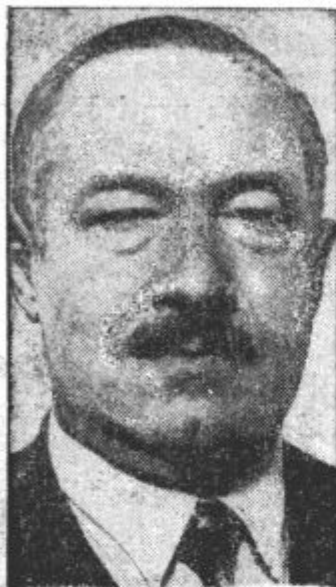
Koloman Daranyi, novi madžarski ministriški predsednik. Bil je že tudi minister v vladi pokojnega Gömbösa.

ki je izjavila, da je spricho zadržanja Nemčije in Italije ne veže več dogovor o nevmešava-